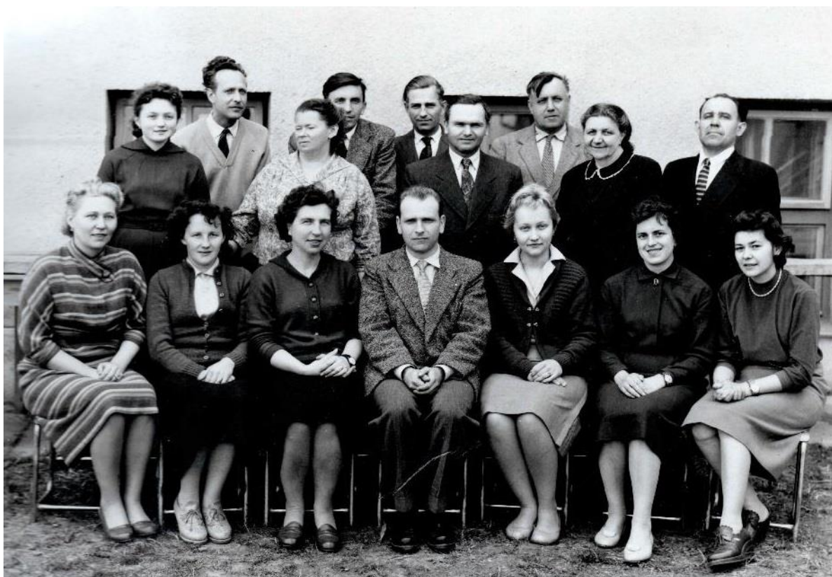
12. Archiv Základní školy v Hroznové Lhotě, Školní kronika Hroznové Lhoty, 1956–1972