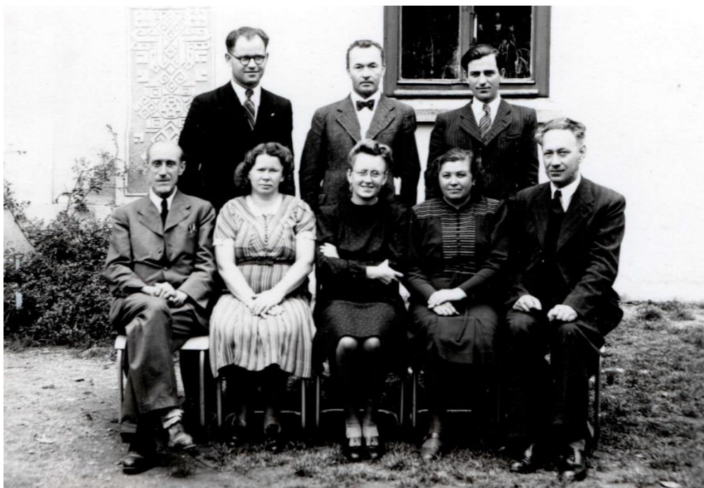
11. Archiv Základní školy v Hroznové Lhotě, Školní kronika újezdni měšťanské školy v Hroznové Lhotě, 1946–1955