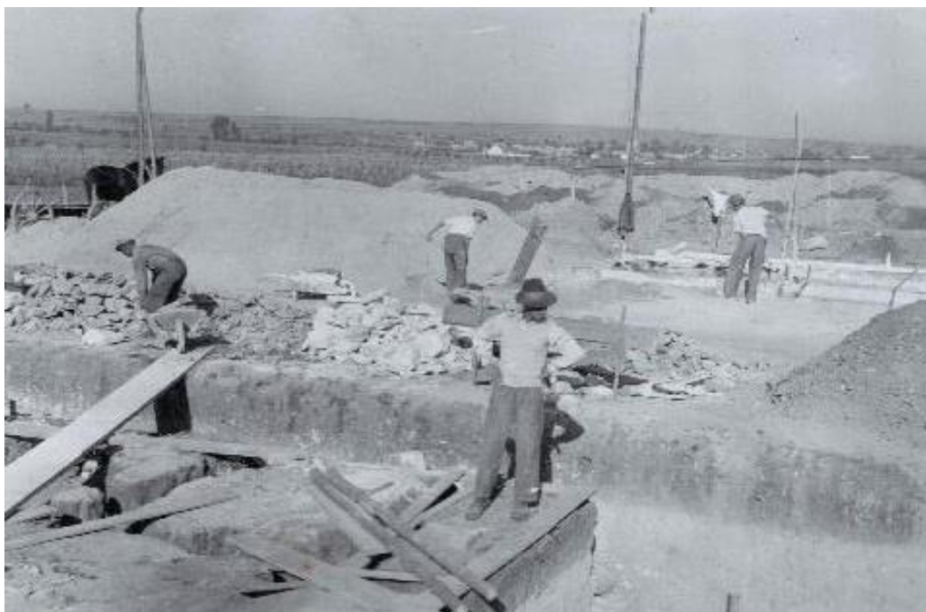
3. Archiv Základní školy v Hroznové Lhotě, Školní kronika újezdni měšťanské školy v Hroznové Lhotě, 1946–1955