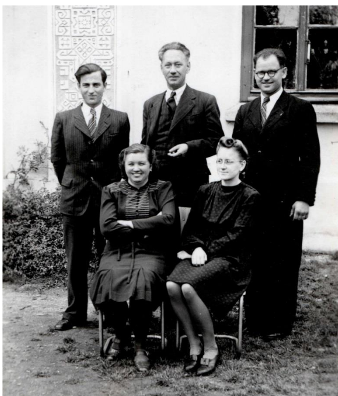
10. Archiv Základní školy v Hroznové Lhotě, Školní kronika újezdni měšťanské školy v Hroznové Lhotě, 1946–1955