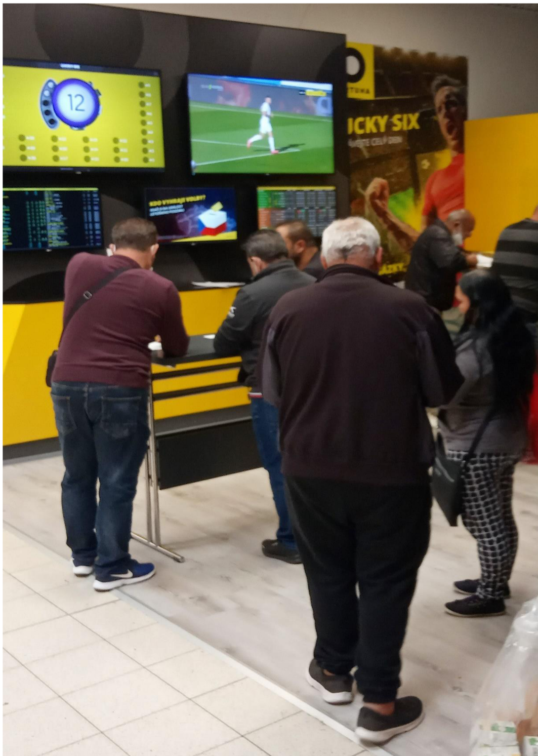
Obrázek 13