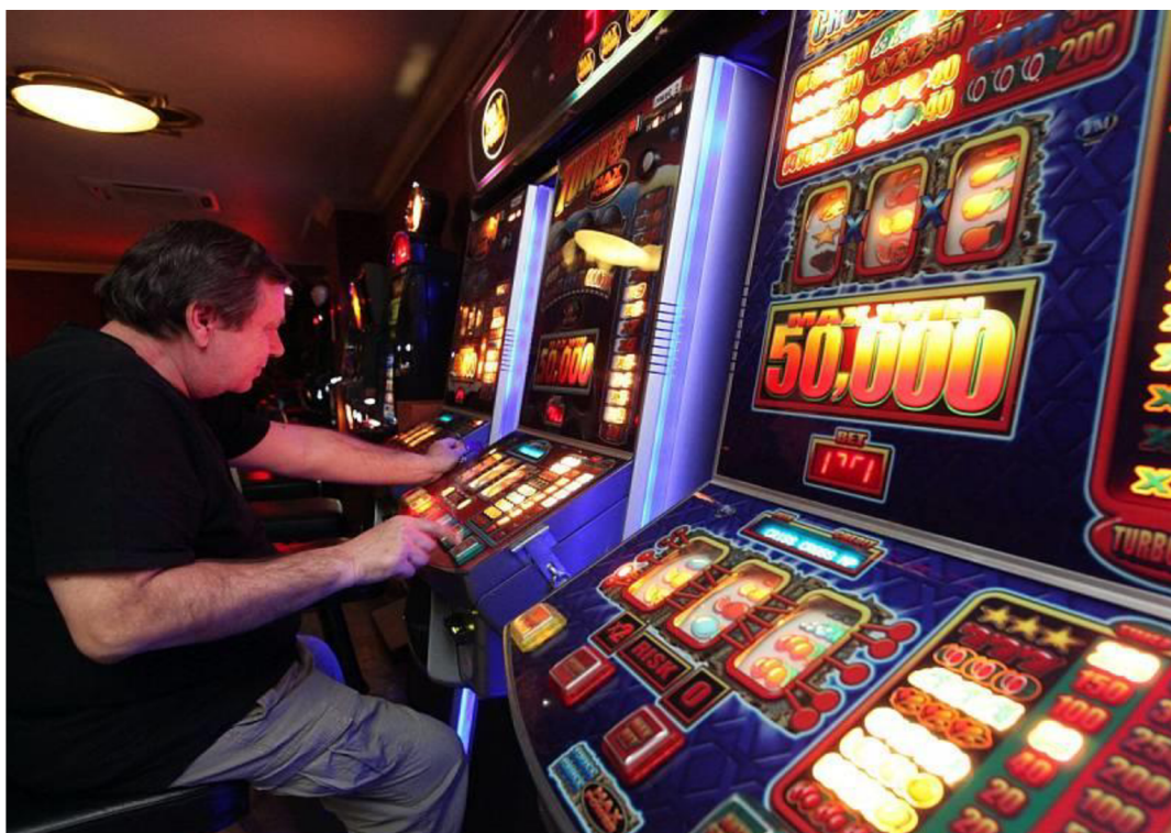
Obrázek 2