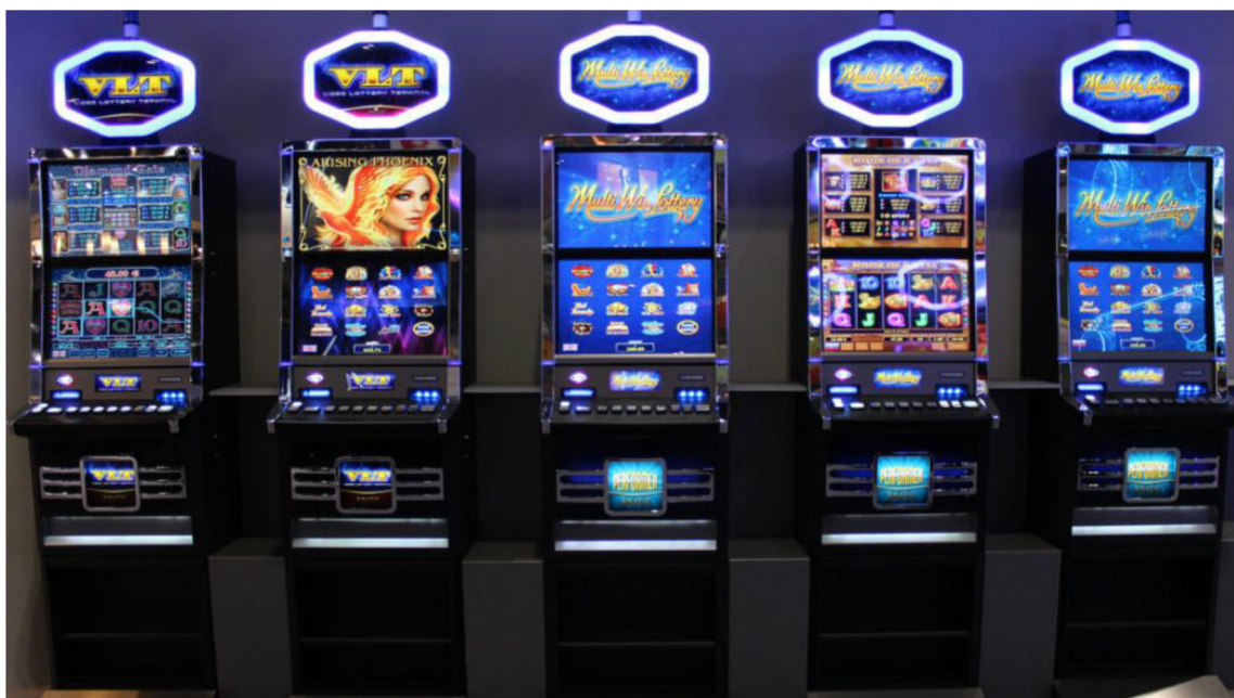
Obrázek 3