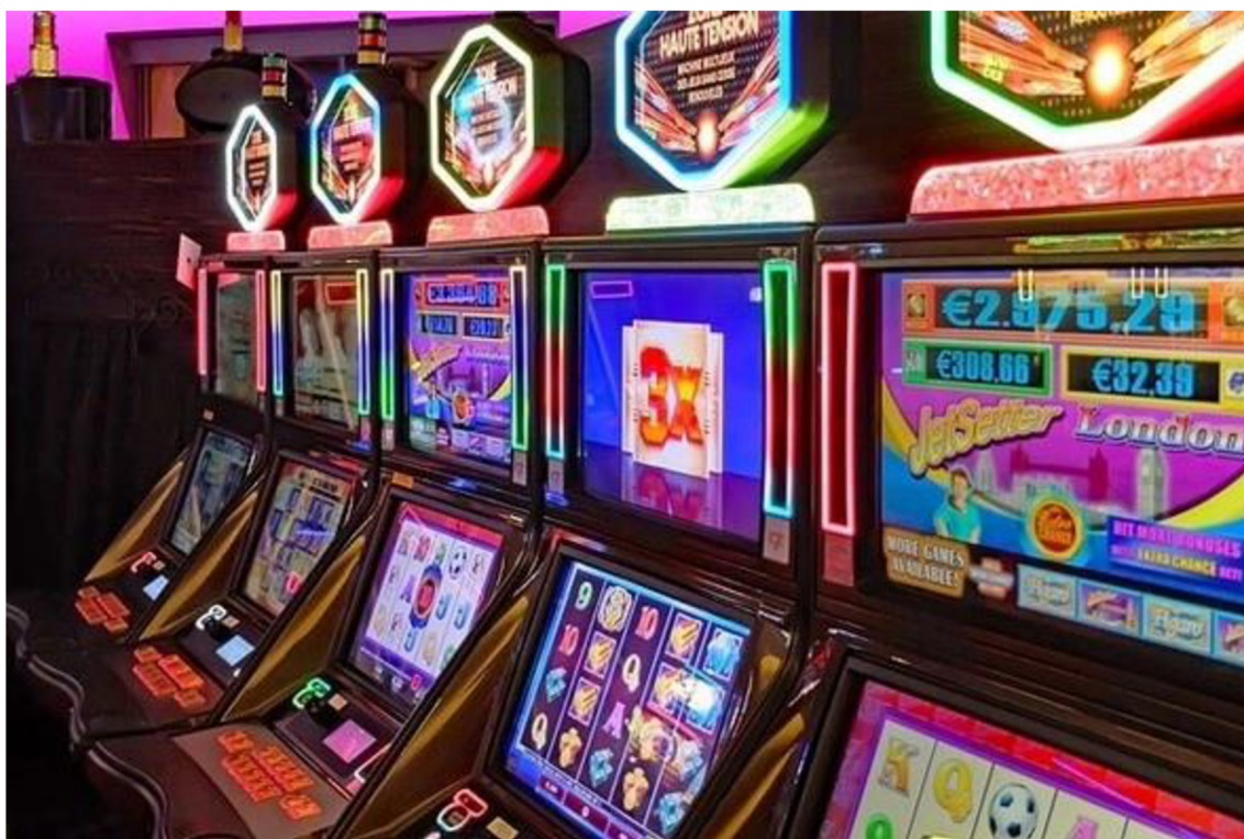
Obrázek 4