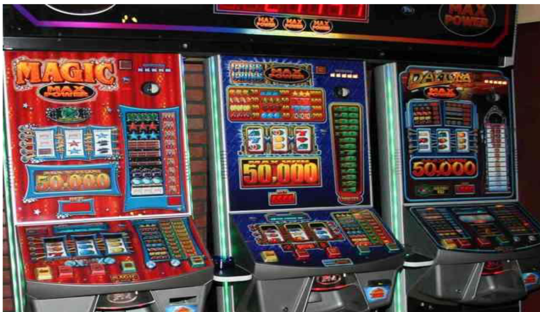
Obrázek 1