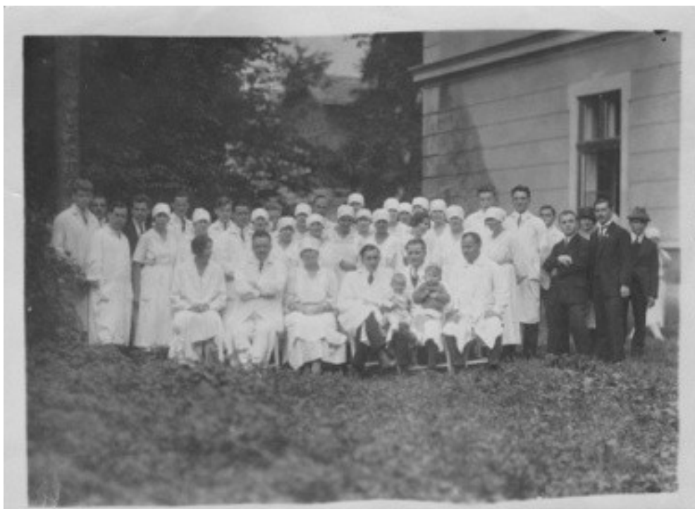
Příl. 4 - Lékařský a ošetrovatelský personál ve Státní nemocnici Mukačevo. 148