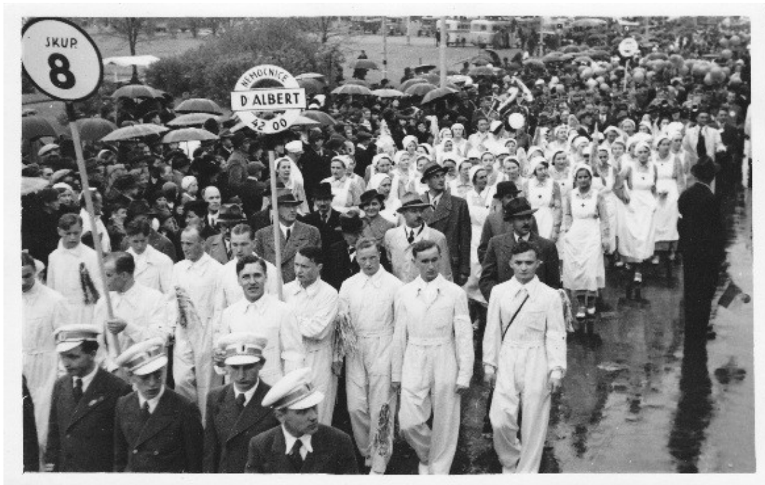
Příl. 7 - Oslava 1. Máje ve Zlíně, personál Baťovy nemocnice. 152