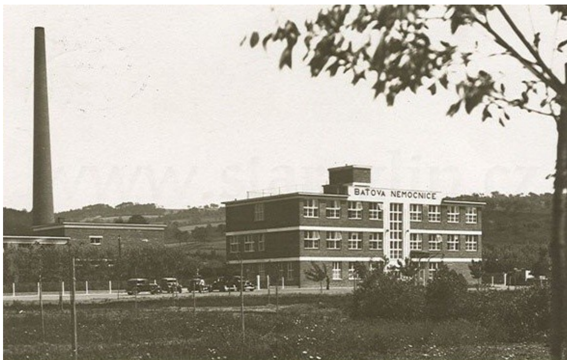
Příl. 1 - Baťova nemocnice mezi léty 1934-1936. 145