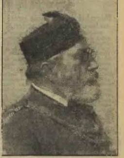
Šil byl předtím státním radou, nyní radní lékař v Praze.

Stále porušování mírových smluv: Itálie dodává Maďarsku otravné plyny!