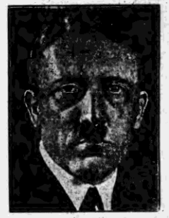
Adolf Hitler, Reichskanzler.