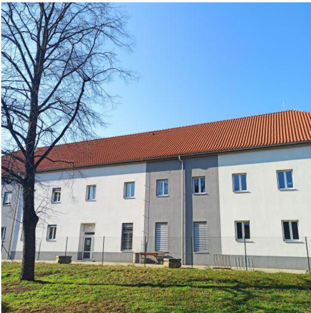
Obr. 7: Zregenerovaný objekt kasáren pod Radobýlem

Přínosem projektu je revitalizace dlouhodobě nevyužívaného areálu bývalého vojenského objektu za účelem podnikatelského využití.