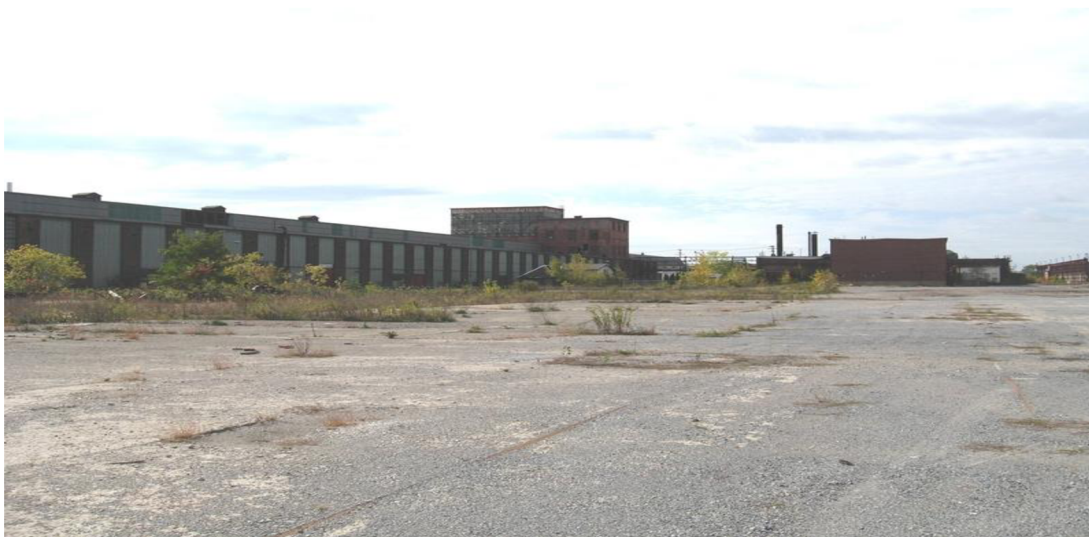
Obr. 3: Greyfield.

Bluefield je nevyužívaný objekt v blízkosti vodního zdroje. Jedná se o staré přístavy, mola, doky, loděnice (Pinch, Munt, 2002).