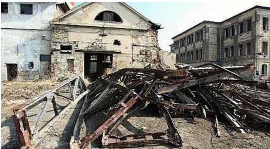
Obr. 2: Bývalá koželužna v Žalhosticích (Pech, 2011).

Greyfield je brownfield obklopený velkými plochami z asfaltového betonu, které měly kolem těchto areálů funkci parkovišť nebo dopravní infrastruktury (Moeller, 2011).