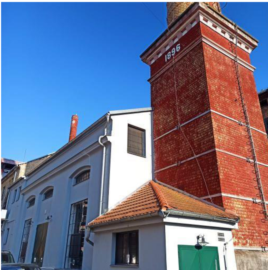
Obr. 6: Zregenerovaná budova A Pivovaru Litoměřice

Přínos projektu spočívá v regeneraci, konkrétně jižní části východní budovy „A“, která proběhla v roce 2019, pomohla zachránit a podnikatelsky oživit nevyužívaný průmyslový areál bývalého pivovaru, který celkově chátral a jehož regenerací byla ze stavebního hlediska zachráněna část budovy A. V nevyužívaném areálu se podařilo obnovit tradiční výrobu piva. To vedlo k vytvoření nových pracovních míst, nárůstu HDP a podnikatelských aktivit. Místo nabylo na atraktivitě, což vedlo ke zvýšení cestovního ruchu v oblasti, vylepšila se tvář města i celkově Ústeckého kraje. Došlo ke snížení nevyužívaných ploch brownfields na území města Litoměřic a v neposlední řadě se zlepšila kvalita životního prostředí (Město Litoměřice, 2020).