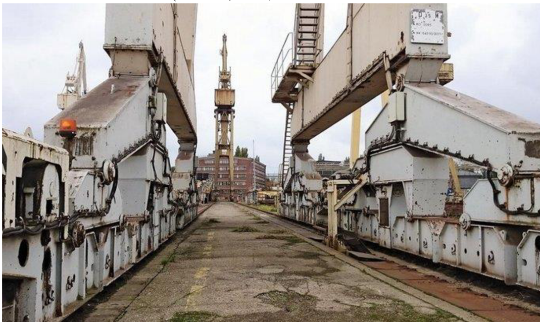
Obr. 4: Štětínské loděnice (Stuchlík, 2015).

Regenerace je snaha o opětovné oživení, ozdravení míst. Většinou se týká industriálních objektů, které jsou přebudovány k jinému využití nebo jsou úplně odstraněny (Doleželová, 2015).