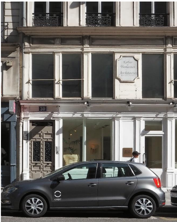
Figure 3 Figure 3 La seconde adresse de Svědectví, 30, la rue de la Croix des Petits Champs, Paris.