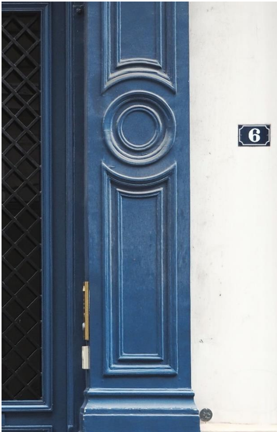
Figure 1 La première adresse de Svědectví dans 6, la rue Pont de Lodi, Paris.