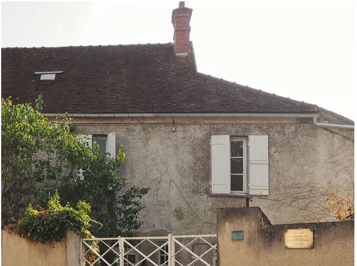
Figure 10 L'ancienne maison de la famille Tigrid à Héricy.