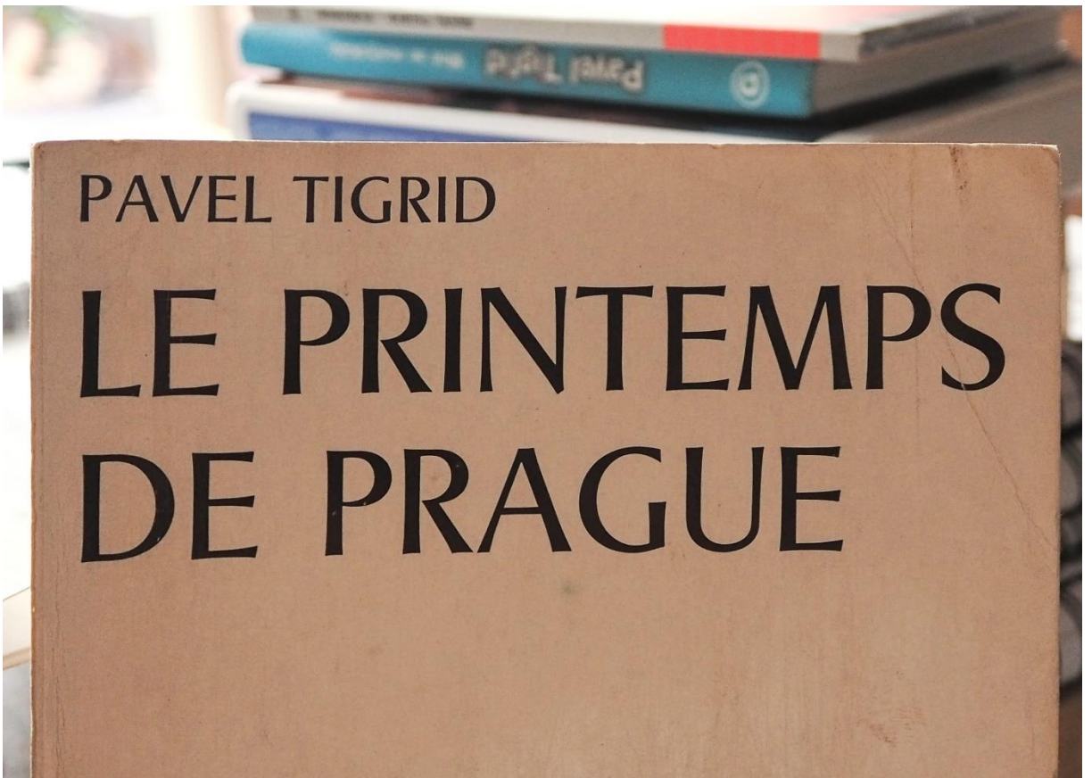
Figure 6 Le livre de Pavel Tigrid qui a attiré l'attention du public français (de la bibliothèque de Grégory Tigrid).