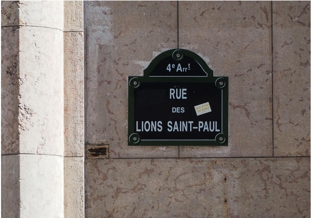
Figure 5 La rue où se trouvait le Comité international pour le soutien des principes de la Charte 77