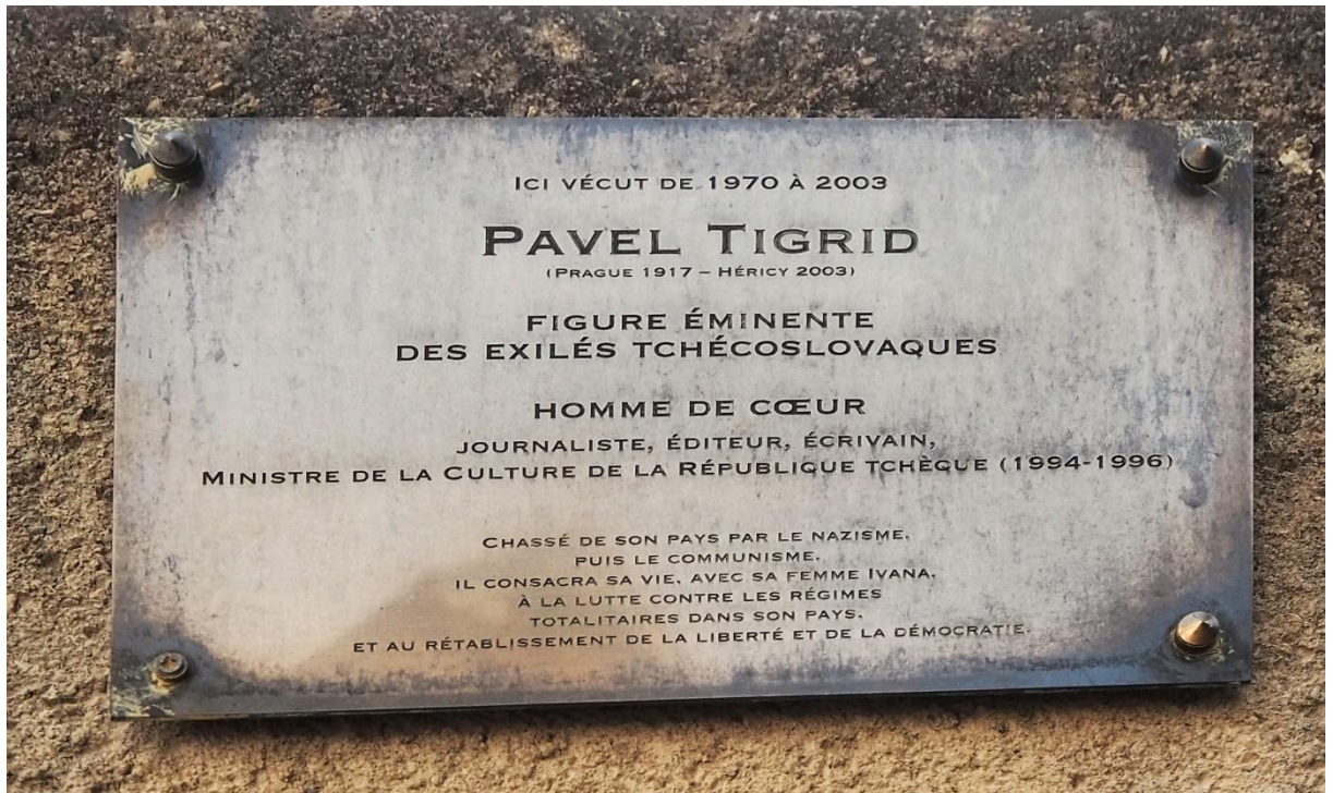
Figure 11 La plaque hommage dédiée à Pavel Tigrid, à Héricy