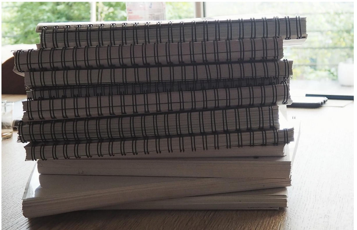
Figure 8 Les dossiers collectés par la police secrète tchécoslovaque sur Pavel Tigríd (de la bibliothèque de Grégory Tigríd).