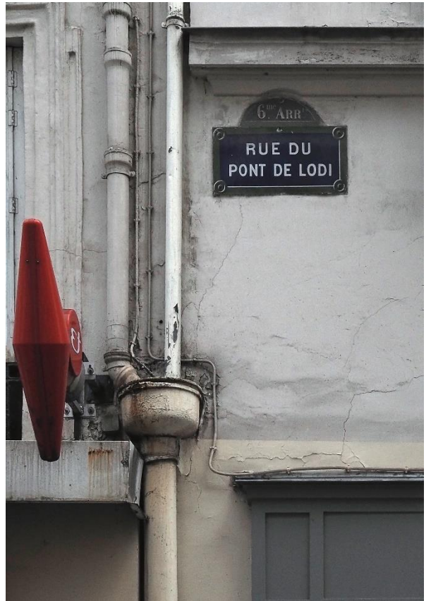
Figure 2 La première adresse de Svědectví dans 6, la rue Pont de Lodi, Paris.