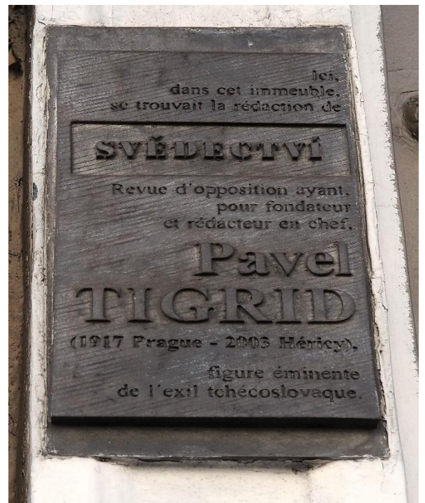
Figure 4 La plaque hommage dédiée à Svědectví, 30, la rue de la Croix des Petits Champs, Paris.