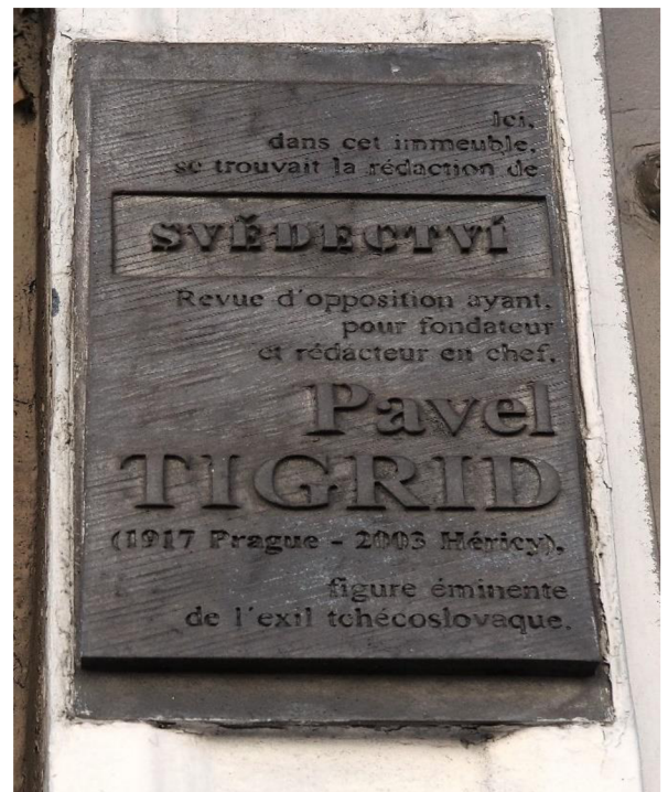
Figure 4 La plaque hommage dédiée à Svědectví, 30, la rue de la Croix des Petits Champs, Paris.