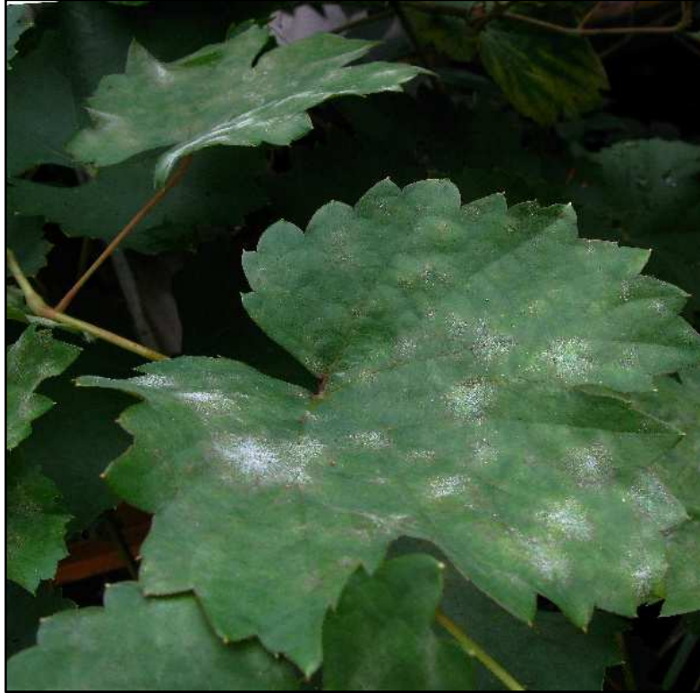
Fotografie č. 18 - Na podzim se na listech mohou tvořit tmavé miniaturní plodničky (pohlavní stádium), netrénovaným okem téměř neviditelné.