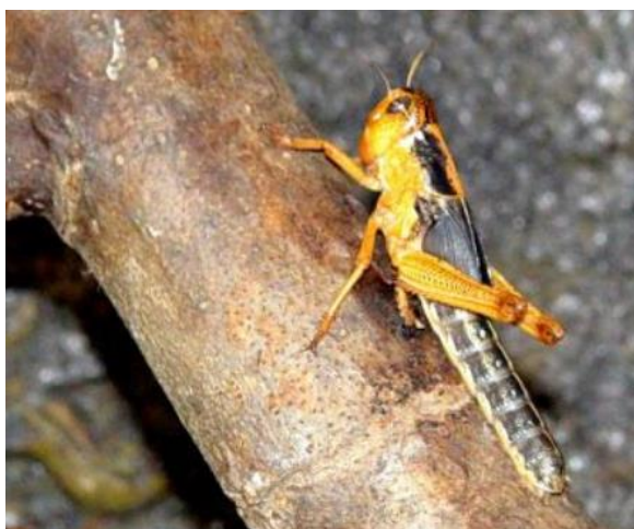
Obrázek č. 4. Saranče stěhovavá [foto]. In ZOO Chleby [online]. Upraveno [cit. 2023-02-15]. Dostupné z: https://www.zoochleby.cz/sarance-stehovava-6268/