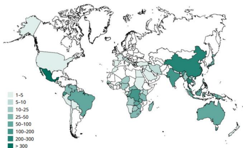
Obrázek č. 1. Zaznamenaný počet konzumovaných druhů hmyzu podle zemí [foto]. In: Fao.org [online]. Upraveno [cit. 2023-02-02]. Dostupné z: https://www.fao.org/3/i3253e/i3253e.pdf

Obrázek 1 znázorňuje míru konzumace jedlých druhů hmyzu podle jednotlivých států v celosvětovém měřítku. Státy jako je například Mexiko a Čína patří v oblasti počtu konzumovaných druhů hmyzu na první příčky, kdy hodnota přesahuje 300 druhů konzumovaného hmyzu. Na mapě jsou zvýrazněny tmavě zelenou barvou. Státy vyznačené bílou barvou, jako je například Kanada, Rusko a velká část evropských států představují opak v počtu konzumovaných druhů hmyzu. Hmyz se zde vůbec nekonzumuje nebo pouze v malé míře, což čítá 1-5 druhů hmyzu.