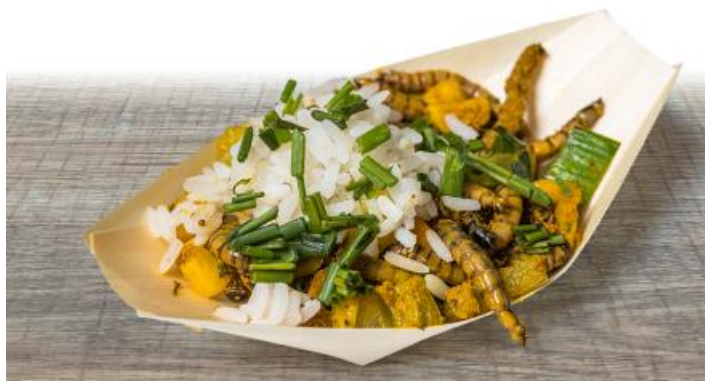
Obrázek č. 7. Pokrm připravený z celých zástupců hmyzu [foto]. In ZOO Praha [online]. Upraveno [cit. 2023-03-15]. Dostupné z: https://www.zoopraha.cz/aktualne/akce-v-zoo-praha/13584-vikend-hmyzozravcu