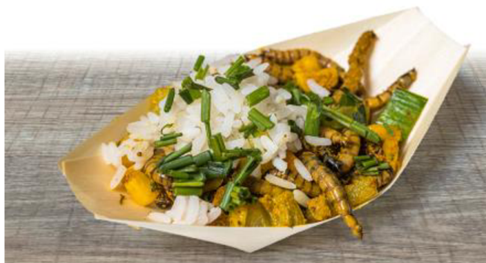
Obrázek č. 7. Pokrm připravený z celých zástupců hmyzu