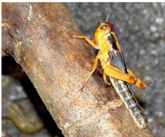
Obrázek č. 4. Saranče stěhovavá