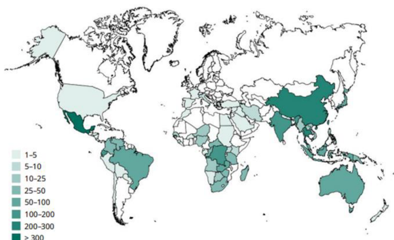
Obrázek č. 1. Zaznamenaný počet konzumovaných druhů hmyzu podle zemí [foto]. In: Fao.org [online]. Upraveno [cit. 2023-02-02]. Dostupné z: https://www.fao.org/3/i3253e/i3253e.pdf

Obrázek 1 znázorňuje míru konzumace jedlých druhů hmyzu podle jednotlivých států v celosvětovém měřítku. Státy jako je například Mexiko a Čína patří v oblasti počtu konzumovaných druhů hmyzu na první příčky, kdy hodnota přesahuje 300 druhů konzumovaného hmyzu. Na mapě jsou zvýrazněny tmavě zelenou barvou. Státy vyznačené bílou barvou, jako je například Kanada, Rusko a velká část evropských států představují opak v počtu konzumovaných druhů hmyzu. Hmyz se zde vůbec nekonzumuje nebo pouze v malé míře, což čítá 1-5 druhů hmyzu.