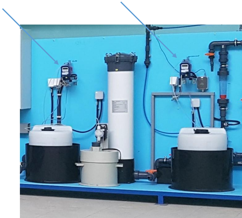
Obr. 5 Automatické dávkovače na chemii (WATERLife, 2023)