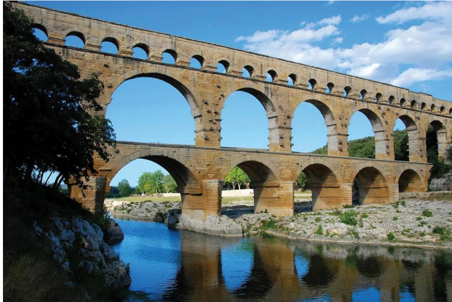
Obr.1 Pont du Gard (The editors of Encyclopaedia Britannica)

Díky znalostem antických Římanů o nakládání s vodou, byli schopni stavět tak obrovská města. Zaostávali v zacházení s odpadní vodou, to bylo jedno z velkých nebezpečí antického světa pro zdraví člověka. (Juuti et al. 2007)