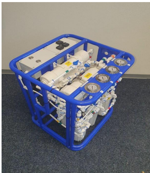
Obr. 6 Přenosná úpravna vody (WATERLife, 2023)