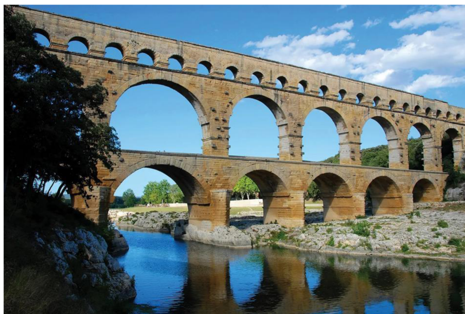
Obr.1 Pont du Gard (The editors of Encyclopaedia Britannica)

Díky znalostem antických Římanů o nakládání s vodou, byli schopni stavět tak obrovská města. Zaostávali v zacházení s odpadní vodou, to bylo jedno z velkých nebezpečí antického světa pro zdraví člověka. (Juuti et al. 2007)