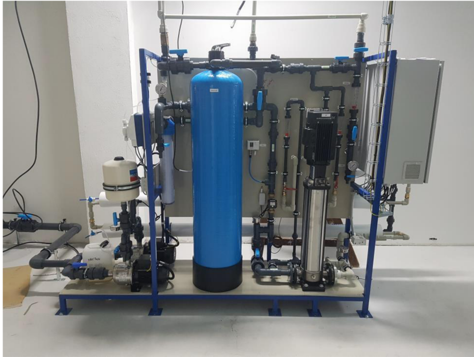
Obr. 2 Malá úpravna vody (WATERLife, 2023)