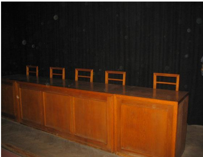
Foto č. 4 - místnost tzv. rakvárna