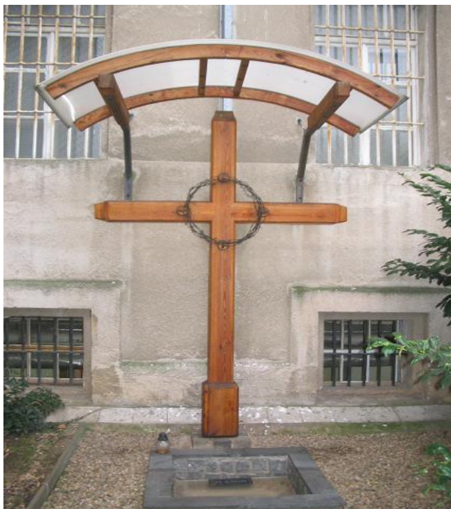
Foto č.1 - Původní místo kde stála šibenice, nyní pietní místo VV- Praha - Pankrác