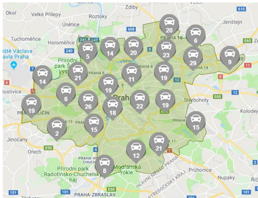
Obrázek 2 Zóna dostupnosti vozidel v Praze

Elektromobil by neměl mít méně než 25 % z celkové kapacity akumulátorů. Při dobíjení akumulátorů se neúčtuje čas strávený dobíjením vozu. Dobíjení vozu probíhá u dobíjecích stanic PRE a ČEZ, u klíčů od vozidla se nachází speciální čip, který slouží k dobíjení u dobíjecích stanic. [6]