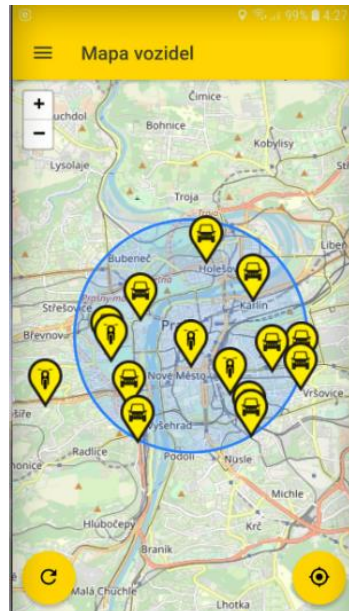
Obrázek 1 Zóna dostupnosti vozidel v Praze

Než se vozidlo odstaví je potřeba splnit tyto kroky. Zabrzdít vozidlo ruční brzdou, zařadit otočným kolečkem "neutrál" N, zavřít všechna okna, vypnout motor, nechat klíčky v zapalování, vystoupit z auta a zavřít všechny dveře. Při odstavení motorčky je potřeba splnit tyto kroky. Sklopit stojan, vrátit přilbu do boxu, vypnout tlačítkem POWER. [9]