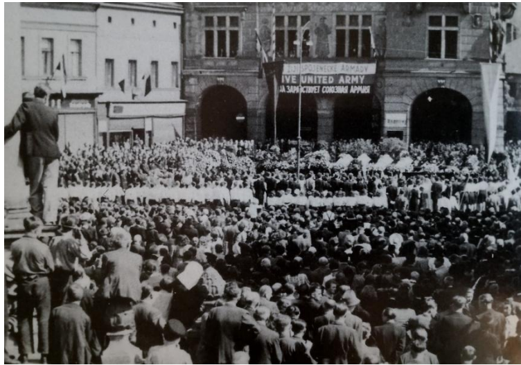
Smuteční tryzna na náhodském náměstí za mrtvé Rudoarmějce 10. května Zdroj: Tamtéž , s. 72