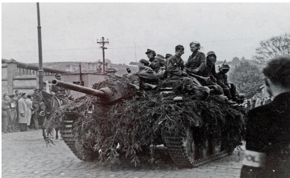
Skupina SS přijíždí do Náchoda 9. května 1945 zdroj: Václav SÁDLO, Běloveská tragédie , Červený Kostelec 2009, s. 19.