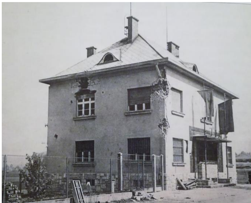
Příloha č. 11