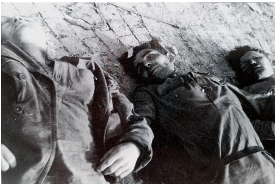
Zavraždění Rudoarmějci před běloveskou celnicí Zdroj: Václav SÁDLO, Běloveská tragédie , Červený Kostelec 2009, s. 35.