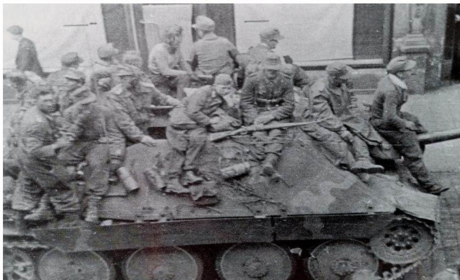
Príslušníci zbraní SS na korbě Hetzeru v ulici Kamenice v Náchodě