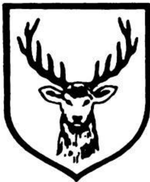
Znak 31. dobrovolnické granátnické divize SS