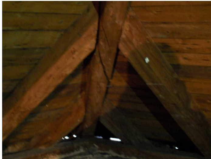
Nalomený střešní trám na půdě české celnice jako pozůstatek zásahu z projektilu samohybného děla Hetzer