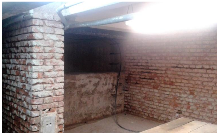
Sklepení celnice