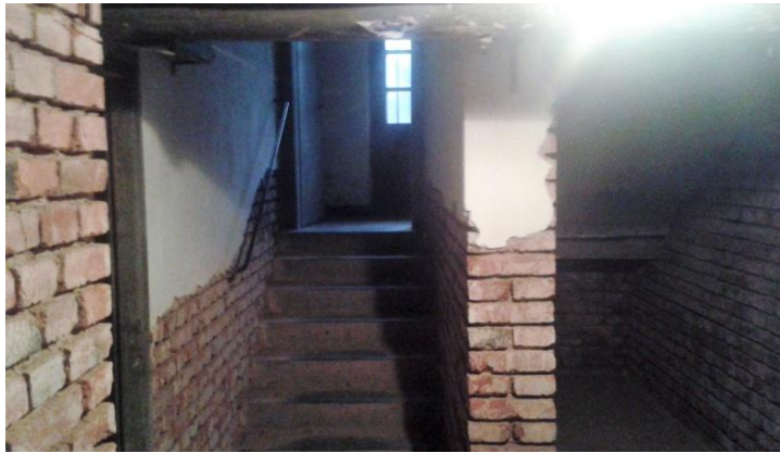
Schodiště vedoucí ze sklepení, po kterém vycházeli Rudoarmějci do odbavovací haly, kde byli stříleni do týla