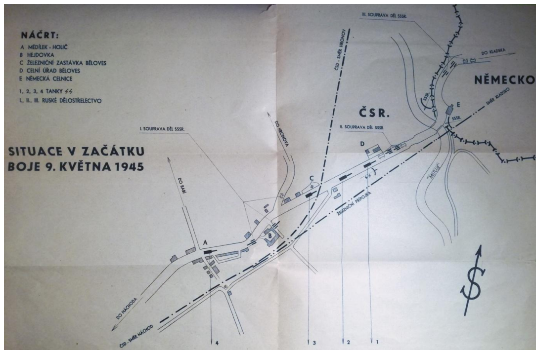
Plán boje u běloveské celnice 9. května zdroj: Josef HRUŠKA, Z posledních dnů...9. května 1945 , Náchod 1945, s. 17.