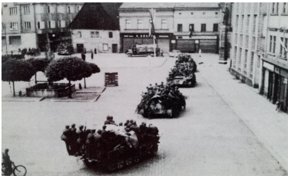
Hetzery se na náhodském náměstí otáčejí a vrací se k běloveské celnici Zdroj: Václav SÁDLO, Běloveská tragédie , Červený Kostelec 2009, s. 23.