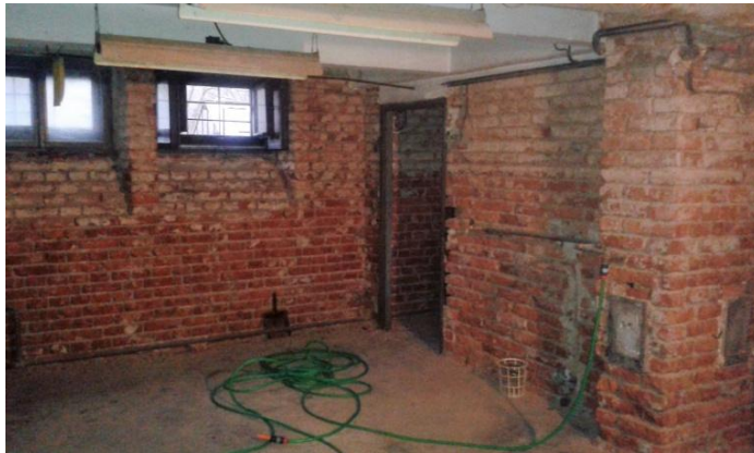
Úkryt Rudoarmějců a náchodských občanů ve sklepě české celnice