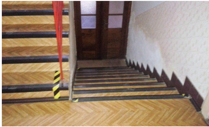
Schody vedoucí ze sklepa do odbavovací haly celnice