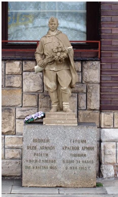
Socha sovětského vojáka na památku padlých Rudoarmějců před budovou celnice