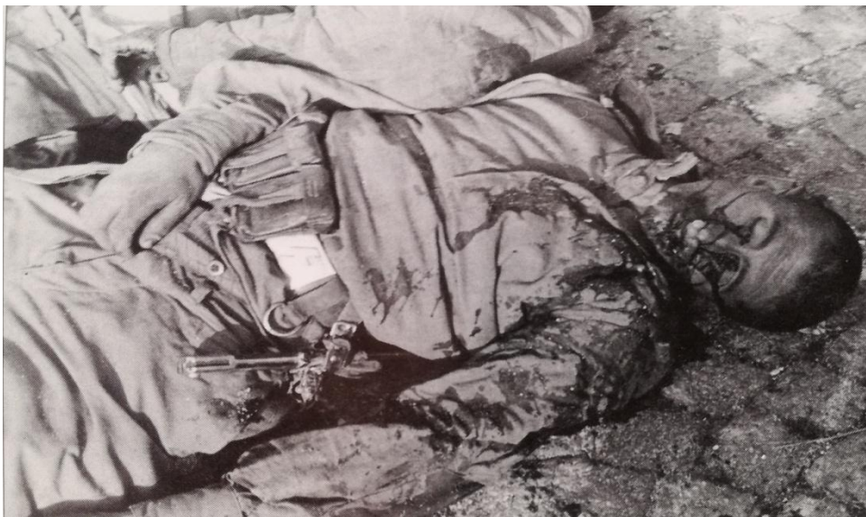
Jeden ze zavražděných vojáků Rudé armády před běloveskou celnicí Zdroj: Taměž , s. 35.