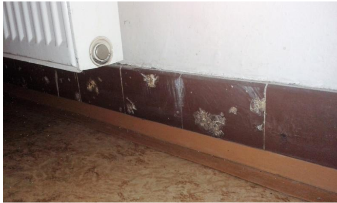
Stopy kulek v kachličkovém obložení ve vstupní hale české celnice