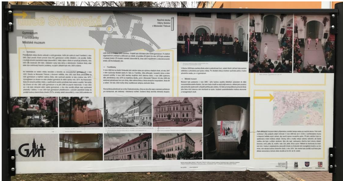
Obrázek 3. Informační cedule F

1) Vypočítej, jak dlouho trvalo první působení městského gymnázia od jeho vzniku až po jeho uzavření.