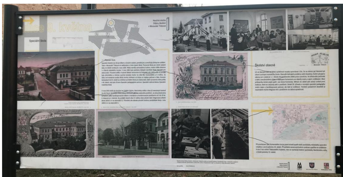
Obrázek 4. Informační cedule H

1) Popiš, pro koho slouží speciální škola a které děti do ní dochází na vyučování.