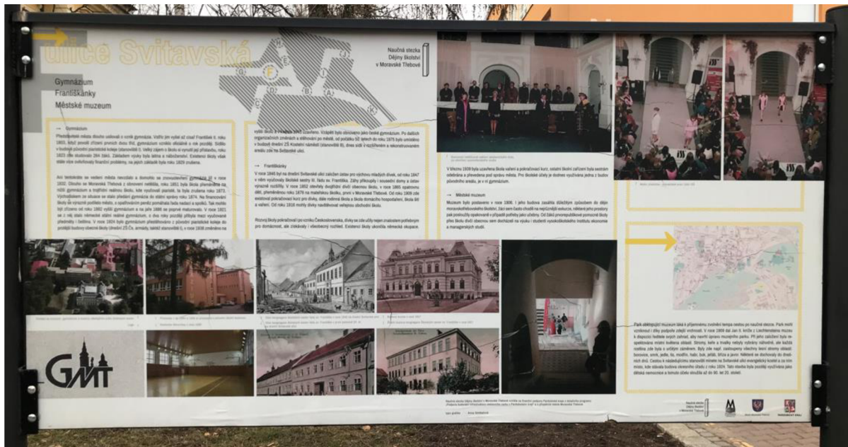
Obrázek 3. Informační cedule F