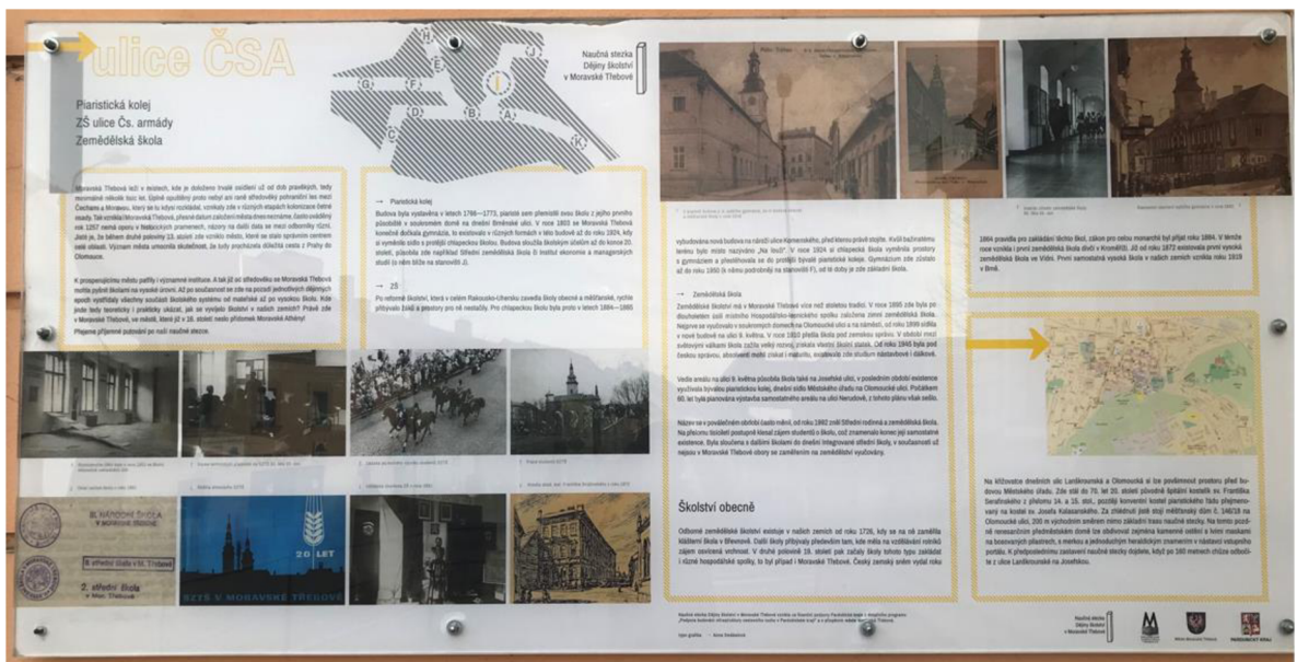
Obrázek 5. Informační cedule I

1) Co se v dávných dobách rozprostíralo na místě, kde dnes stojí naše město Moravská Třebová? Bylo tu již nějaké osídlení?