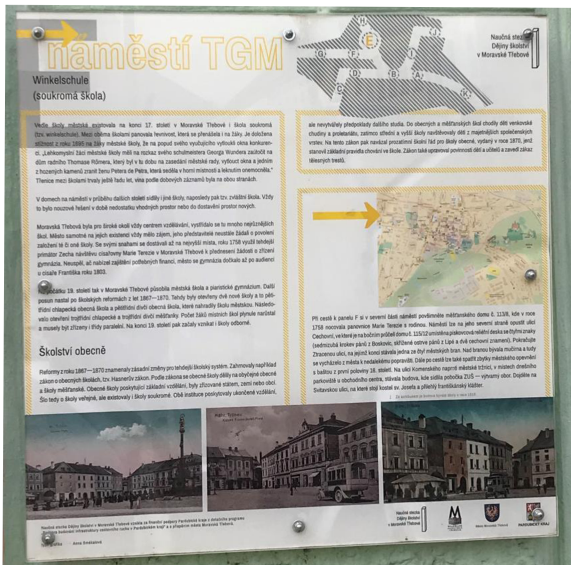
Obrázek 2. Informační cedule E