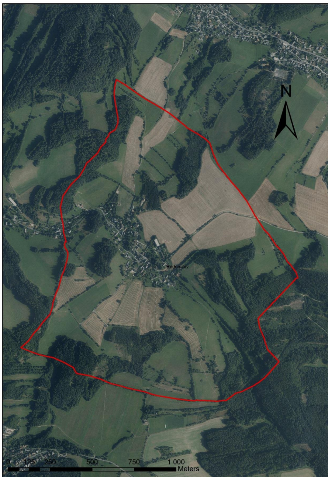
Obrázek 1: Obrázek katastru obce Radomilov na podkladu ortofotomapy