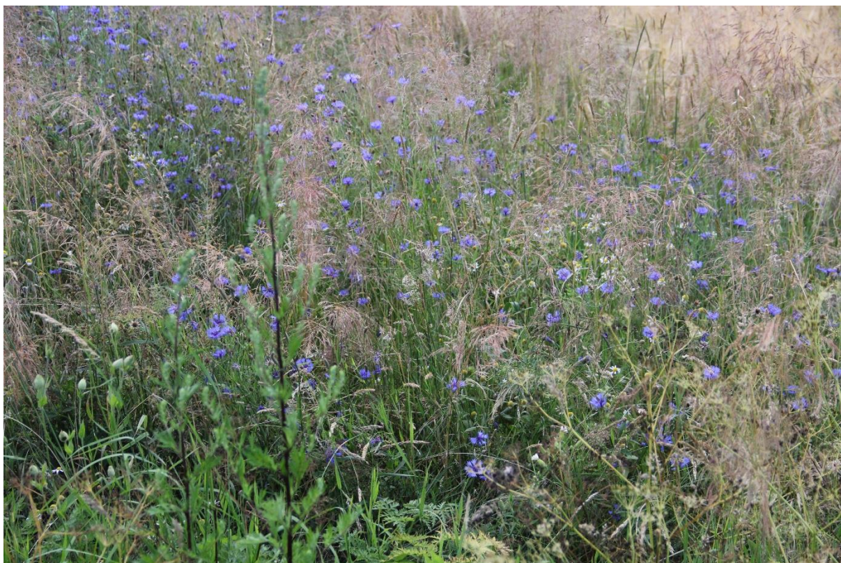
Obrázek 3: Fotka chrpy polní z terénního výzkumu v ječmenu jarním