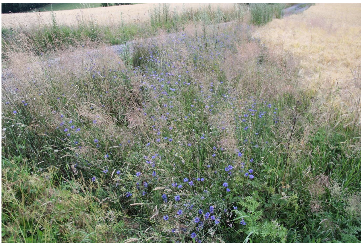
Obrázek 4: Fotka rohu pole v ječmenu jarním