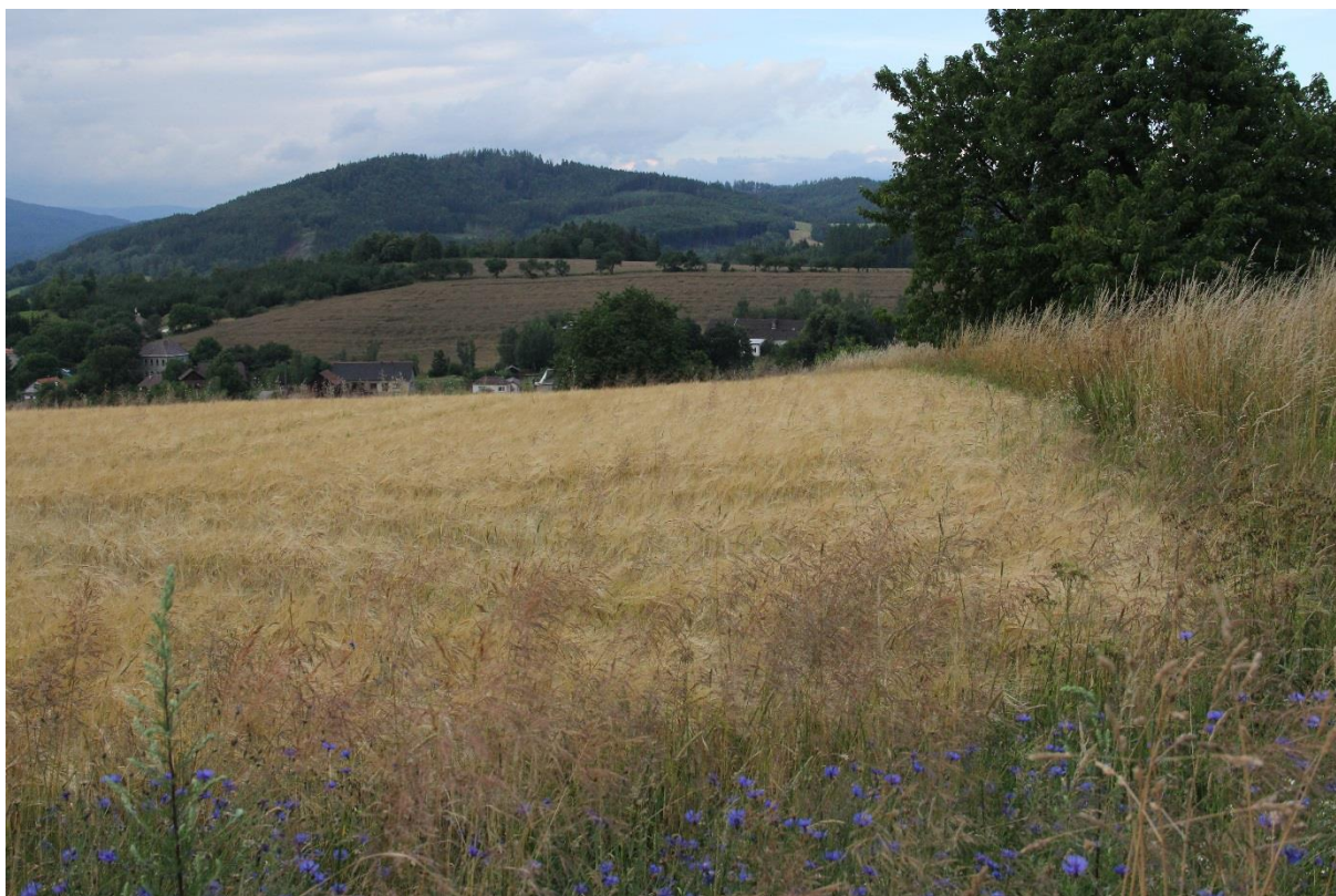
Obrázek 5: Ječmen jarní, na protější straně řepka olejná