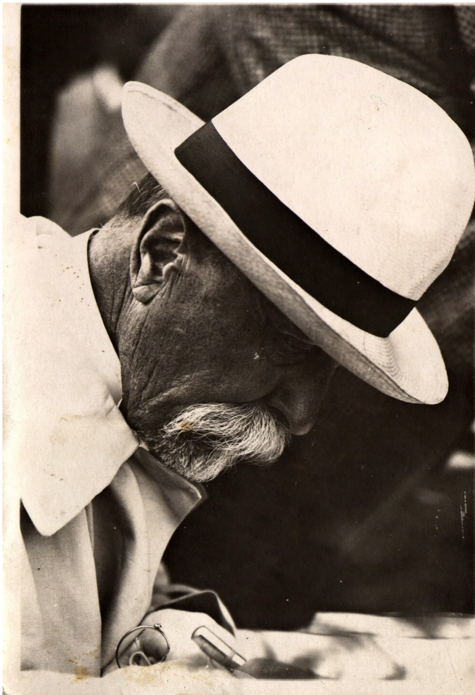
Obrázek 1- T. G. Masaryk