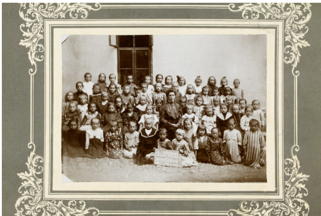
Obrázek 4- Fotografie začek první třídy obecné školy dívčí MZA v Brně-SOKA Kroměříž. Školní kronika školy Bystřice pod Hostýnem. 1870-1924. B-e 10.