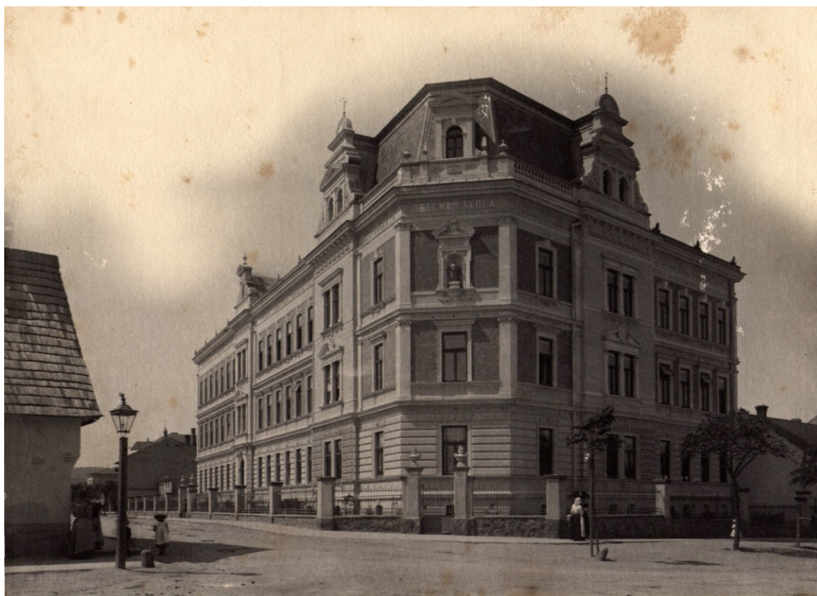
Obrázek 3- Fotografie Měšťanské školy chlapecké MZA v Brně-SOKA Kroměříž. Školní kronika měšťanské školy chlapecké z let 1897-1939, B-e 9