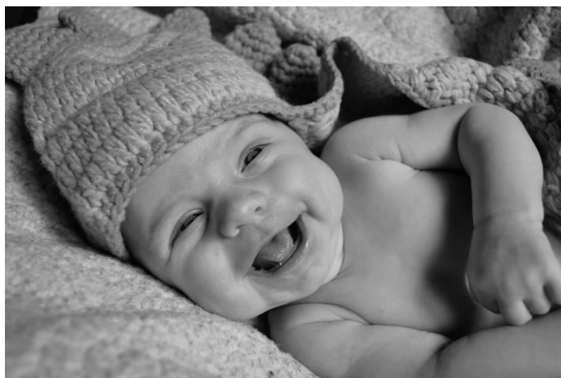
Obrázek č. 1 VÍTEK

„Pouto, jež spojuje tvou skutečnou rodinu, není v krvi, ale ve vzájemné úctě a radosti vašich životů. Málokdy vyrostou členové jedné rodiny pod jednou střechou.“