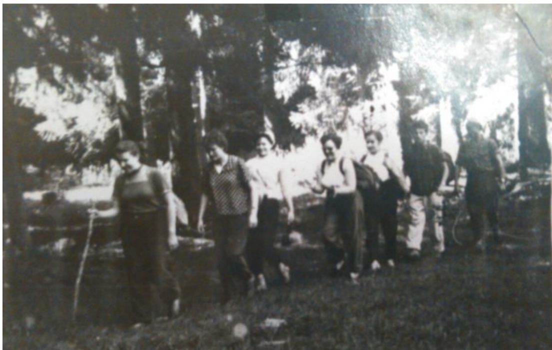
Výlet pořádaný jedním ze Zakarpatských turistických klubů, který vznikl díky Klubu Československých turistů; Zdroj: domácí archiv