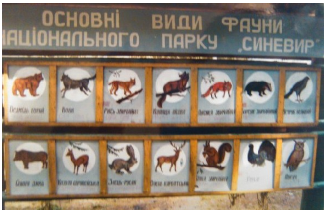
Informativní tabule „Syněvir“