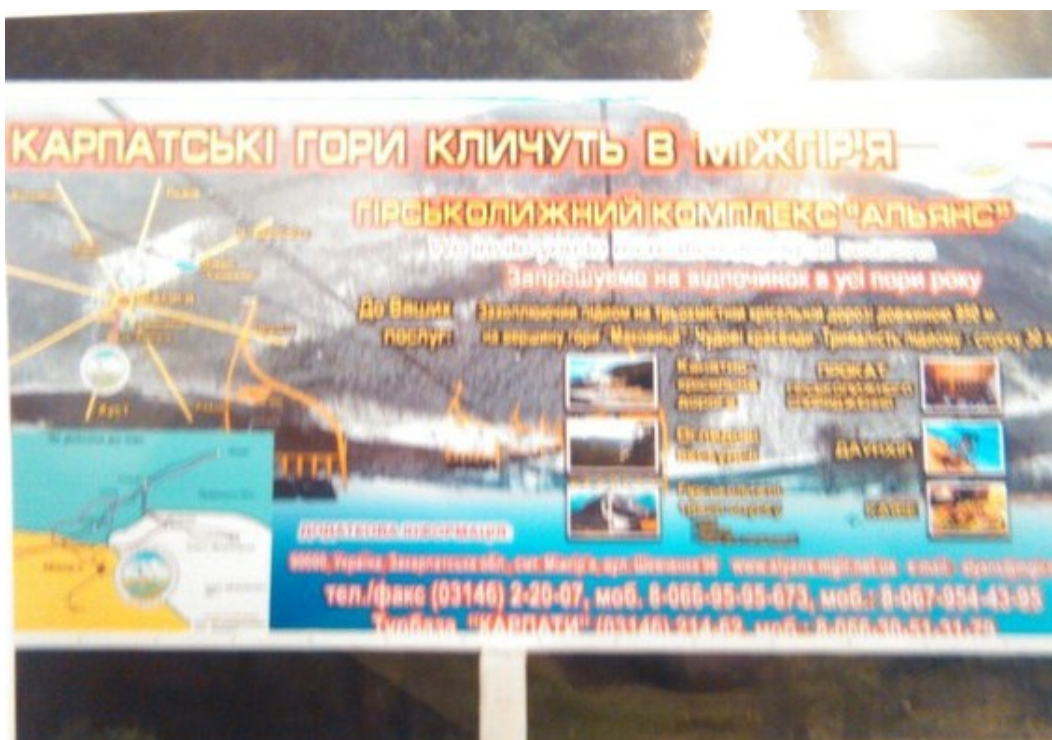
Informativní tabule v Mižhirji; Zdroj: domácí archiv