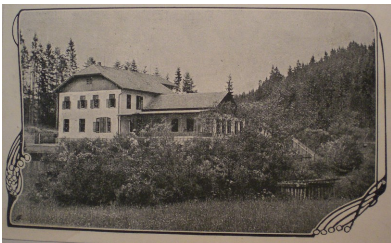
Obrázek 5-Budova české školy v Domašově nad Bystřicí