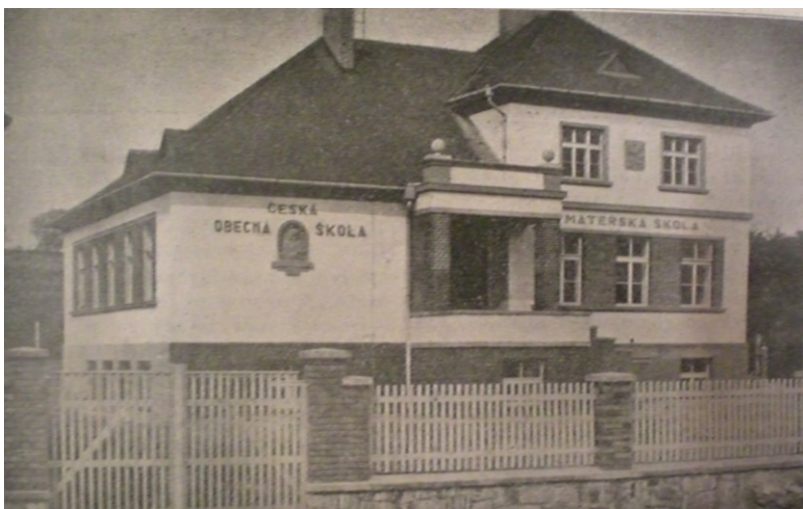
Obrázek 6-Novostavba české školy v Mladějovicích na konci dvacátých let