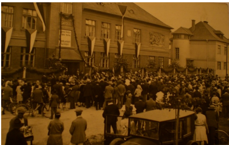
Obrázek 4-Slavnostní otevření české školy ve Šternberku 2. září 1923