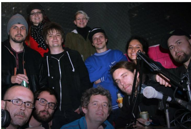
Obrázek 3: SC Community