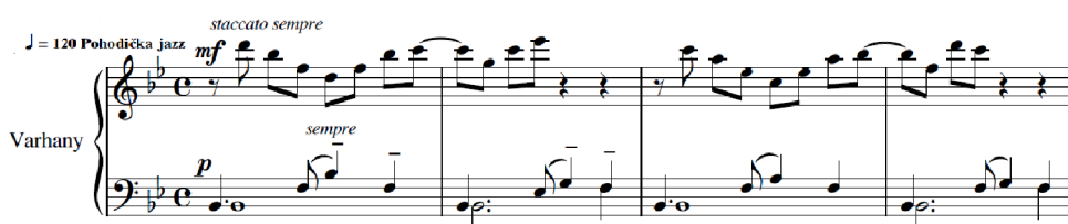
Obr. 6: Část varhanní přede hry

Varhany začínají hrát osmitaktovou předeheru, v níž se objevuje typický houpavý jazzový rytmus, který posluchače provází celou skladbou a utichá až na samotném závěru v posledních třech taktech, kdy zaznívá poslední akord. Tento ostinátní rytmus hraje varhaník levou rukou. V předeherě hraje varhaník pravou rukou melodii, kde se objevují pro jazz typické synkopy. Byť autor v notovém zápisu výslovně neuvádí rozdělení levé a pravé ruky na dva manuály, lze to vytušit z rozdílné dynamiky pro levou a pravou ruku. Melodie hraná na jiný manuál, zvláště pokud se hraje na průraznější rejstřík, lépe vynikne.