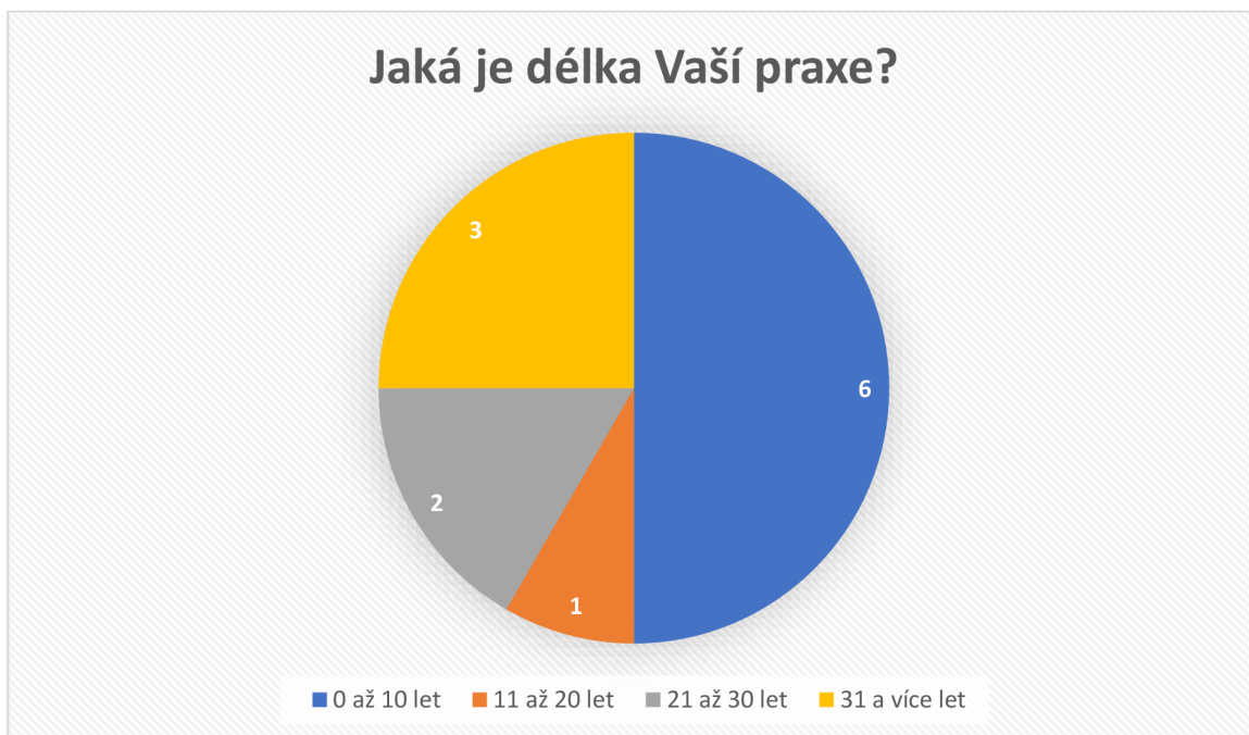
Graf 2: Jaká je délka Vaší praxe?

Tato otázka byla významná pro výzkum, protože délka praxe do jisté míry odráží zkušenosti pedagogů. U této položky byly vytvořeny čtyři skupiny s délkou praxe. První skupina obsahovala délku praxe v rozmezí 0 až 10 let. Druhou skupinu tvořili pedagogové s délkou praxe 11 až 20 let. Třetí skupina byla tvořena pedagogy s délkou praxe 21 až 30 let a poslední skupinu tvořili pedagogové s délkou praxe 31 a více let. V následujícím grafu můžeme vidět, že nejčetnější skupinou jsou pedagogové s délkou praxe 0 až 10 let a druhou nejčetnější skupinou jsou pedagogové s délkou praxe 31 a více let.