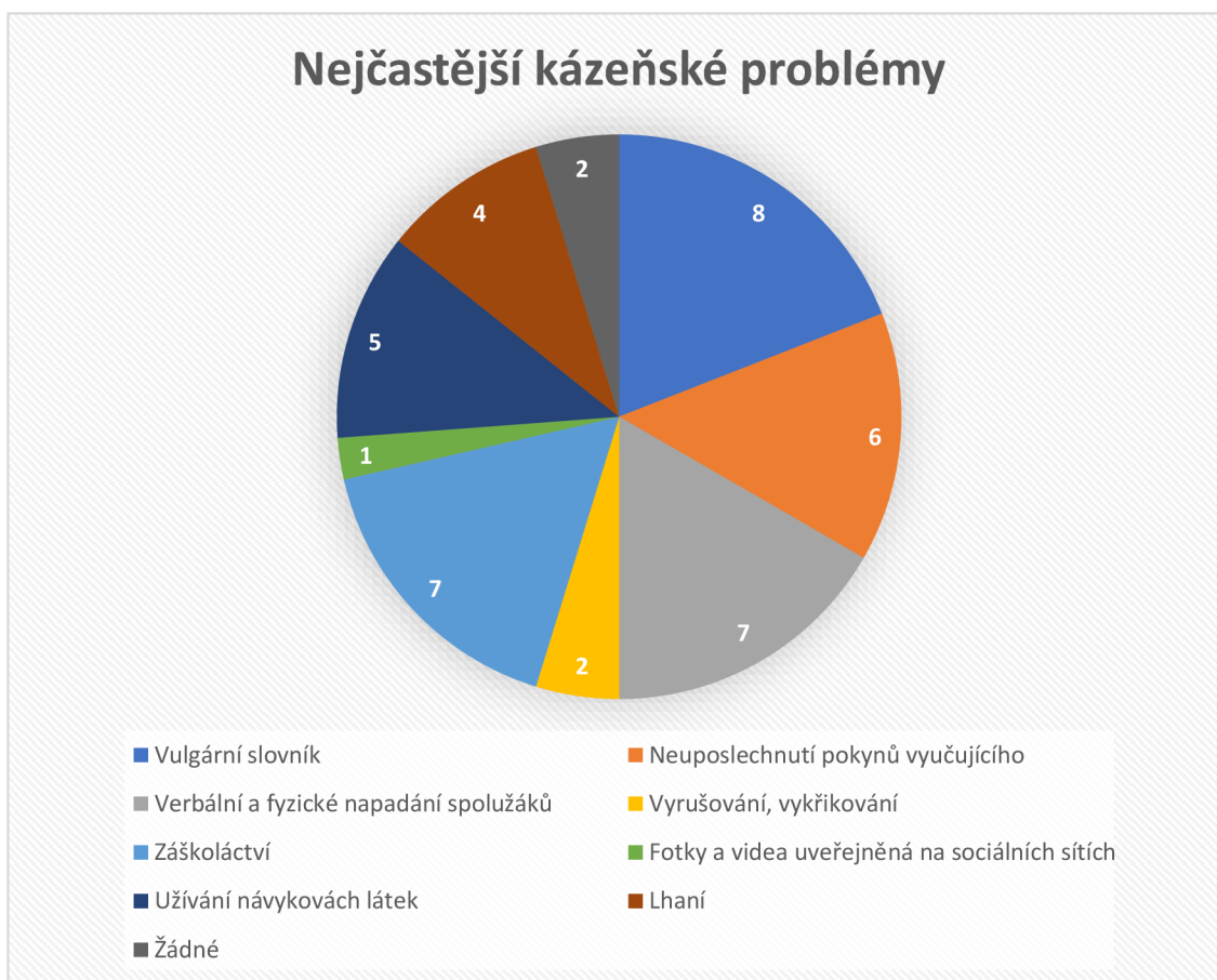
Graf 3: Nejčastější kázeňské problémy.

Na tuto otázku nám pedagogové povětšinou odpovídali stejně jako na otázku číslo 4, pro větší názornost jsme odpovědi zaznamenali do následujícího grafu.