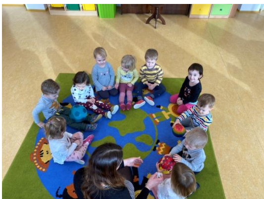
Obr. č. 3 Paleček a obr