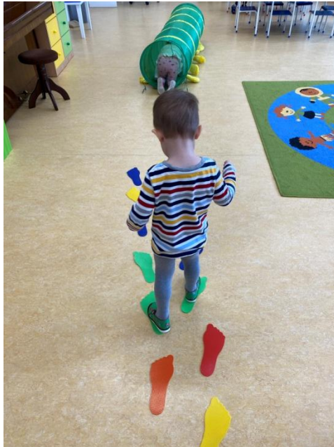
Obr. č. 1 Sbíráání brambor