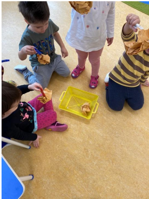
Obr. č. 6 Hrajeme si na vrabečky