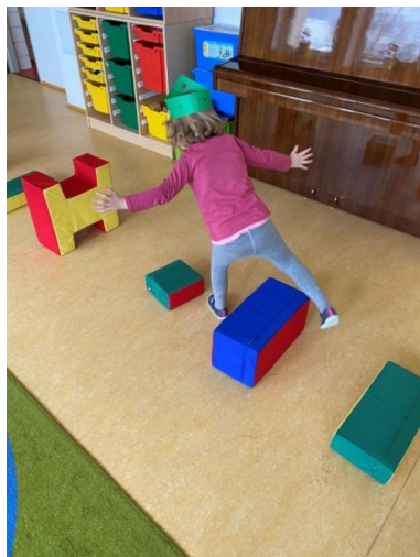
Obr. č. 4 Cesta tří králů