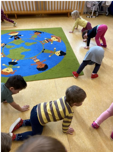
Obr. č. 2 Chodím si to do školky