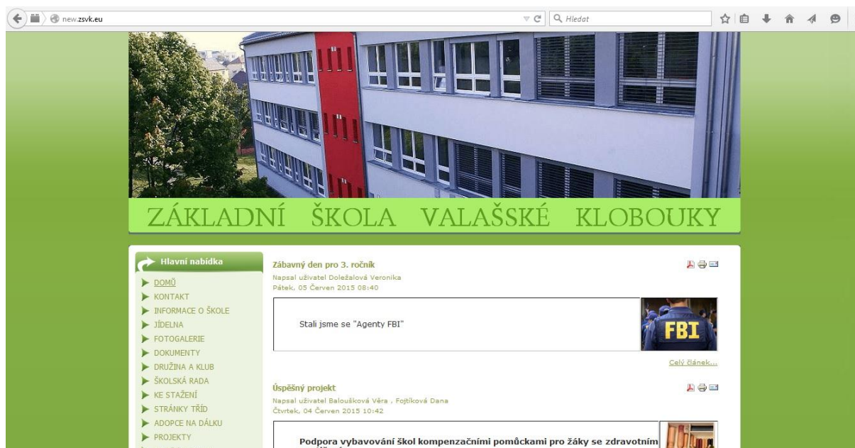
Obr. 3: Základní škola Valašské Klobouky, úvodní stránka

Webové stránky Základní školy Valašské Klobouky jsou umístěny na adrese http://new.zsvk.eu/ . Jako jediný z analyzovaných školních webů jsou tyto stránky umístěny na doméně druhého řádu.