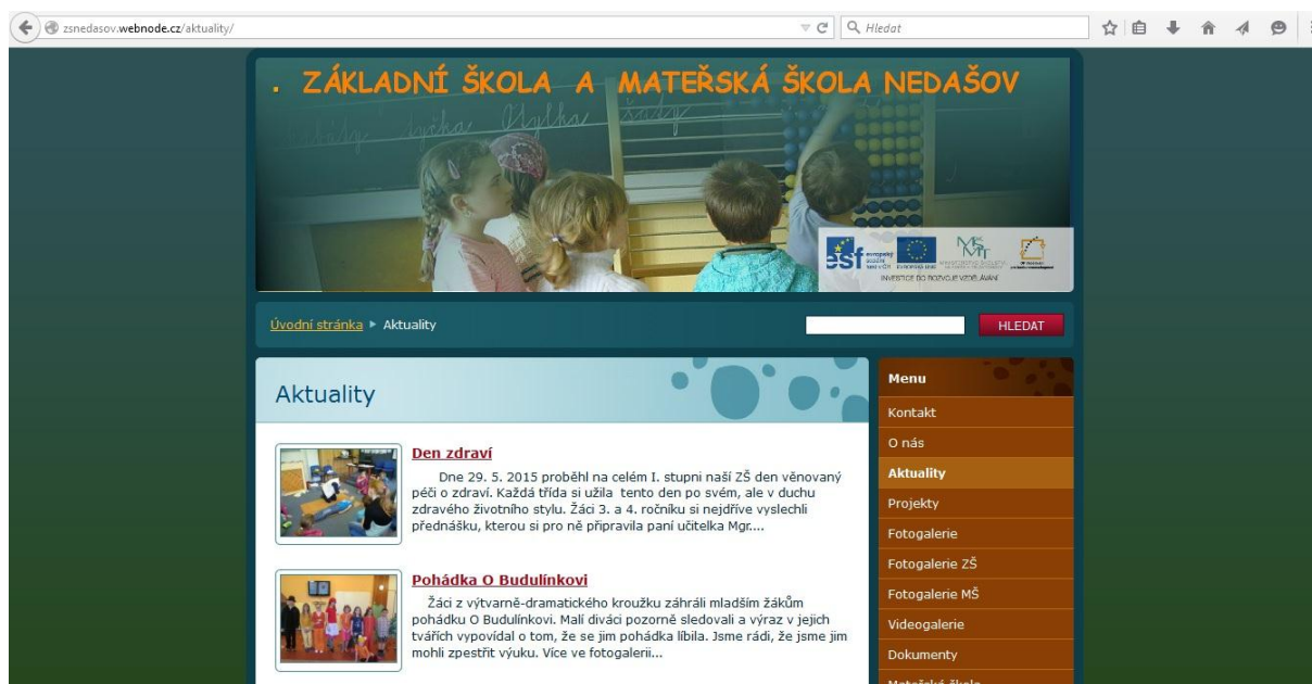
Obr. 2: Základní škola a Mateřská škola Nedašov, úvodní stránka