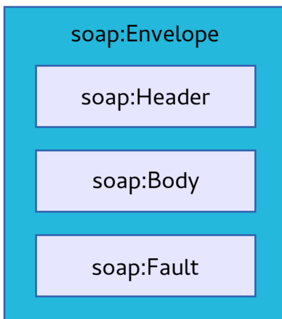
Obrázek 2.1: Hierarchie XML elementů uvnitř SOAP zprávy

Při serializaci dat je upřednostňováno používání elementů místo atributů, ty obsahují pouze metadata.