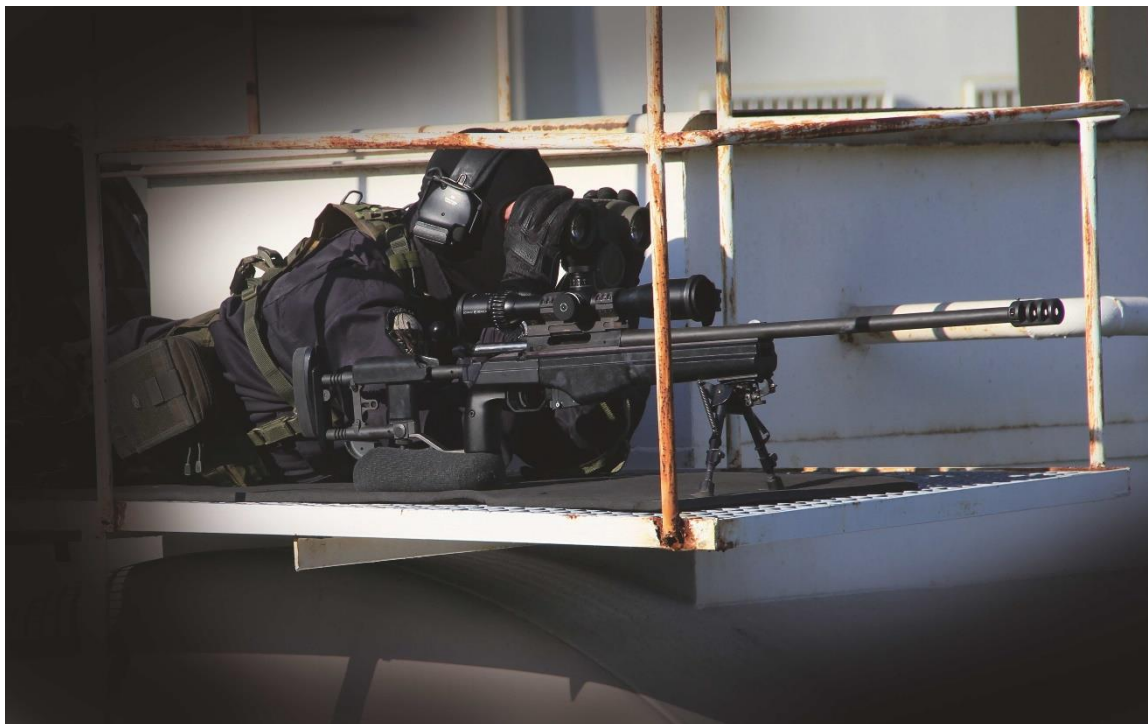
Obr. 3: Policejní odstřelovač monitorující zájmové místo před následným zákrokem. (zdroj: Kalendář ZJ 2020 - Tomáš Lehký).

číhá na střeše budovy či jiném vhodném místě společně s pomocníkem odstřelovače a jsou ve spojení se zásahovým týmem za pomoci radiostanice. 22