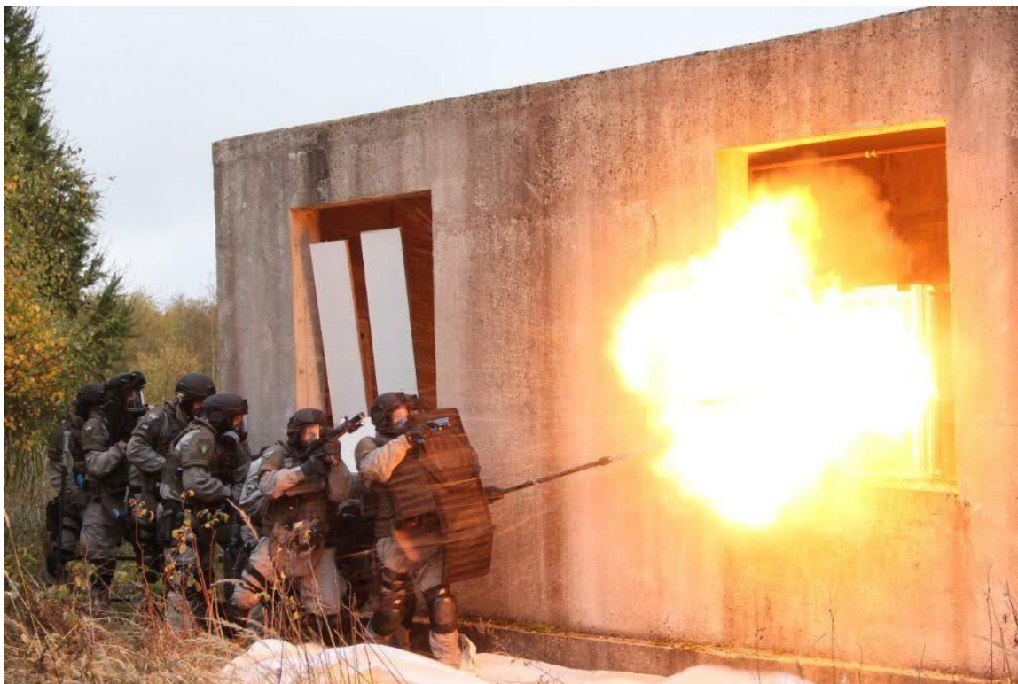
Obr. 4: Zřízení násilného vstupu oknem pomocí pyrotechniky.

Začátkem nového tisíciletí se používané postupy a metody stávají stále preciznějšími. V současné době se hojně využívají mechanické průlomové prostředky jako beranidla, různé sady páčidel, motorové rozbrusy a hydraulické rozpažovače.