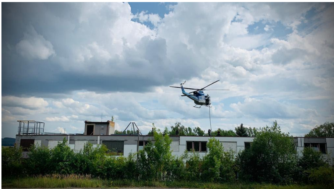
Obr. 8: Vrtulník Bell - 412 HP vysazení členů ZJ nad zájmovou pozicí za pomoci „Fastrope“ (zdroj: Archiv ZJ).

jednotky rovněž učí evakuovat osoby z obtížně dostupných míst, tonoucích, nebo zraněných osob pomocí speciálního sběrného koše nebo vaku určeného k záchraně.