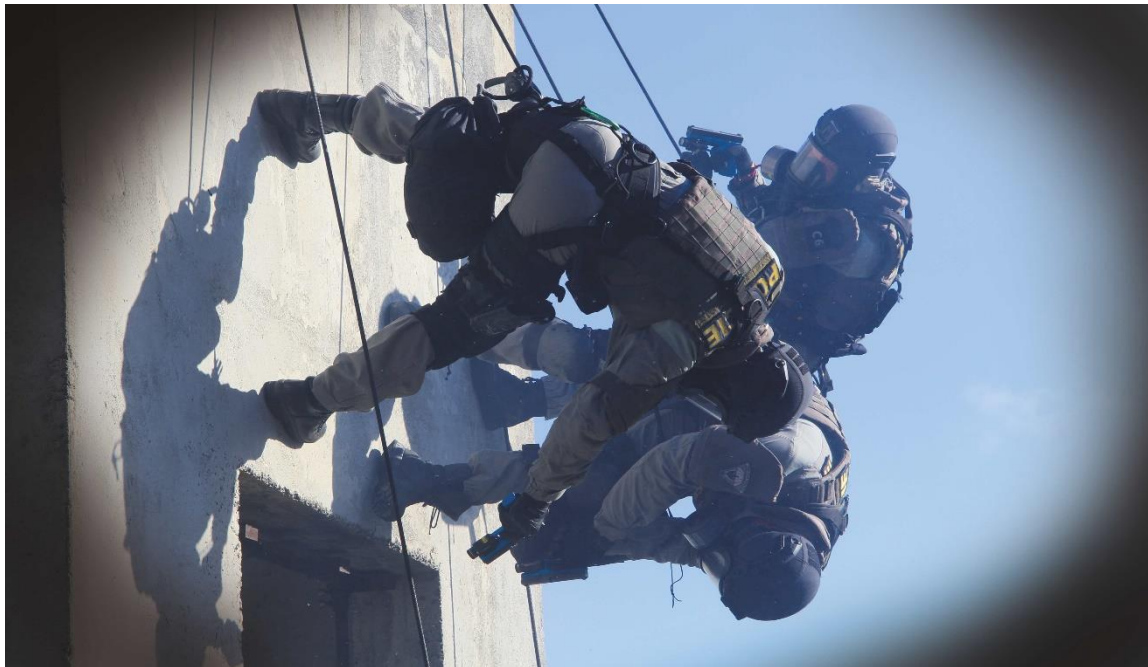
Obr. 7: Cvičné provedení násilného vstupu oknem.

Týmová spolupráce všech zúčastněných je základní předpoklad pro samotný pohyb a koordinaci na laně. Zásadní roli hraje moment překvapení. Zde se opět zúročí dílčí dovednosti jako je práce s výstrojí na laně, komunikace v týmu a aplikace správné taktiky, která má zajistit nejefektivnější provedení zákroku.