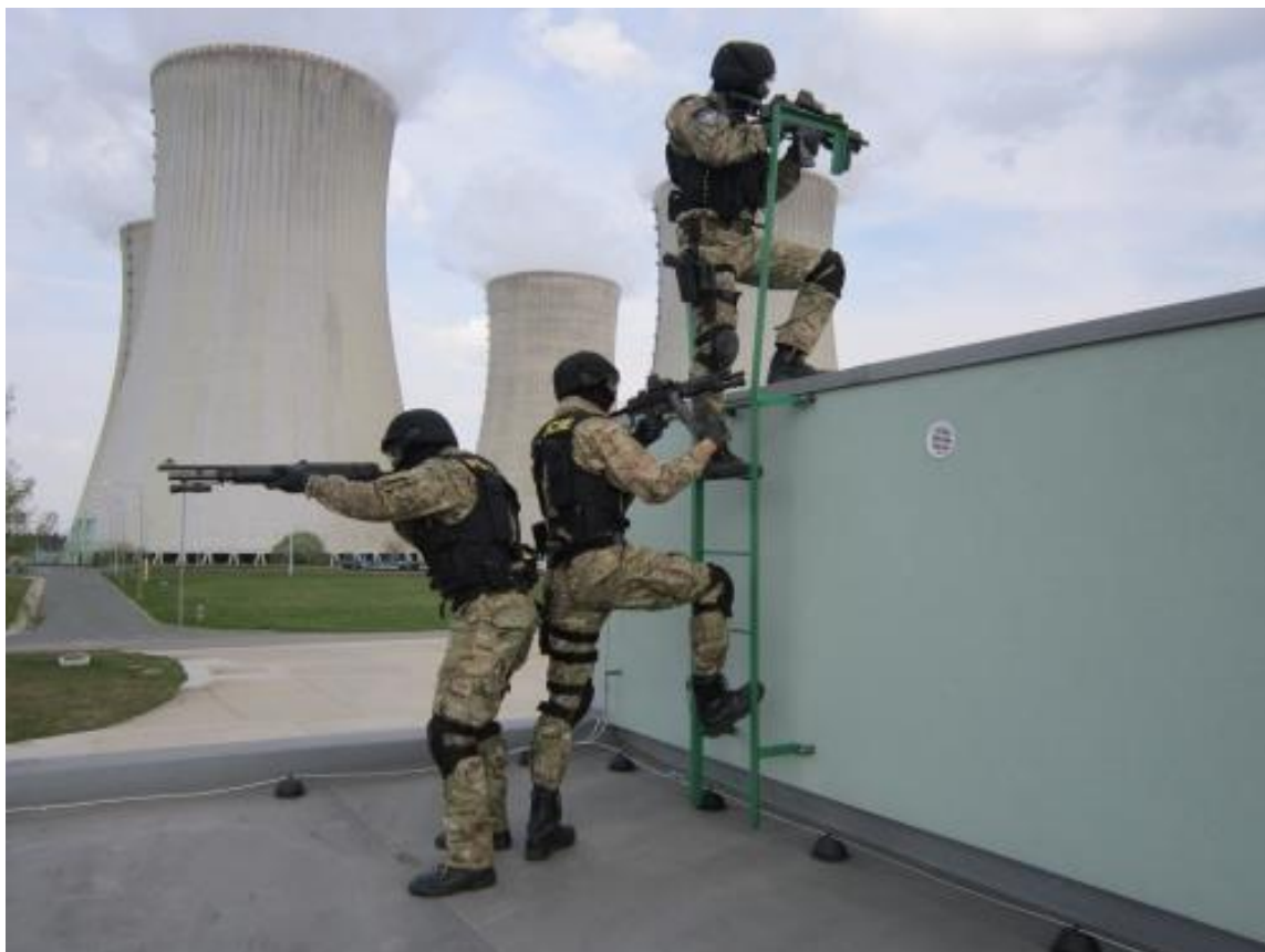
Obr. 2: Ilustrativní foto – z výcviku speciální jednotky pro ochranu JE Dukovany. (zdroj: https://www.obkjedu.cz/zaujalo-nas/policiste-z-je-dukovany-zasahovali-ve-zdaru-nad-sazavou/ ).

dalším činnostem patří, ozbrojený doprovod při přepravě jaderného materiálu. Pokud rozhodne ředitel KŘP Jihočeského kraje, potažmo Jihomoravského kraje, mohou být tyto jednotky nasazeny i mimo prostor jaderné elektrárny, a to na území kraje i mimo něj. Při pořizování výstroje speciálních jednotek pro ostrahu jaderných elektráren je velmi důležitá podpora ze strany skupiny ČEZ, prostřednictvím nadace, která se podílí na modernizaci výstroje a vybavení. 14