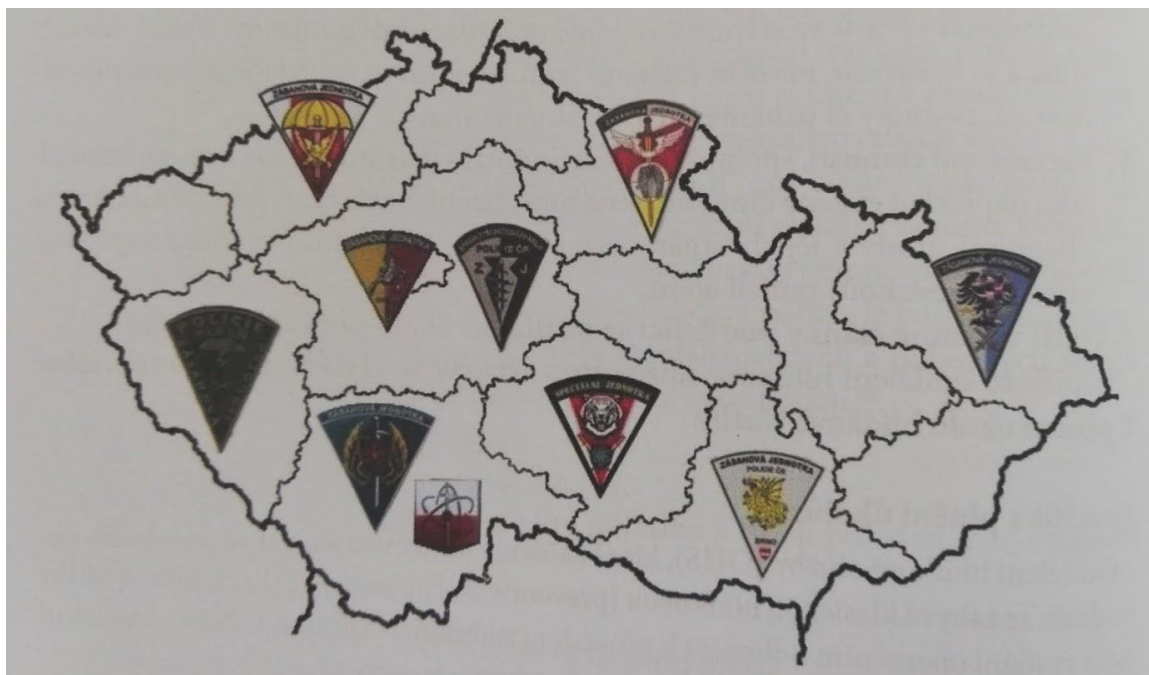
Obr. 1: Označení sídel zásahových a speciálních jednotek.

Zásahové jednotky zkráceně „ZJ“ jsou útvary Policie České republiky, které působí v rámci krajského ředitelství. Vyžaduje-li to zájem služby, může zásahová jednotka působit i na území jiného krajského ředitelství, než je zřízena. Územní obvod krajského ředitelství policie je totožný s územním obvodem vyššího územního samosprávného celku. Ne každý kraj ale má „svoji“ zásahovou jednotku. 2