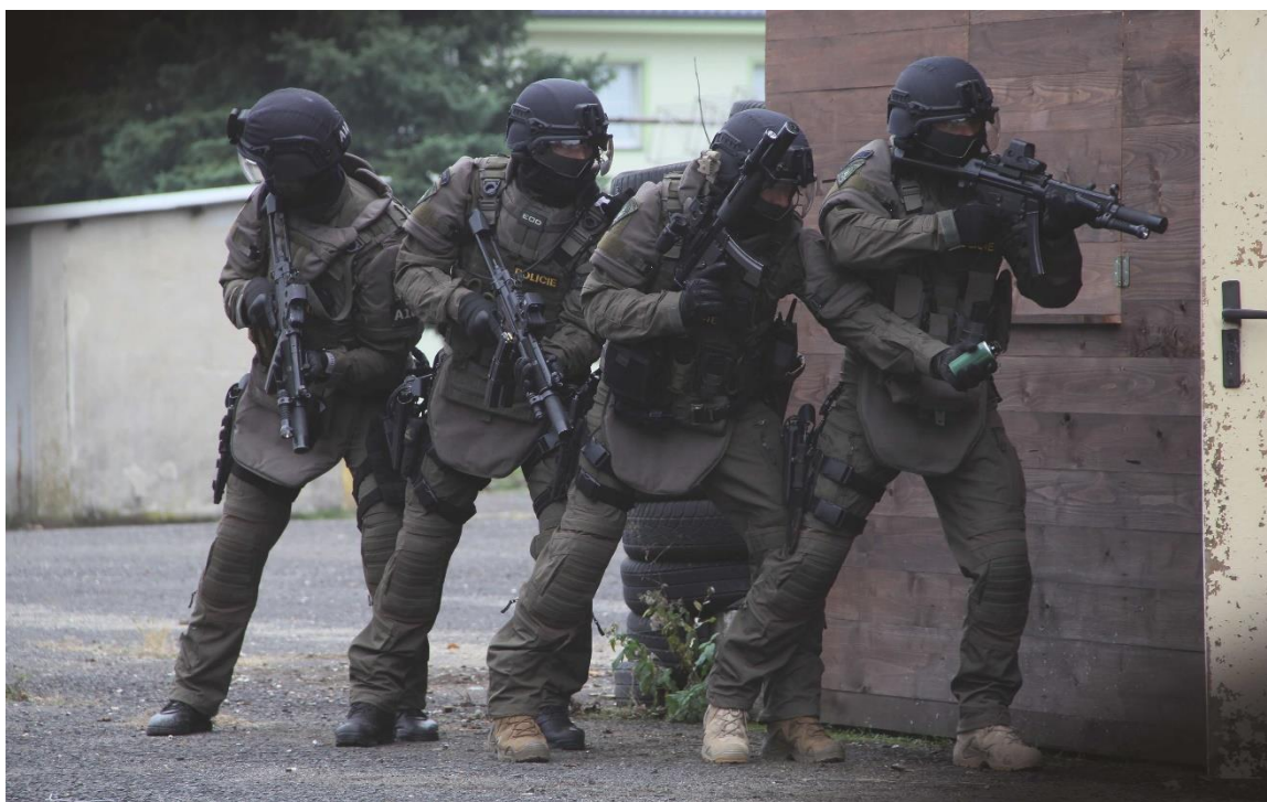
Obr. 6: Zásahová skupina připravena ke vstupu do zájmového objektu.

Vše má svá logická pravidla a ta je třeba nejen strojově plnit, ale i pochopit. Praktický výcvik ve výcvikových prostorách začíná jednoduššími úkony jako je například vstup do místnosti ve dvojici. Následně je přidán třetí člen, pak celá skupina.