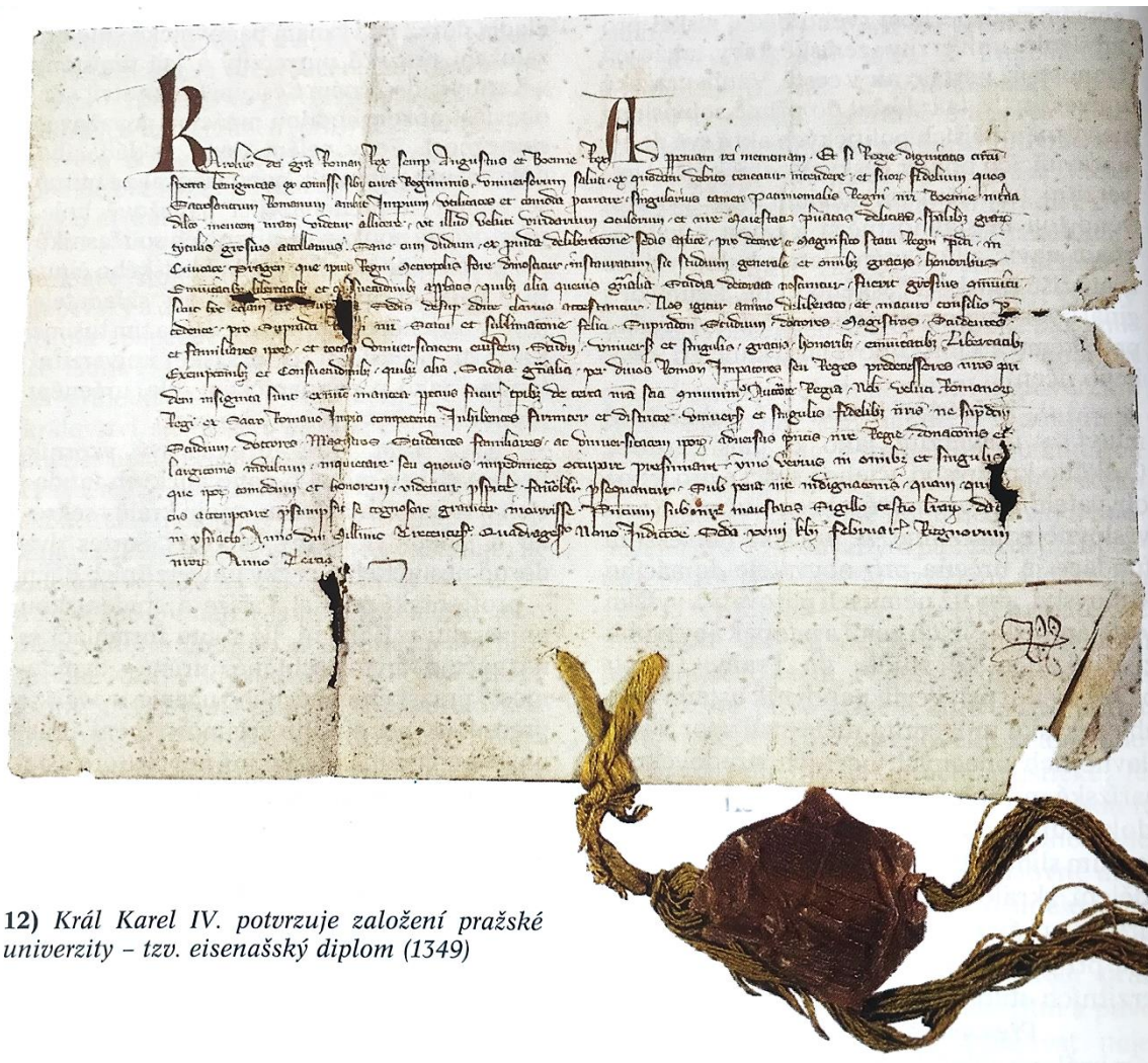
12) Král Karel IV. potvrzuje založení pražské univerzity – tzv. eisenachský diplom (1349)

Král Karel IV. potvrzuje založení pražské univerzity – tzv. eisenachský diplom (1349) 250