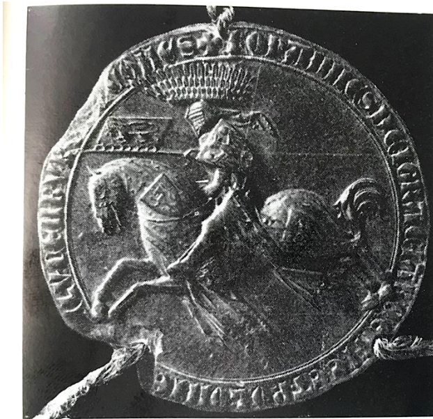
Jezdecká pečeť Jana Lucemburského, rub majestátní pečeti na listině z 10. srpna 1312 248