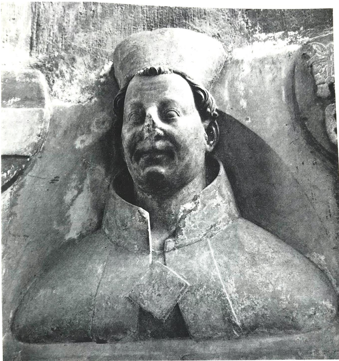
Svatovícké triforium, Arnošt z Pardubic, první arcibiskup pražský 251