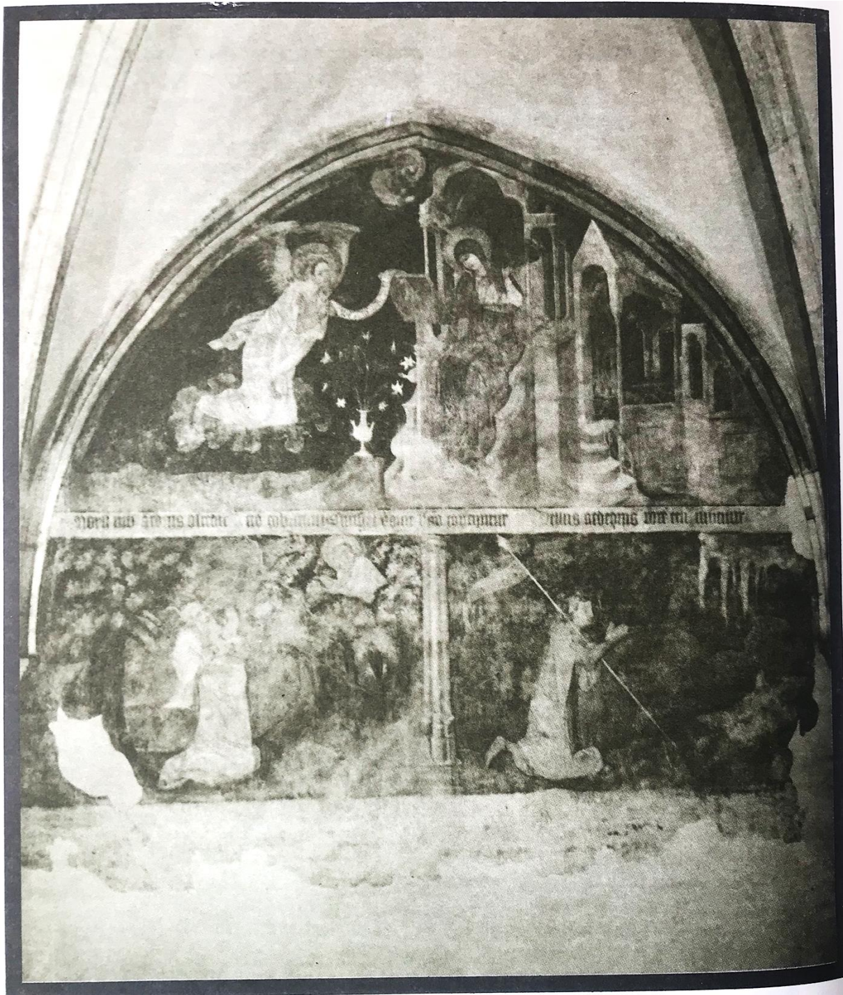
Praha, klášter v Emauzích, gotická nástěnná malba v ambitu, jižní chodba [Zvěstování, Mojžíš před hořícím keřem, Gedeon před beránčím rouchem], kolem r. 1360 253