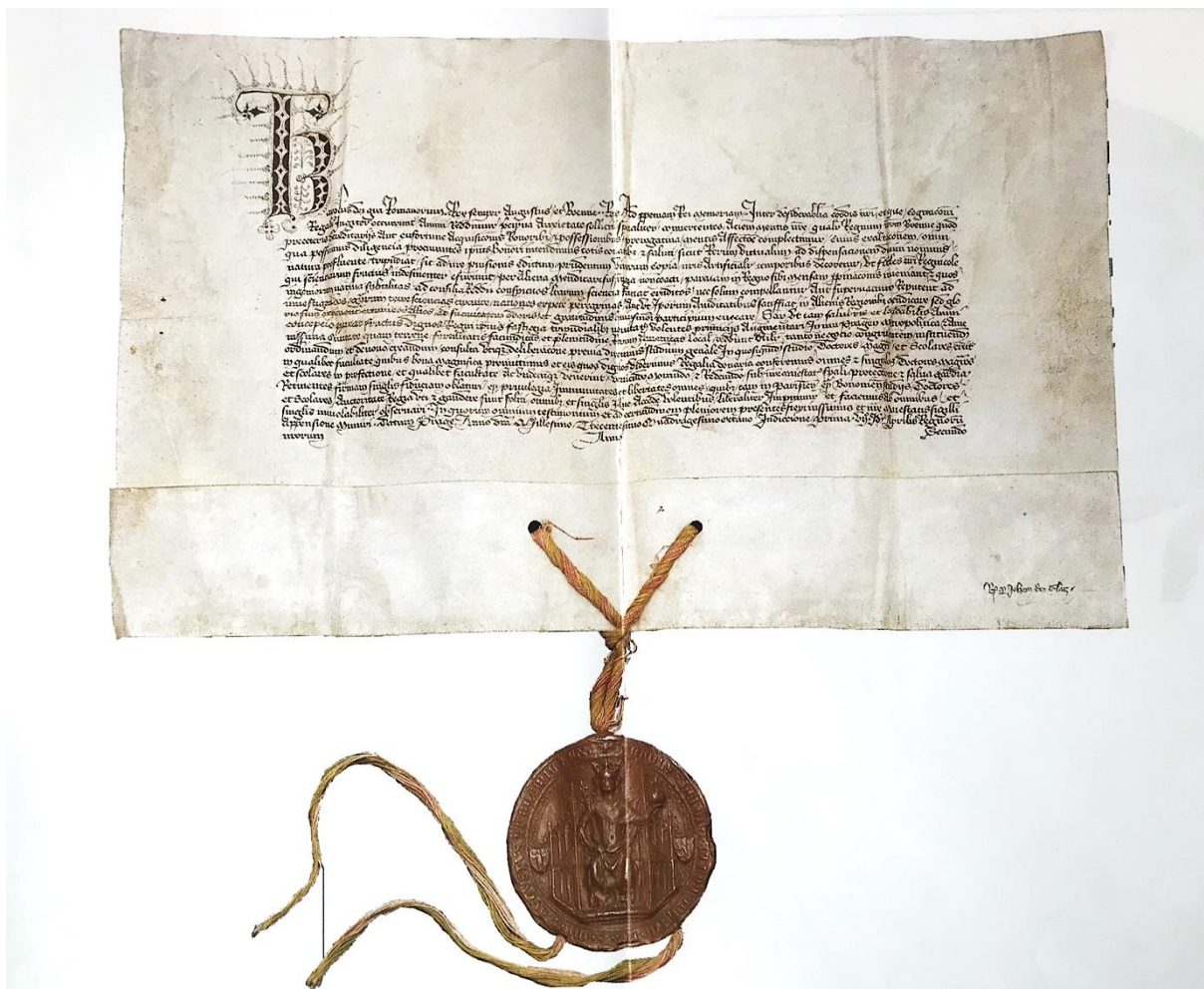
Český a římský král Karel IV. zakládá univerzitu v Praze (1348) 249