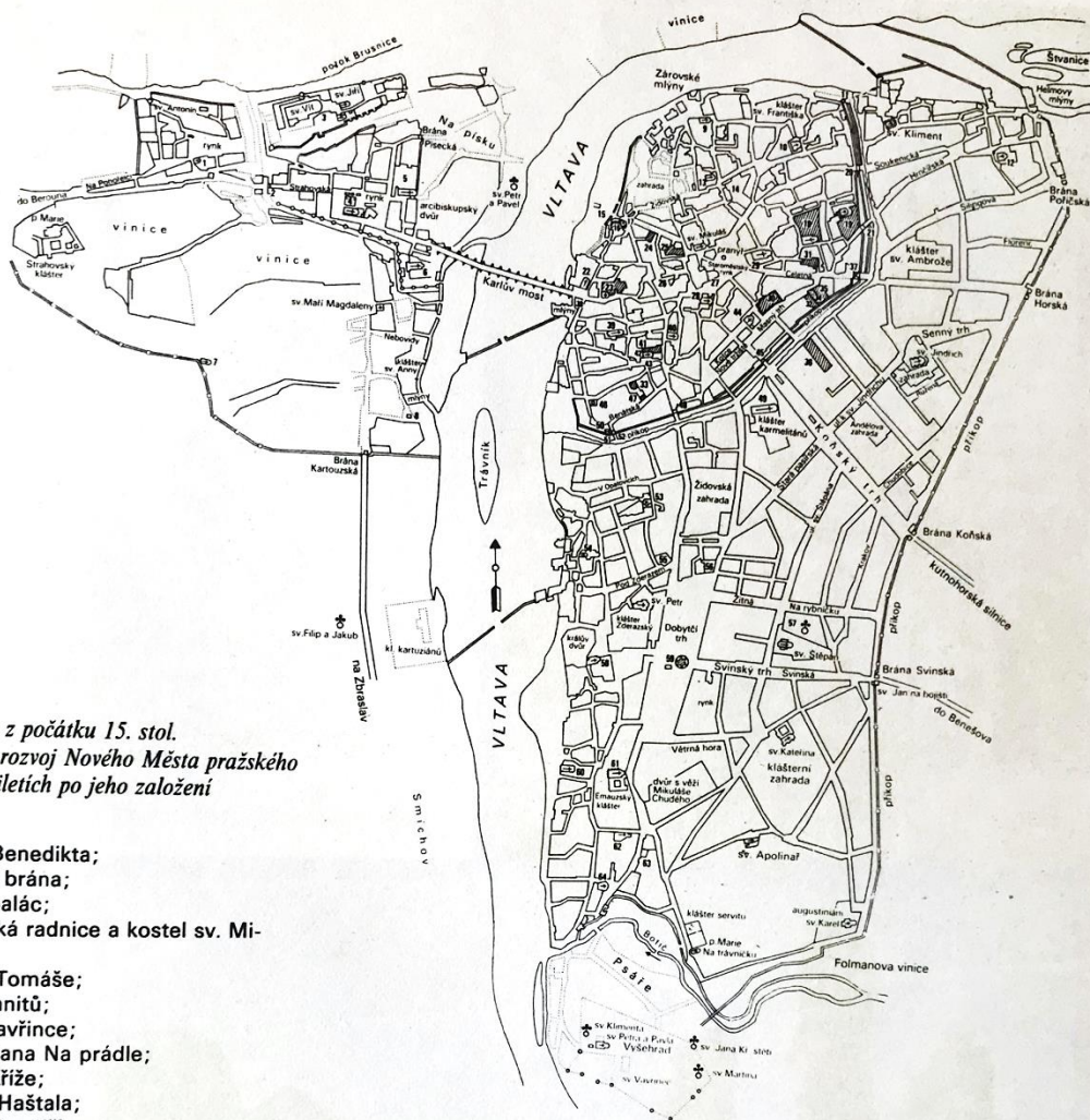
83] Plán Prahy z počátku 15. stol. ukazuje rychlý rozvoj Nového Města pražského v prvních desetiletích po jeho založení