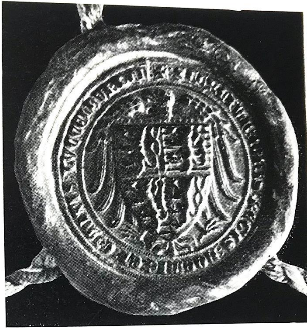
Sekretní pečeť Jana Lucemburského na listině z 3. listopadu 1322 247