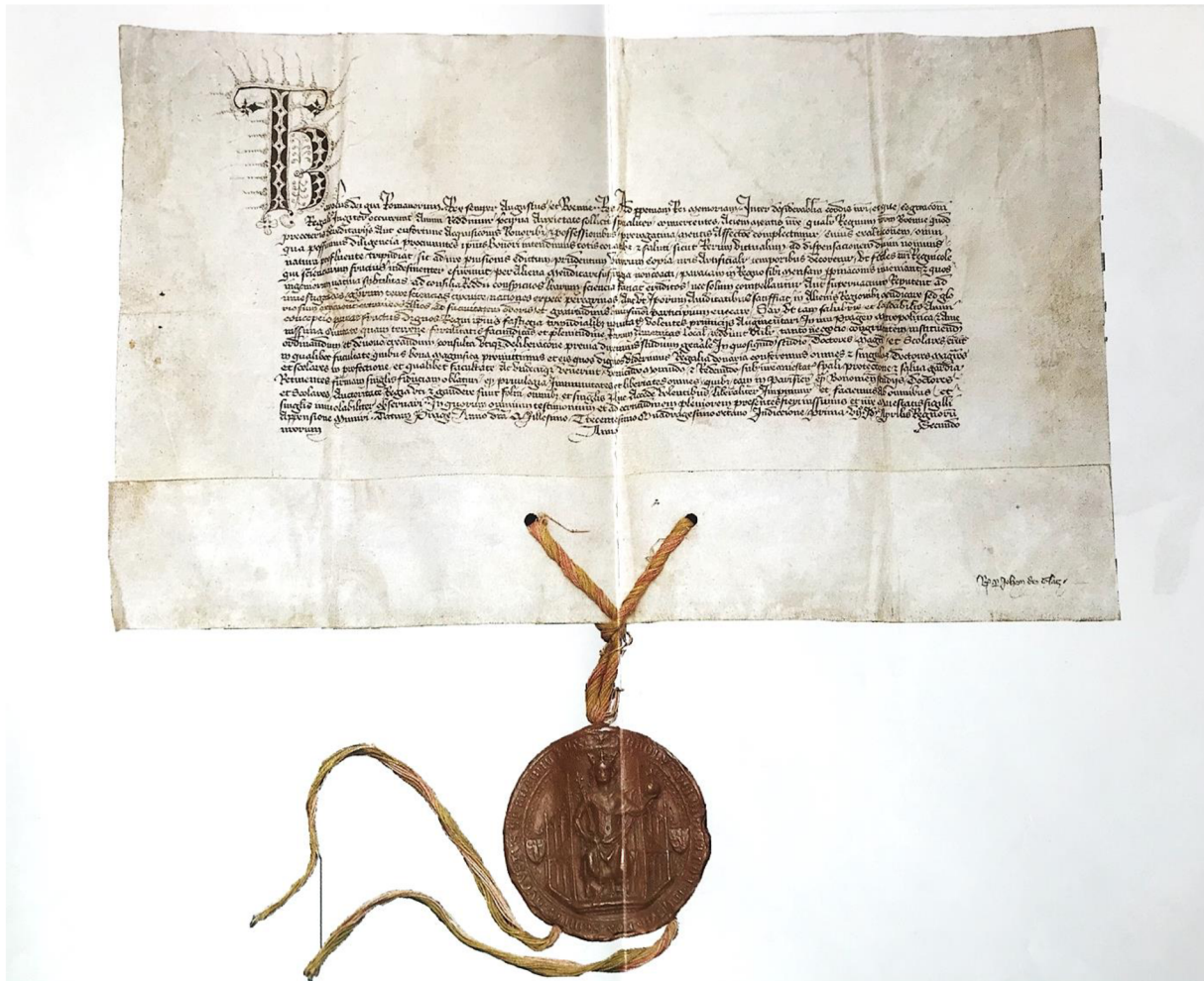
Český a římský král Karel IV. zakládá univerzitu v Praze (1348) 249