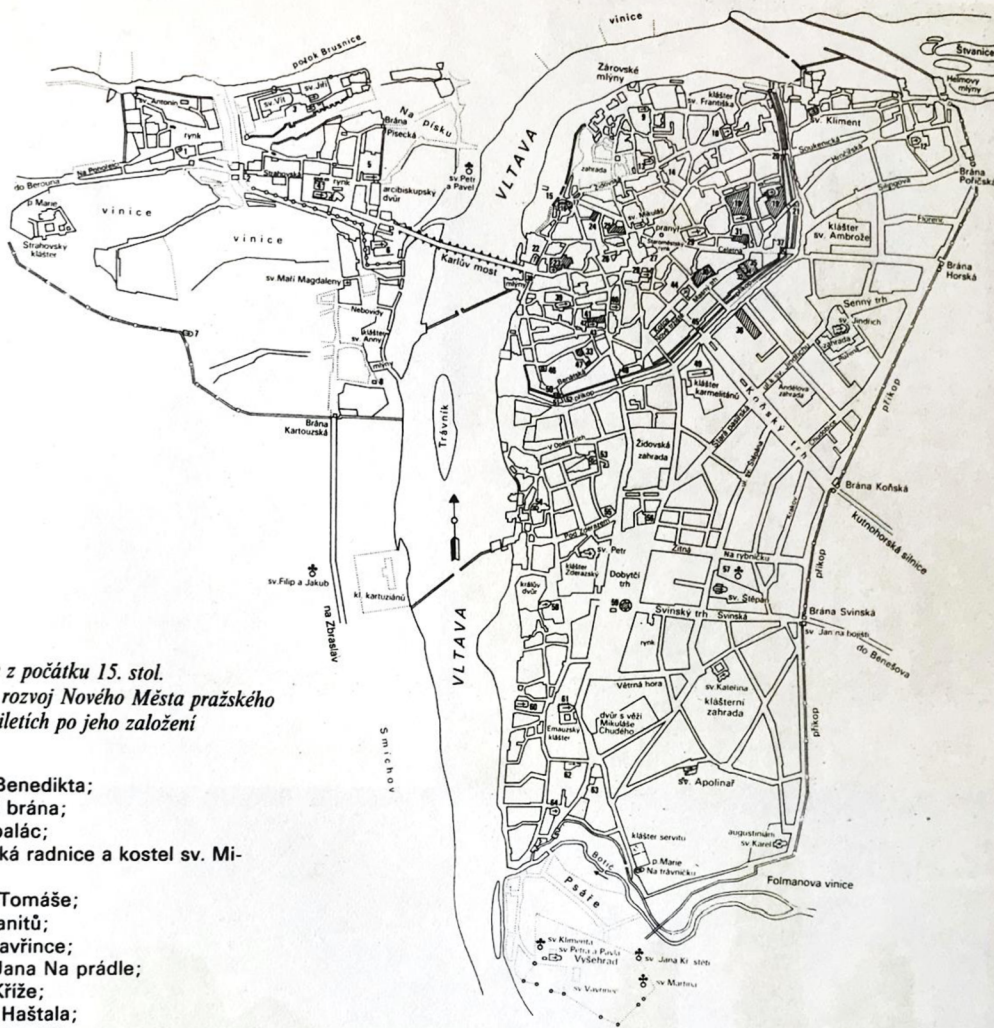
83] Plán Prahy z počátku 15. stol. ukazuje rychlý rozvoj Nového Města pražského v prvních desetiletích po jeho založení