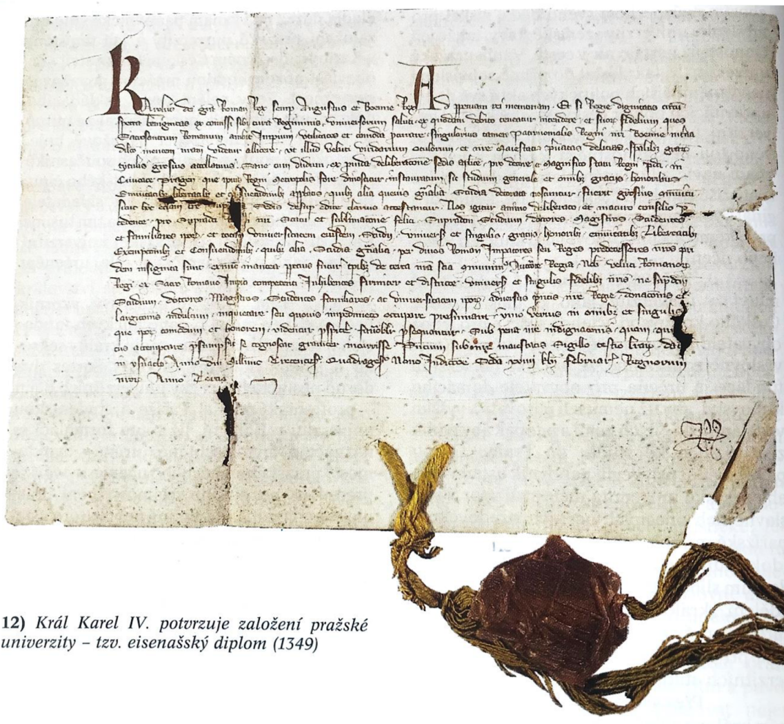
12) Král Karel IV. potvrzuje založení pražské univerzity – tzv. eisenašský diplom (1349)

Král Karel IV. potvrzuje založení pražské univerzity – tzv. eisenašský diplom (1349) 250