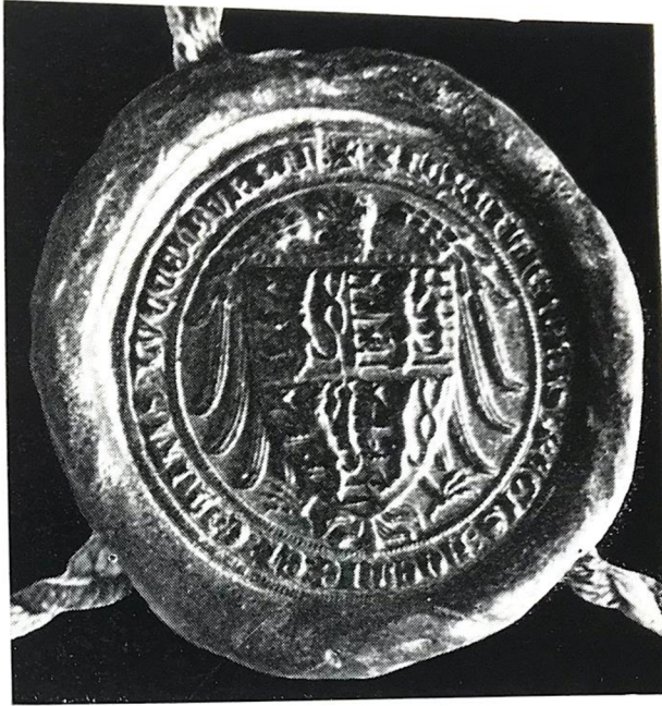
Sekretní pečeť Jana Lucemburského na listině z 3. listopadu 1322 247