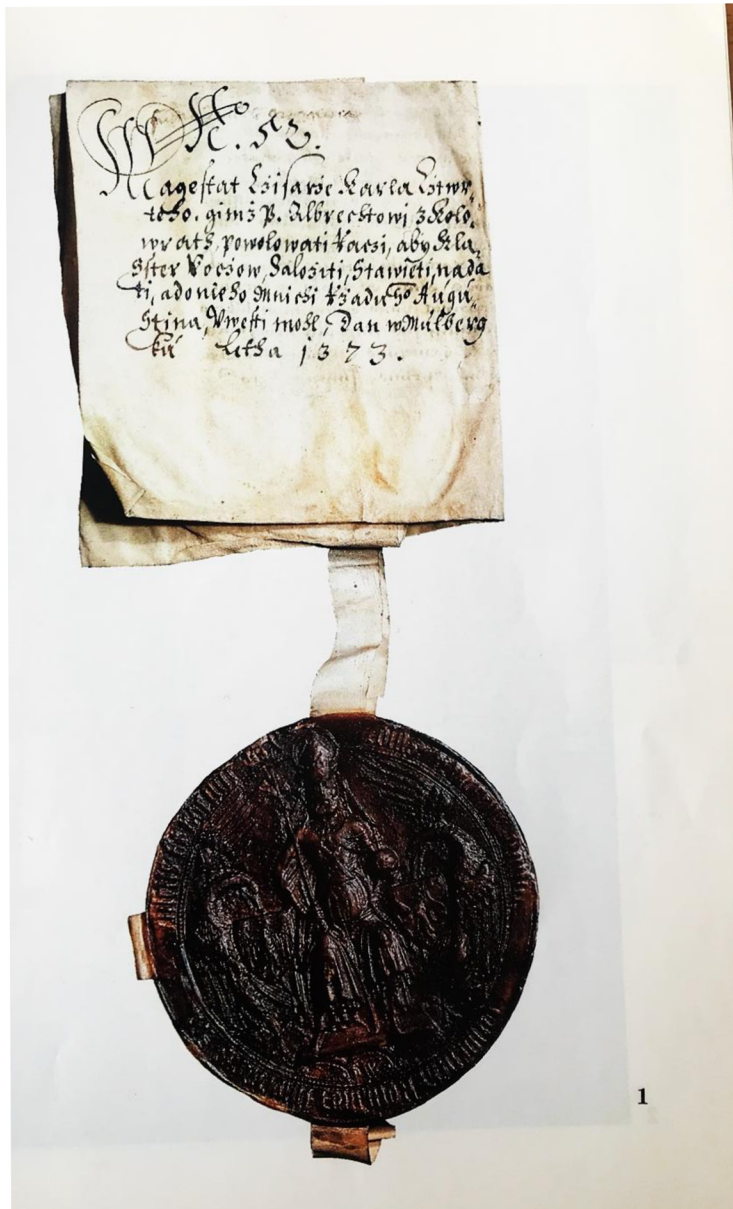
Majestátní pečeť Karla IV. jako římského císaře a českého krále (u listiny z 2. ledna 1373, AČK č. 1087 246 )