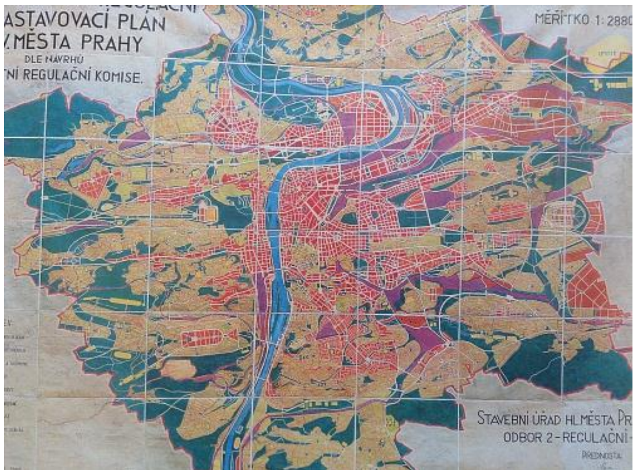
Obr. č. 2: Schématický regulační a zastavovací plán Prahy z roku 1929 (online), dostupné z http://www.dotyk.cz/publicistika/po-stoleti-uzemniho-planovani-je-praha-bez-vize-20161006.html >

Urbanistická teorie dlouho vycházela z renesančních představ, pozvolna se však vyvíjely i moderní projekty města lineárního, města zahradního a později i města satelitního. Mimořádně významné byly na sklonku 19. stol. koncepce O. Wagnera, chápající velkoměsto jako kvalitativně nový prvek, který se nedá pojímat pouze jako několikanásobné zvětšení tradičního města.