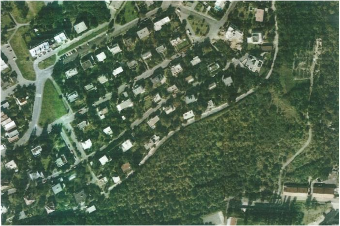
Obr. č. 3.: Letecký pohled na osadu Baba v Praze 6 (online), dostupné z http://www.prahaneznamy.cz/praha-6/dejvice/baba

Světová hospodářská krize od roku 1929 zcela přerušila naplňování vizí předních architektů na hluboké proměny Prahy. „ Slibně se rozvíjející mladou Republiku zasáhla, stejně jako ostatní země, v roce 1929 hospodářská krize, což způsobilo, že profese architekta nebyla už tak žádoucí a „tento stává se sociologem, filosofem-organizátorem a nejčastěji nezaměstnaným“ , jak napsal roku 1934 časopis Architekt SIA. „ I tato doba však našla sílu, aby realizovala námi dnes obdivovaná díla. Jako příklady uveďme třeba projekt výstavní osady Baba v Dejvicích realizované od roku 1929 Svazem československého díla, tvořenou mnoha zajímavými funkcionalistickými rodinnými domy, za připomenutí stojí i Müllerova vila od Adolfa Loose a Karla Lhoty a mnoho dalších. “