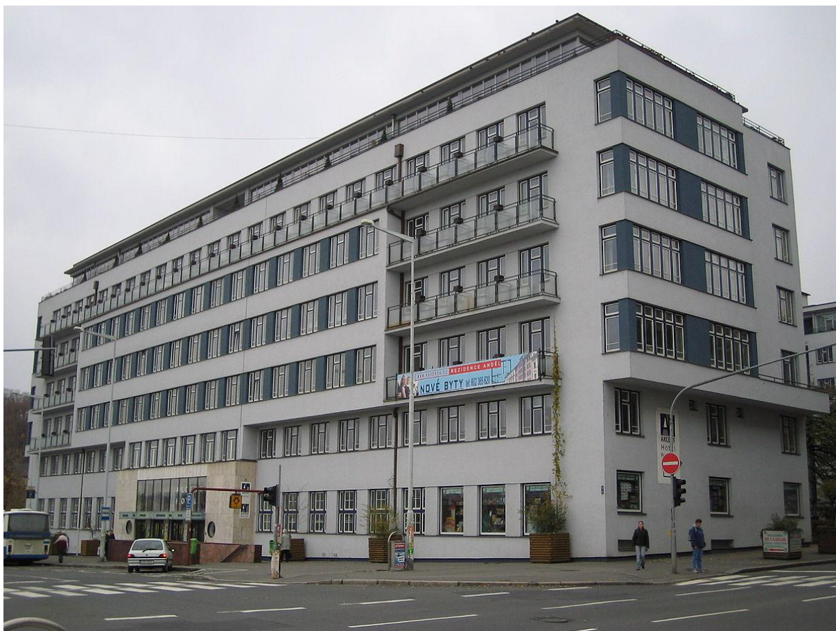
Obr. č. 6.: Ženské domovy – postavené ve 30. letech 20. století jako ubytovací zařízení pro svobodné pracující ženy (online), dostupné z https://cs.wikipedia.org/wiki/%C5%BDensk%C3%A9_domovy

Těžiště výstavby Smíchova se přesunulo do okolních kopců, kde rychle vyrůstaly vilové a družstevní čtvrti v bohaté zeleni.