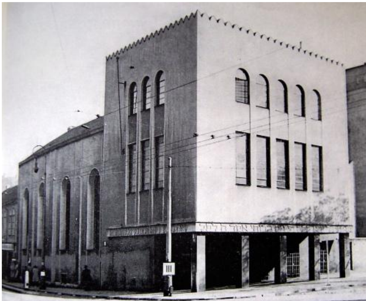
Obr. č. 7.: V roce 1931 byla synagoga přestavěna ve funkcionalistickém slohu, autorem přestavby byl architekt Leopold Ehrmann (online), dostupné z < http://smichov.blog.cz/0807/smichovska-synagoga >

podstatné rozšíření ubytovacích kapacit, což mohla umožnit pouze rozsáhlá výstavba činžovní domů. Myšlenka zahradní zástavby se tak uskutečnila jen v několika lokalitách - Mrázovka, Malvazinky, Barrandov a další.