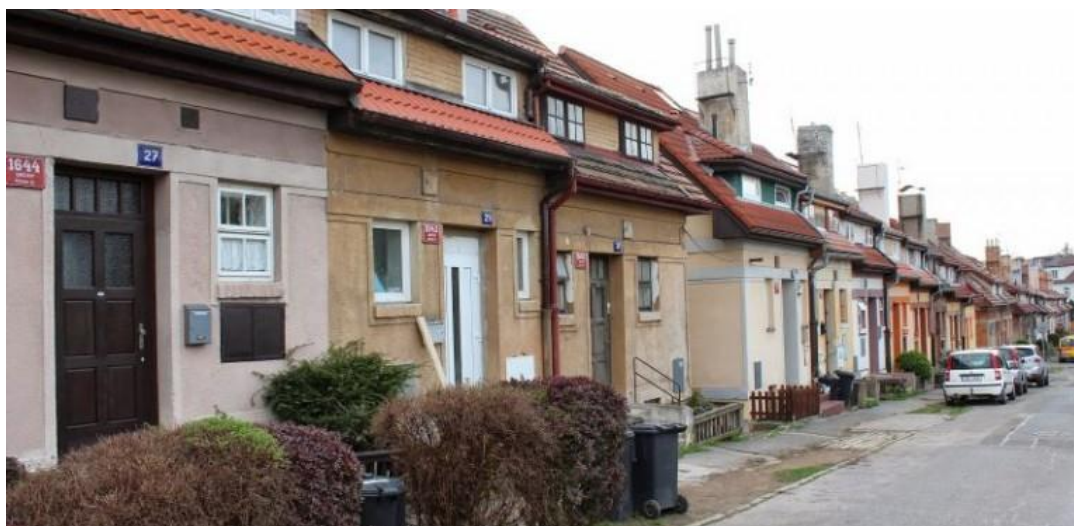
Obr. č. 8: Jedna z nejstarších kolonií na Praze 5 – Kolonie Malvazinky (online), dostupné z < http://www.prahaneznamy.cz/praha-5/smichov/kolonie-malvazinky >

Výstavba velkých rodinných domů v zahradních městech pokračovala, zastínilo ji však budování státních, městských, ale nově i družstevních činžovních domů či menších rodinných domků a vilových kolonií.