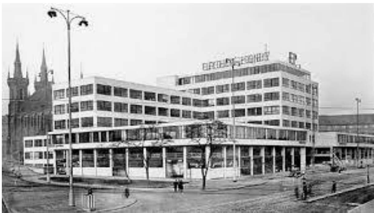
Obr. č. 5.: Elektrické podniky hlavního města Prahy 1933, tato stavba se stala milníkem

Vedení Podniků se tedy rozhodlo pro nový velkolepý palác. Architekti Josef Kříž a Adolf Benš tak přinesli do města ryzí funkcionalismus, který tou dobou dominoval spíše na předměstí, a v Holešovicích se tak octly hned dvě velkolepé moderní stavby – budova Elektrických Podniků a nedaleký Veletřzní palác . Působivý je nejen vzhled, ale i samotný zásah do urbanismu města, který ignoroval stanovené uliční čáry a tradiční blokové uspořádání s vnitřním dvorem. To, že takový projekt vyhrál, je jen důkazem otevřenosti vedení Elektrických Podniků, ale i Státní regulační komise, která v tomto případě povolila stavbě výjimku. Opuštění od blokové zástavby mimo jiné prosadili zastánci Le Corbusierových principů a přisoudili tak podobným stavbám progresivní zahraniční formu.