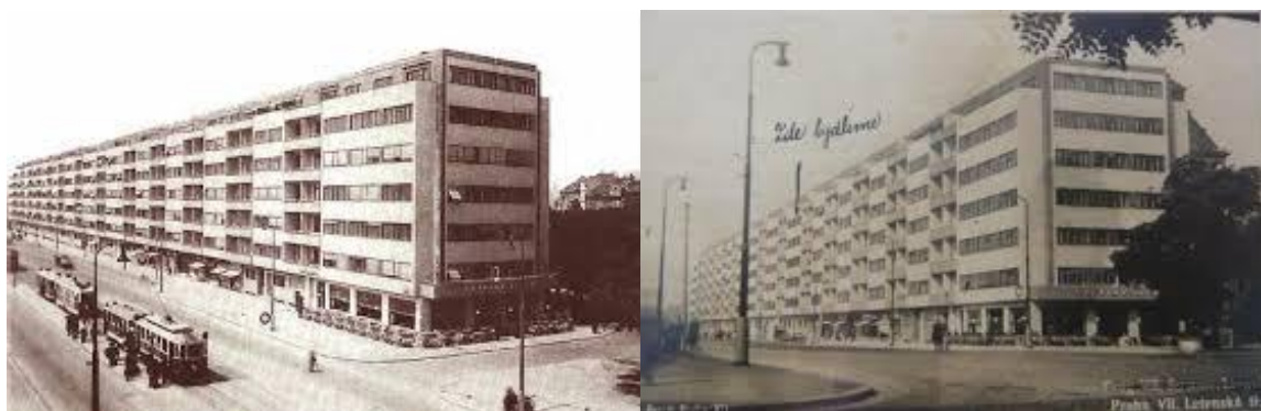
Obr. č. 4. Elektrické domy 1930, Praha na Letné Praha 7 (online), dostupné z < http://www.prahaneznamy.cz/jine-zajimavosti/elektricke-domy >

S těmito elektrickými domy se můžeme setkat zejména na katastru Prahy 7, 6 a 1, přičemž jsou typické i dnes svojí ustupující uliční čarou, čímž tehdejší architekti naznačovali možnou přeměnu dané ulice v širší bulvár. V době třicátých let se jednalo o stěžejní dílo architektů, shrnující kulturní situaci a vývoj pražské architektury.