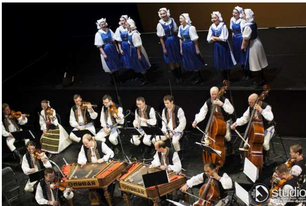
Obr. č. 5 Koncert k 60. výročí – Orchester lidových nástrojů v Mahenově divadle v Brně (Ondrášovská suita) 90