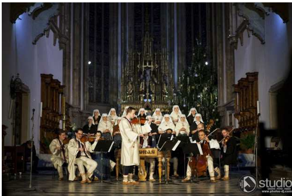
Obr. č. 7 Vánoční koncert VUS Ondráš v katedrále sv. Petra a Pavla v Brně 92