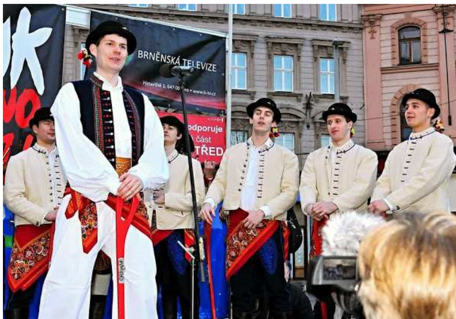
Obr. č. 6 VUS Ondráš - Fašank Brno 2014 91