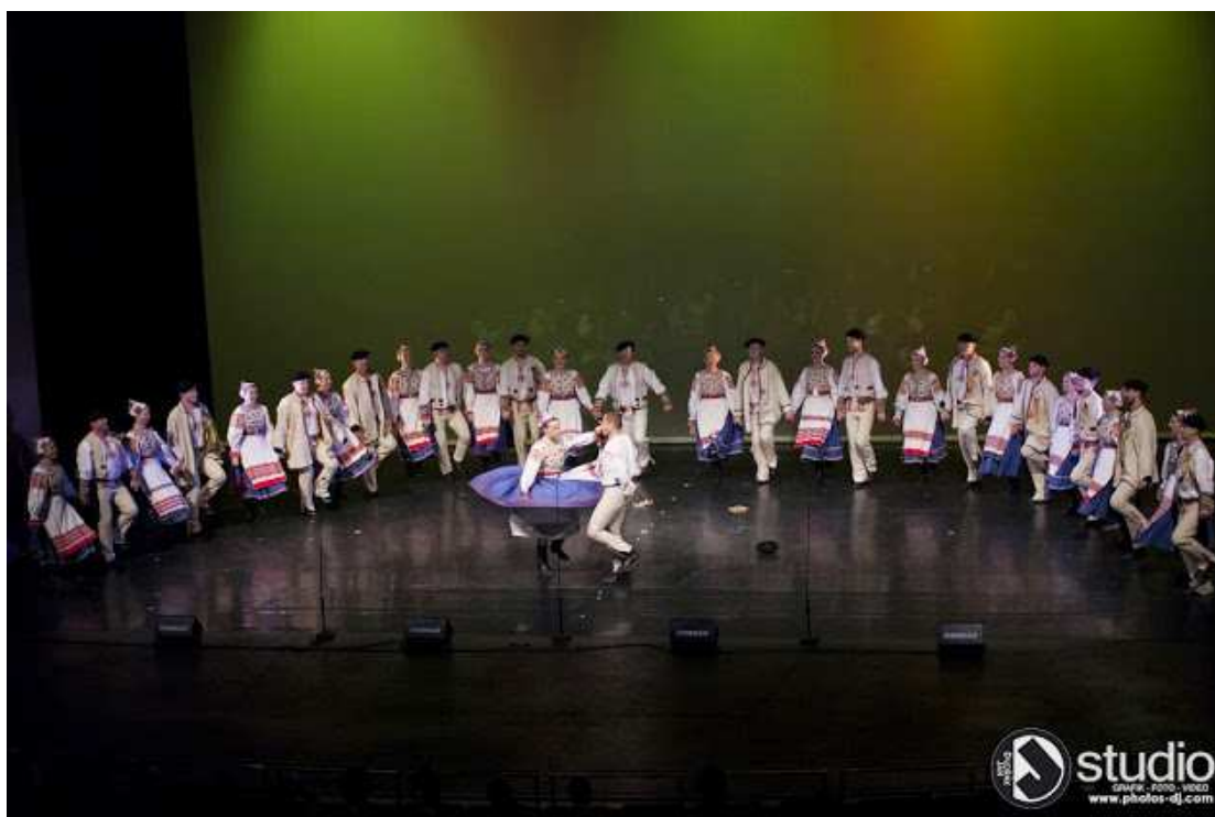
Obr. č. 4 Vystoupení k 60. výročí v Janáčkově divadle v Brně (Ondrášovské ozvěny) 89