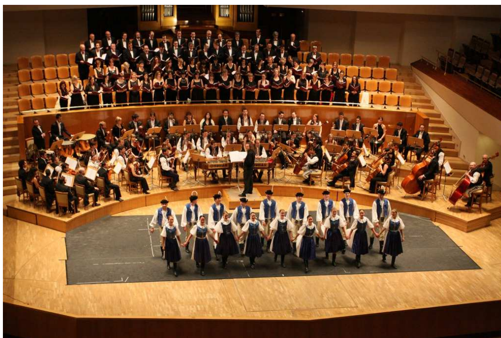
Obr. č. 8 VUS Ondráš – Španělsko 2010 93