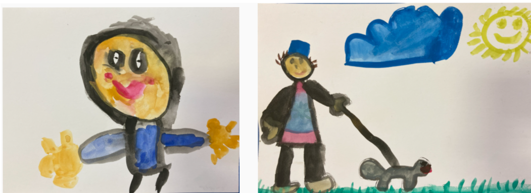
Obrázek 4 – Hrdina Kubik podle školáka č. 3 a č. 4