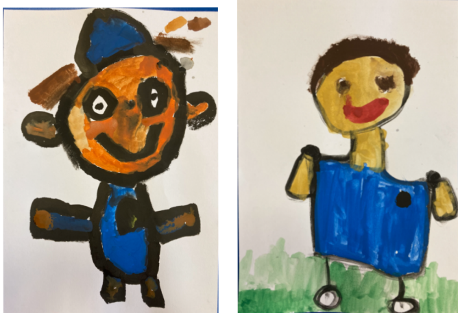
Obrázek 3 – Hrdina Kubik podle školáka č. 1 a č. 2