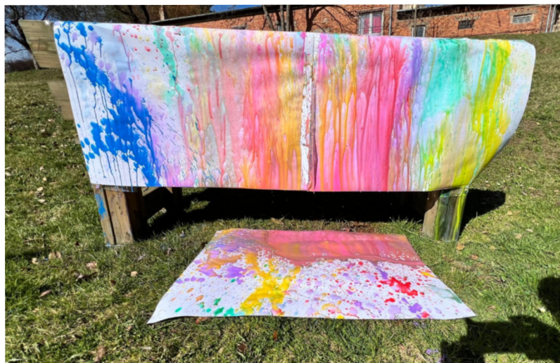
Obrázek 10 – Výsledné společné dílo z aktivity Barevné stříkance