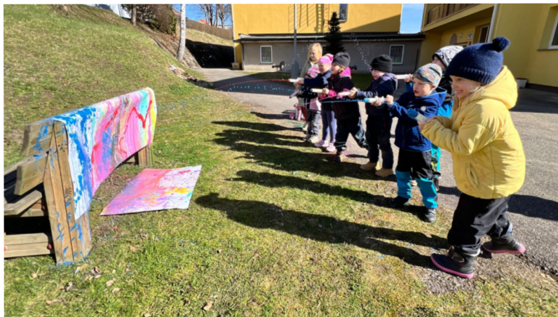
Obrázek 9 – Činnost dětí při aktivitě Barevné stříkance