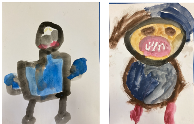
Obrázek 2 – Hrdina Kubík podle předškoláka č. 3 a č. 4