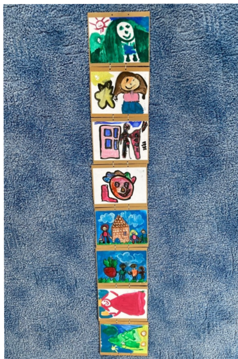
Obrázek 8 – Jednotlivé obrázky jako stránky leporela