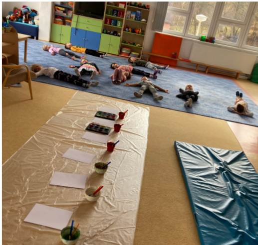
Obrázek 5 – Relaxace a imaginace dětí při druhé aktivitě