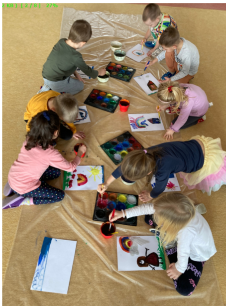
Obrázek 6 – Individuální práce dětí ve druhé aktivitě