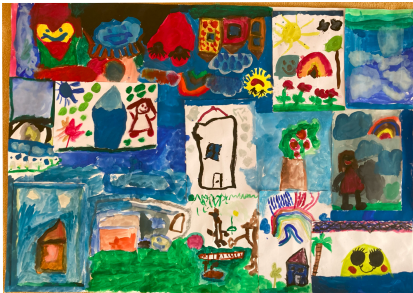
Obrázek 7 – Propojení individuálního a skupinového malování