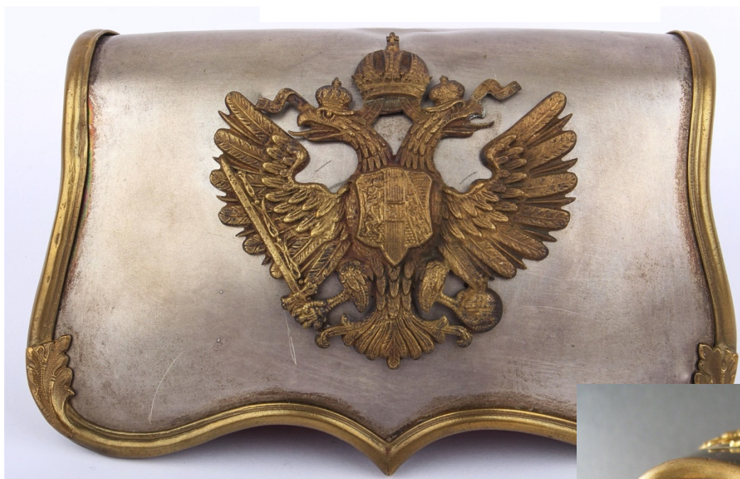
Obr. 16 Stříbrná patrontaška pro důstojníky jezdecktva, pohled na víko a postranní plastický reliéf, dobový originál