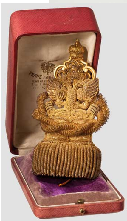
Obr. 25 Odznak c. a k. císařského komořího v podobě velkého zlatého klíče a bohatě zdobený dracounový strážec jako dekorace ke klíči