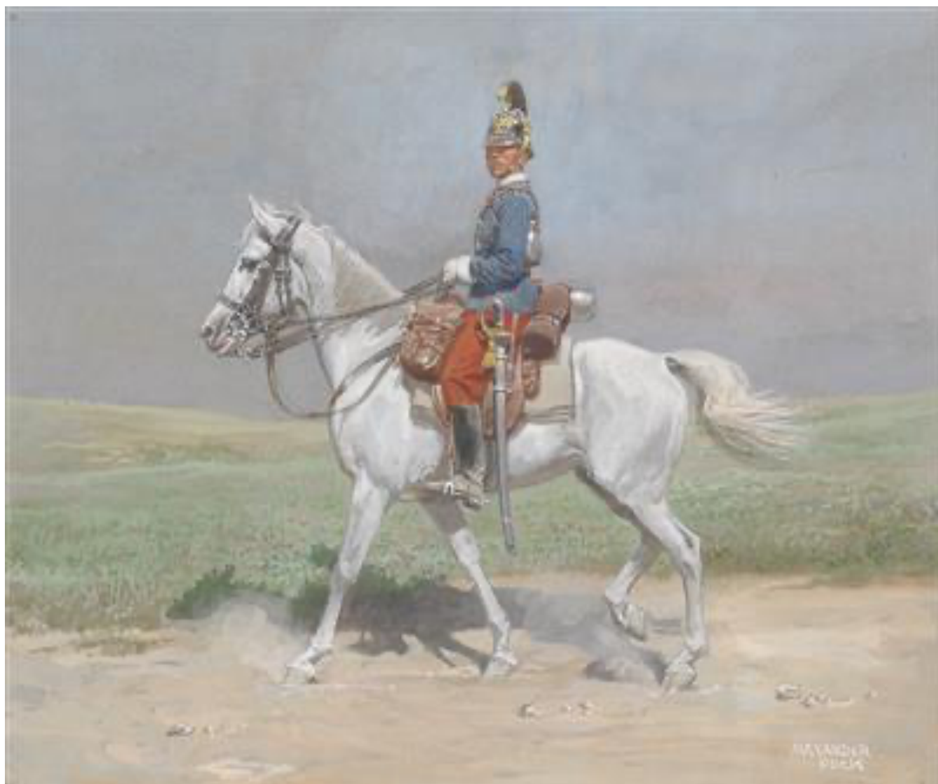
Obr. 8 Alexander Pock, Dragoun na koni , po roce 1904, soukromá sbírka