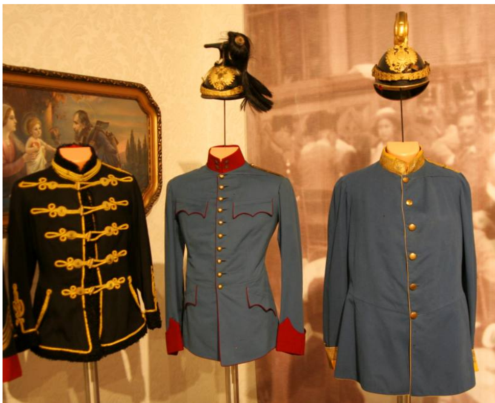
Obr. 17 Husaři, huláni a dragouni, zleva doprava: kabát poručíka husarů, sako a czapka nadporučíka hulánů a sako s přilbou majora dragounů