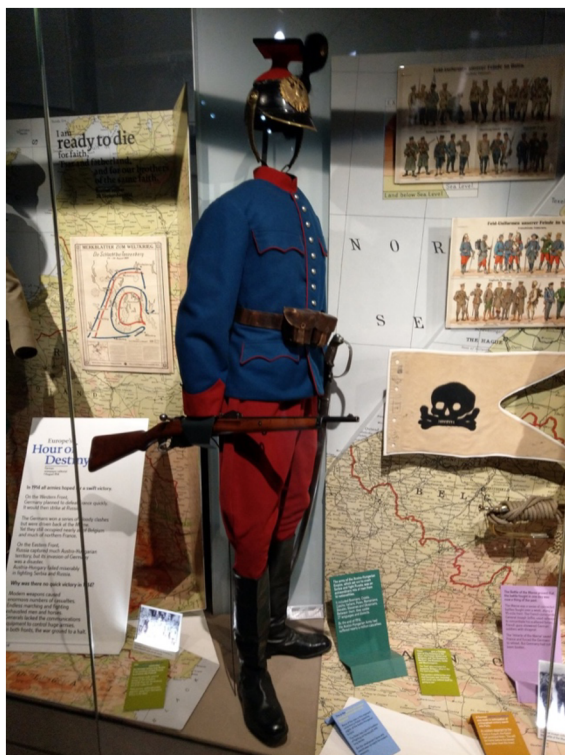
Obr. 20 Polní uniforma řadového příslušníka hulánů