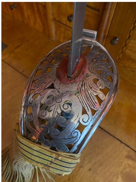
Obr. 13 Detail florální zdobené šavle M1869 pro důstojníky jezdecktva