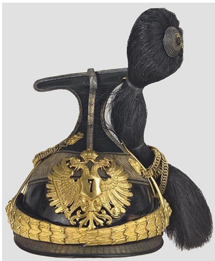
Obr. 21 Důstojnická čapka hulánského pluku č. 7