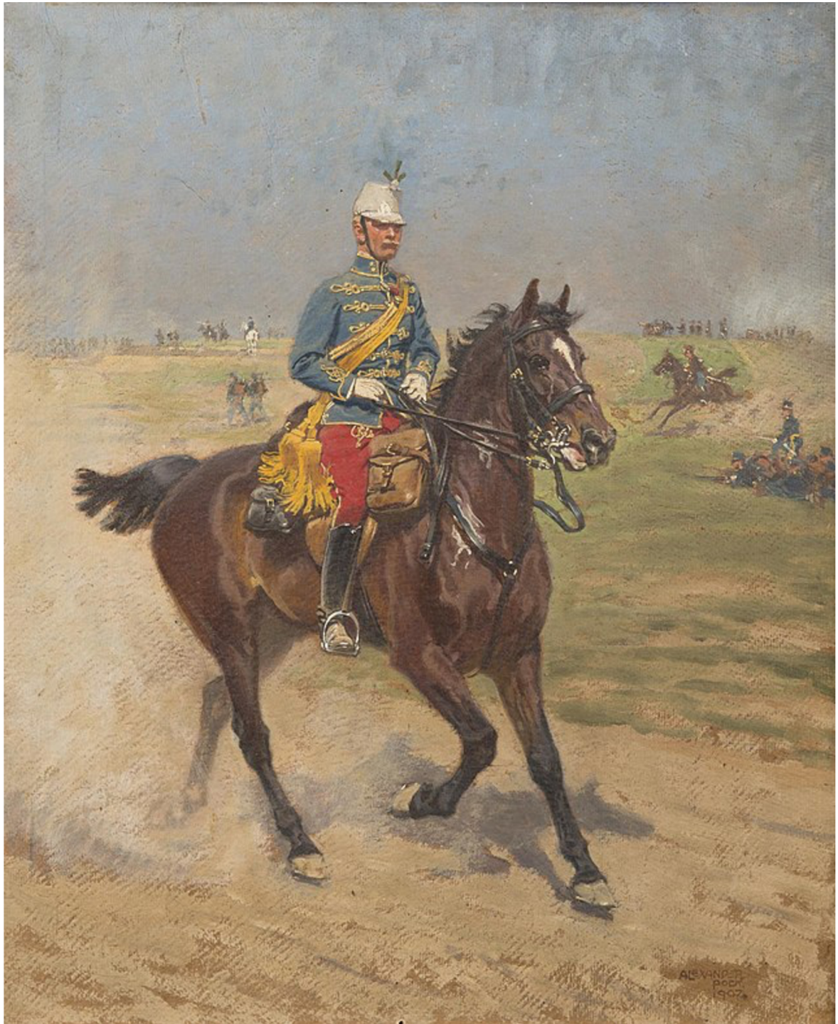
Obr. 6 Alexander Pock, Jezdec R-U kavalerie , 1907, soukromá sbírka