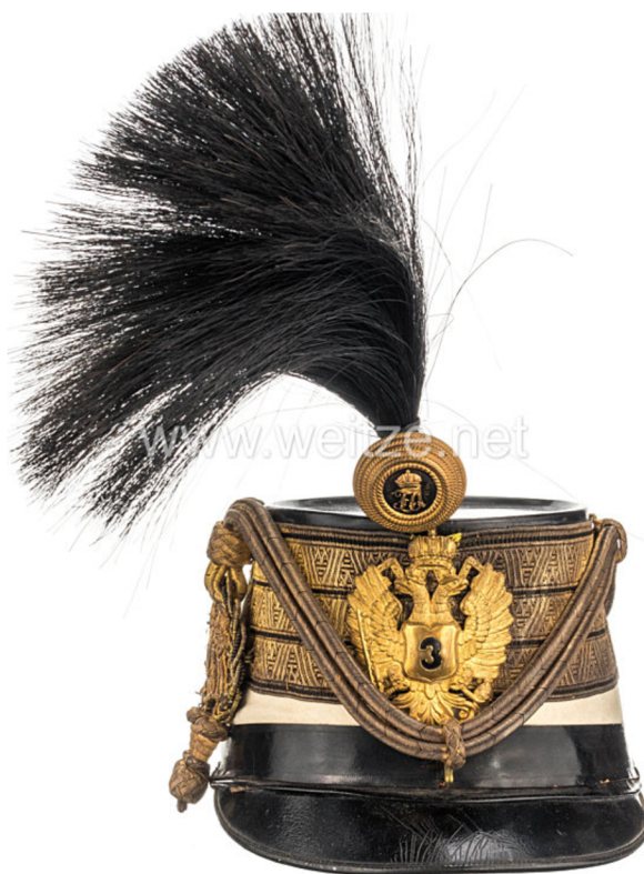
Obr. 24 Čáko důstojníka husarského pluku č. 3 s kompletní dekorací