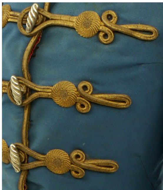
Obr. 23 Detail ozdobného šňůrování, tzv. čamar na saku důstojnické husarské uniformy