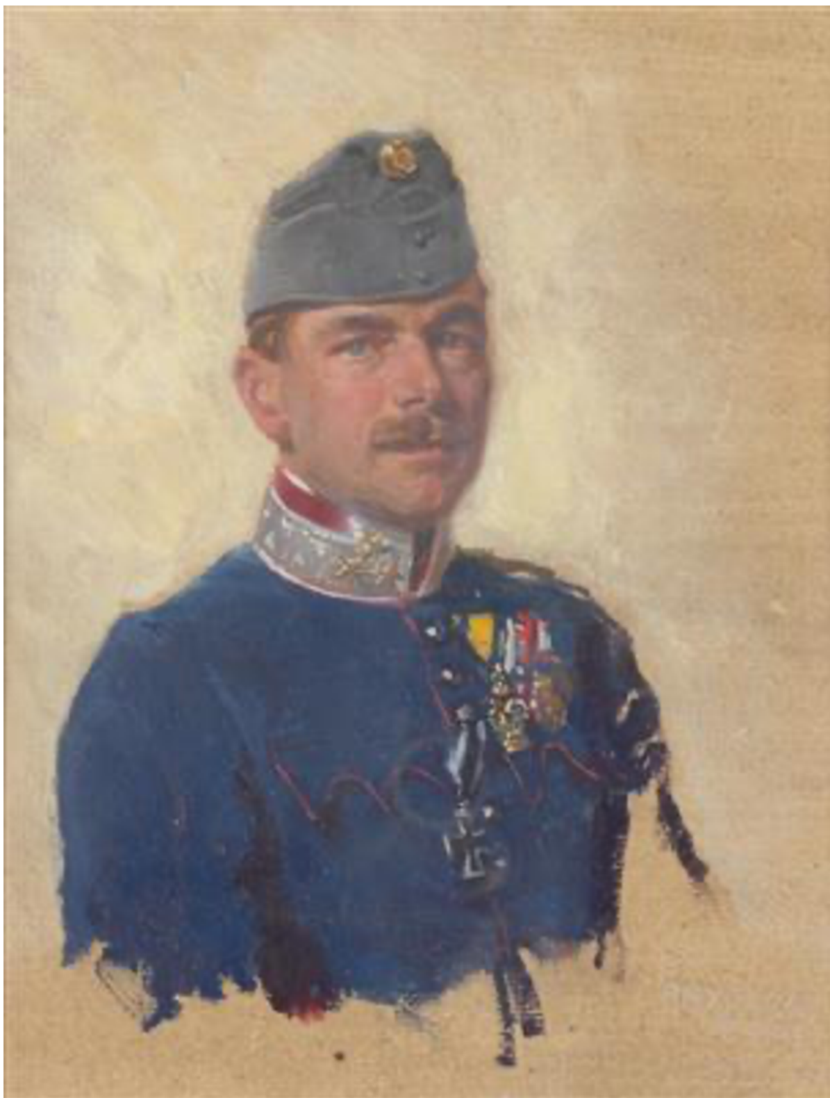
Obr. 7 Alexander Pock, Portrét plukovníka c. a k. hulání , 1915, soukromá sbírka