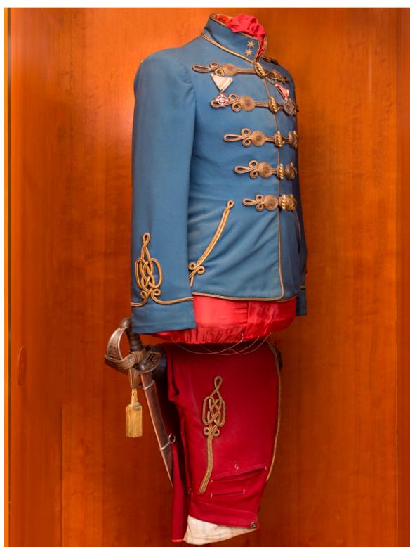
Obr. 22 Uniforma nadporučíka husarů, včetně rajtek a šavle M1869