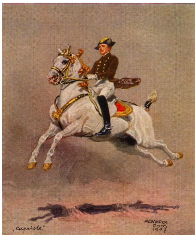
Obr. 3 Alexander Pock, Capriole , 1947, soukromá sbírka