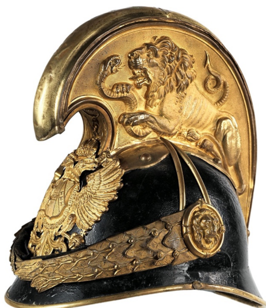
Obr. 19 Důstojnická dragounská přilbice M1905 s hřebenem a reliéfem lva bojujícího s hadem