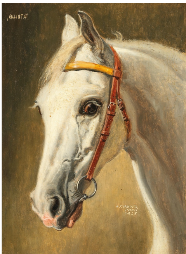
Obr. 2 Alexander Pock, Quinta , 1926, soukromá sbírka