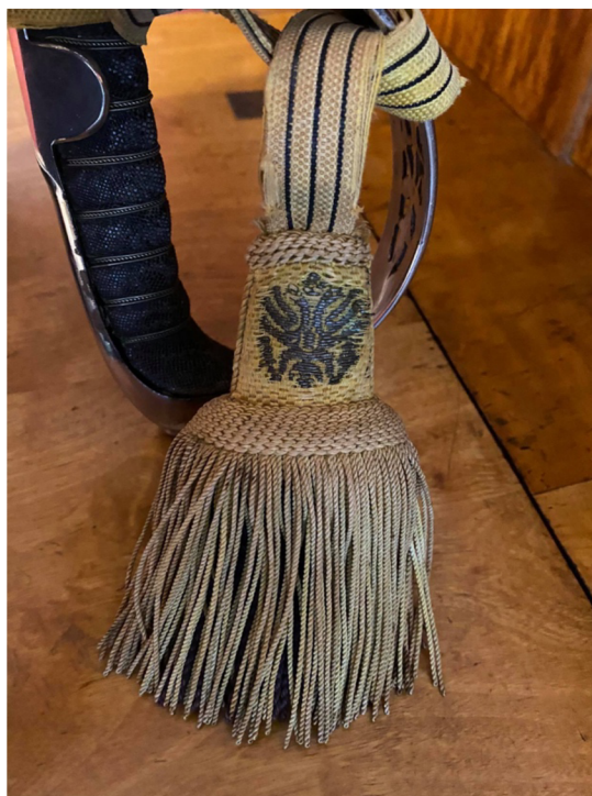
Obr. 15 Detail originálu hedvábného šavlového štrapece pro důstojníky