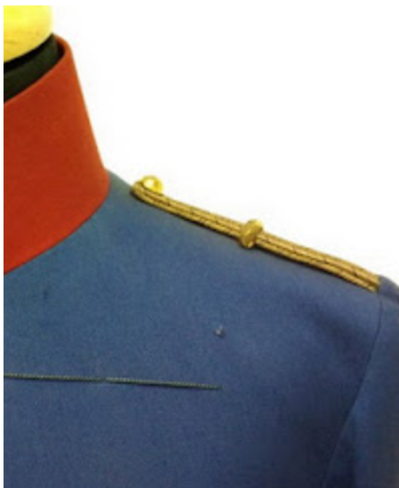
Obr. 11 Kalounový nárameník s posuvkou