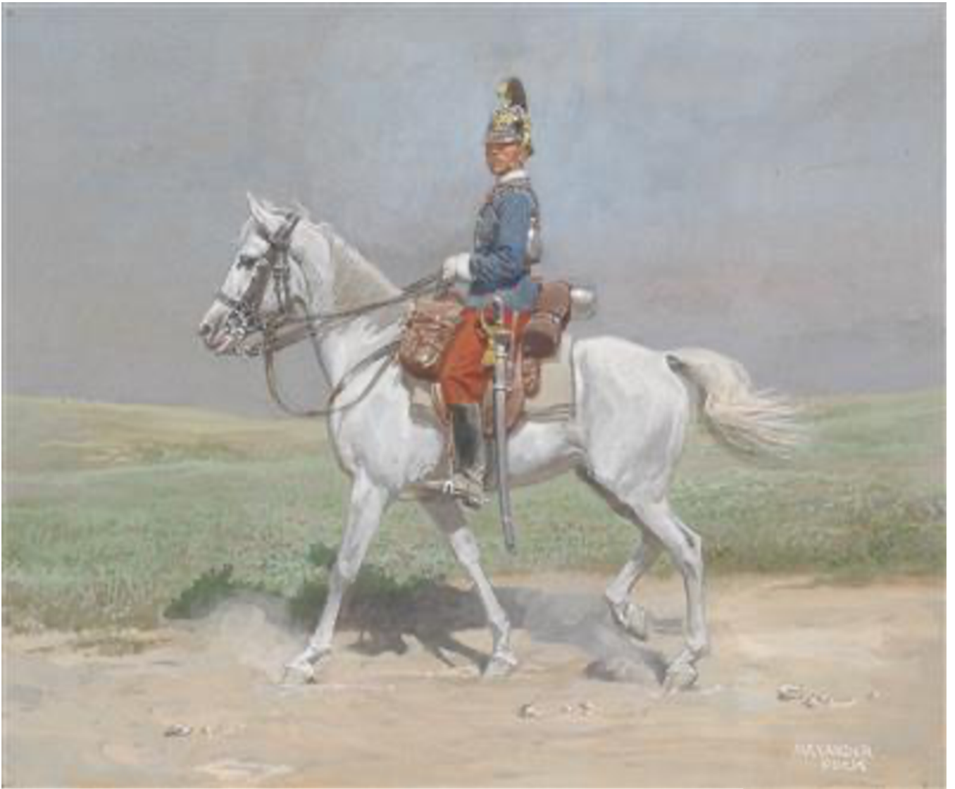
Obr. 8 Alexander Pock, Dragoun na koni , po roce 1904, soukromá sbírka