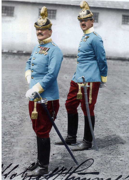
Obr. 18 Důstojníci dragounů, dobová kolorovaná fotografie