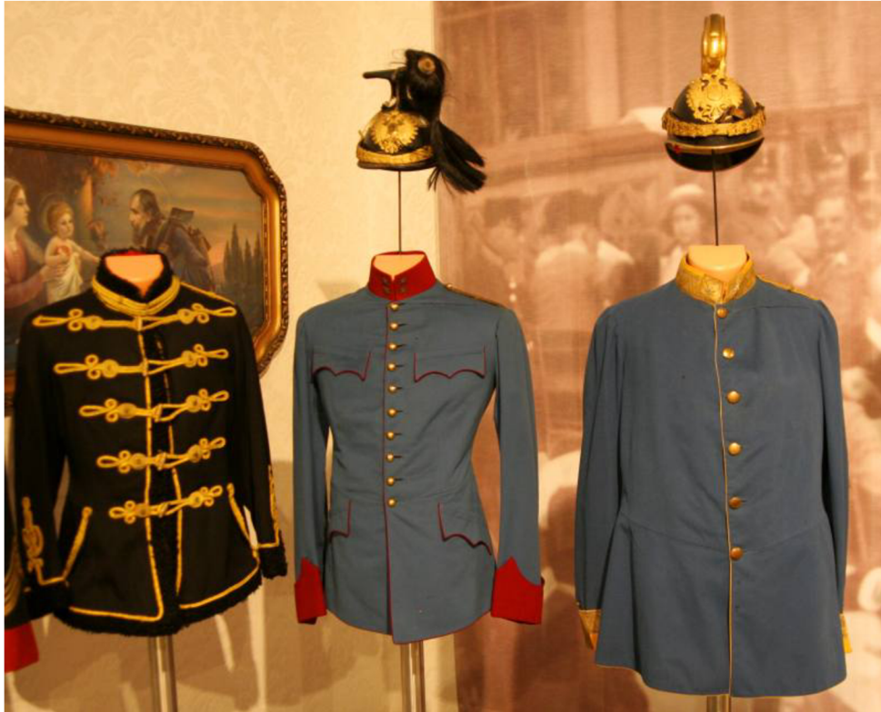
Obr. 17 Husaři, huláni a dragouni, zleva doprava: kabát poručíka husarů, sako a czapka nadporučíka hulánů a sako s přilbou majora dragounů