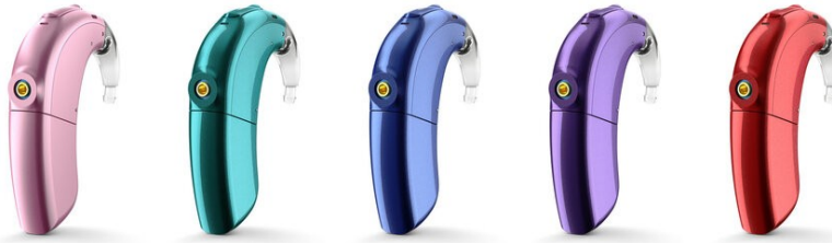
Obr. 9 – Procesory SKY CI M od Advanced Bionics.