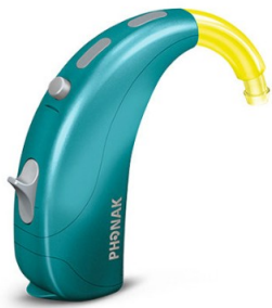
Obr. 3 – sluchadlo Phonak Sky V (PHONAK, 2022).

Děti si občas sluchadla vytrhnou, a proto je dobré je zajistit speciální gumičkou nebo klipy, které lze použít také pro děti s kochleárním implantátem, a zabránit ztrátě této kompenzační pomůcky. Další možností jsou čelenky a čepičky. Sluchadla látka překryje a zůstanou tak na místě, kde mají být. Opět zde existuje výběr ze řady barev a vzorů, které uspokojí i náročnějšího kupujícího.