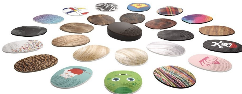
Obr. 7 – sada výměnných krytek na RONDO3 od Med-El (idětskýsluch.cz, 2021).

Další funkce, která uživatelům zpříjemní život je vylepšení systému eliminace hluku a zvýraznění řeči. Uživatel si to ani nemusí uvědomovat, protože to má na starosti umělá inteligence, která situaci sama vyhodnotí. Pro uživatele, kteří jsou po jednostranné implantaci a zároveň využívají sluchadlo, je velké plus využití možnosti bimodální synchronizace. Díky jejímu nastavení je zvuk sjednocený a pro uživatele obou těchto kompenzačních pomůcek příjemnější. Technologové mysleli i na údržbu a nabíjení procesorů a v nabídce se objevují nabíječky, které jsou zároveň sušičky a uživatelům nabízí pohodlné řešení při skladování a sušení (idětskýsluch.cz, 2021).