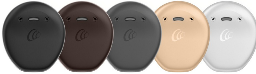
Obr. 8 – Single-unit KANSO2 od firmy Cochlear (idětskýsluch.cz, 2021).