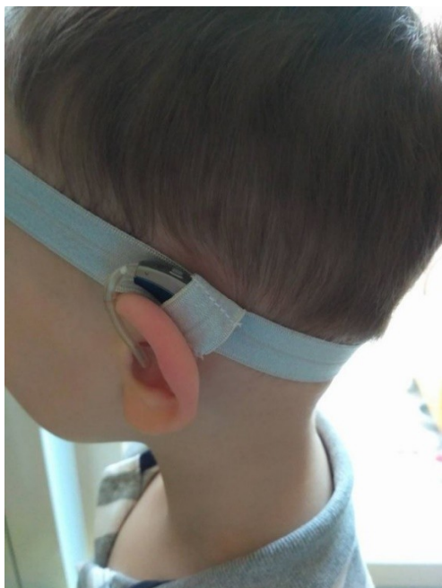
Obr. 5 – čelenka na sluchadlo (Vendsy, 2022)