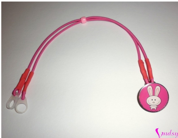
Obr. 4 – Klip Vendsy (Vendsy, 2022).

Děti si občas sluchadla vytrhnou, a proto je dobré je zajistit speciální gumičkou nebo klipy, které lze použít také pro děti s kochleárním implantátem, a zabránit ztrátě této kompenzační pomůcky. Další možností jsou čelenky a čepičky. Sluchadla látka překryje a zůstanou tak na místě, kde mají být. Opět zde existuje výběr ze řady barev a vzorů, které uspokojí i náročnějšího kupujícího.