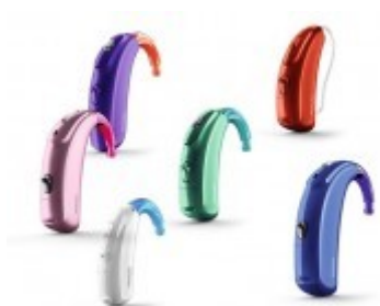
Obr. 2- sluchadla Phonak Sky B (PHONAK, 2022).