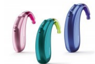
Obr. 1 – sluchadla Phonak Sky M (PHONAK, 2022).

Firma Phonak, kterou dotazovaní zmiňovali nejčastěji, nabízí pro děti sluchadla Phonak Sky Marvel, Phonak Sky B a Phonak Sky V. Sluchadla jsou pro děti odolná a bezpečná a je zde možnost využít také dobíjecí varianty, díky které odpadnou starosti s používáním jednorázových baterií.