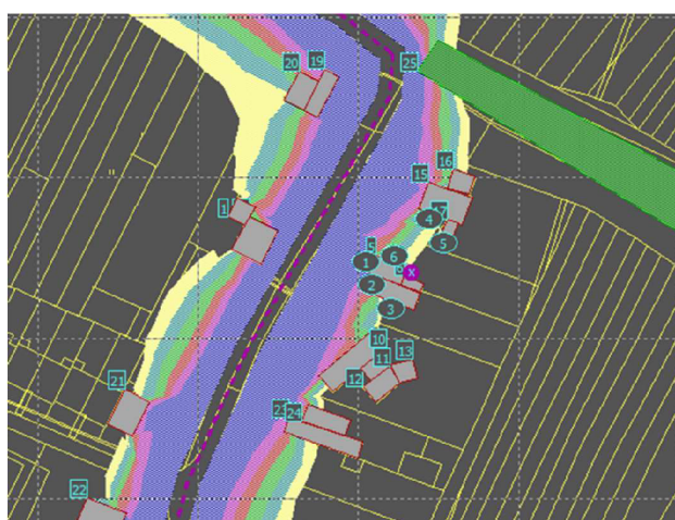
Obr. 4 – Hluková mapa pro denní dobu [Autor, Hluk+]