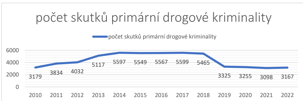
Graf 2: Vývoj primární drogové kriminality