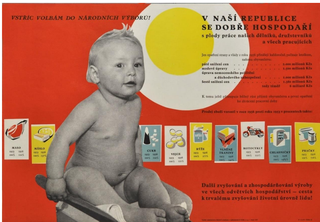
Obrázek 14: Předvolební plakát (1954). Sbirka Východočeského muzea v Pardubicích: Podsbírka plakátů (T), inv. č. T00111-01