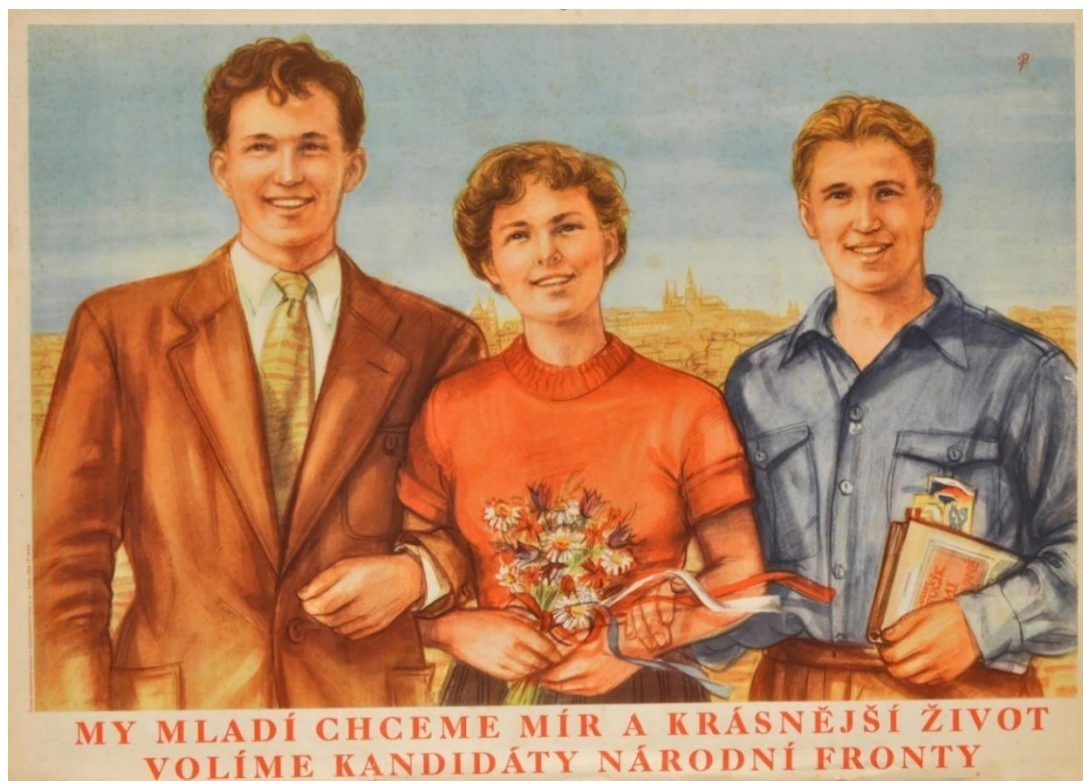
Obrázek 13: Předvolební plakát (duben 1954).

Většina plakátů byla nejspíše vydávána celorepublikově, protože se na nich nachází všeobecná předvolební hesla. Některé plakáty cílily na mladé obyvatelstvo (srov. níže), přicházející s hesly „my mladí chceme mír a krásnější život. Volíme kandidáty národní fronty“ nebo využívající k agitaci na plakátu obrázek usměvavého dítěte, kterému mají volby zajistit skvělou budoucnost. Nechyběla ani hesla, hlásající „mír a šťastný život obyvatelstva“ či běžné komunistické symboly – vlajka SSSR, kniha o Juliu Fučíkovi, atp. Velmi zajímavou kategorií pak byly předvolební plakáty vytvořené Josefem Ladou, které vznikly k oběma volebním letům – ty zřejmě cílily i na starší obyvatelstvo, které si s nimi mohly spojovat idylku na Ladových obrazech. Je zajímavé, že Ladovy obrázky zde kombinovaly současnost (nápis „MNV“) s nostalgií po minulosti – idealizovaný svět venkova před první světovou válkou (včetně vysloužilých rakouských vojáků v uniformách hrajících v kapele). Šlo zde především o to, že jeho obrazy každý znal.