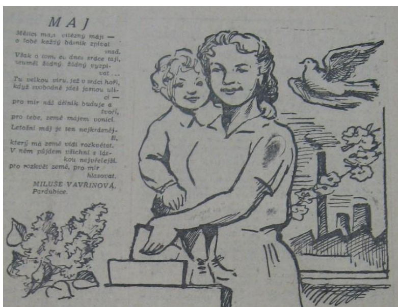
Obrázky 7–12: Příklady předvolební kampaně na stránkách Východočeské záře v r. 1954 a 1957.

Vilém SERBUS, ředitel Okresní lidové knihovny, Hollice v Čechách.