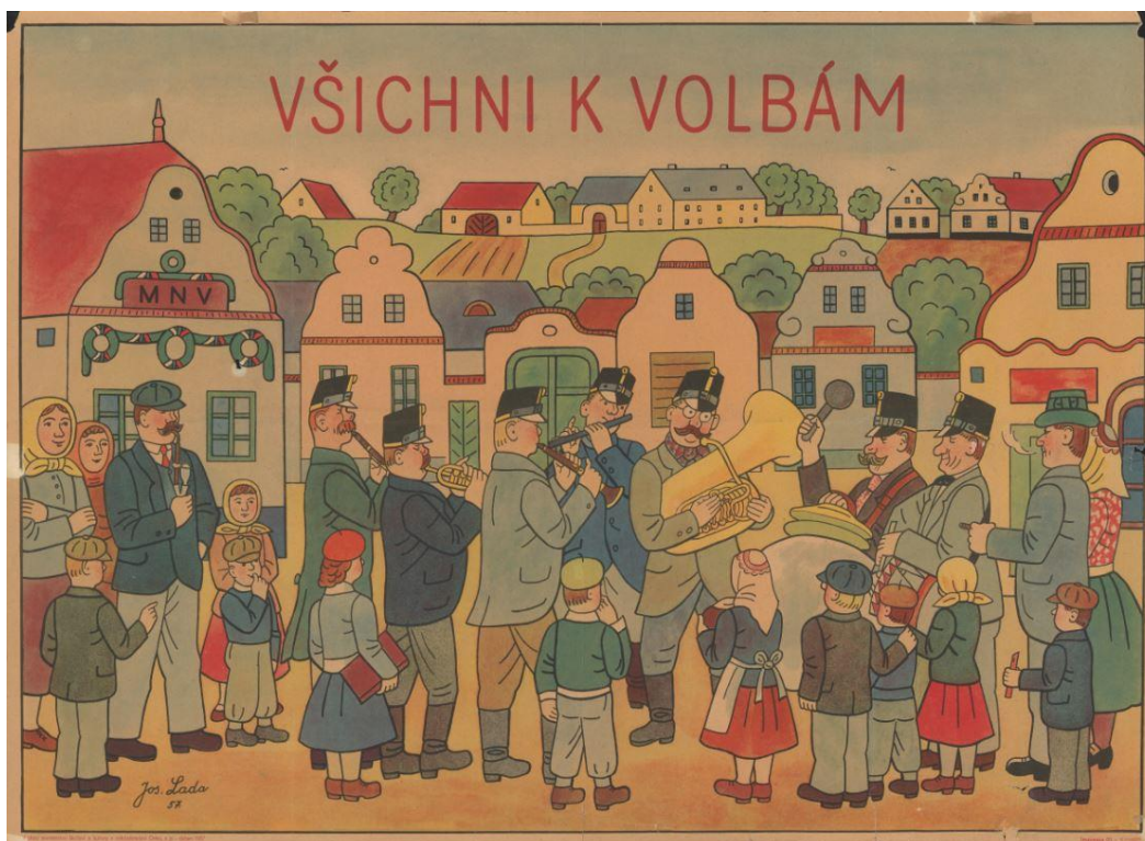
Obrázek 16: Ladovský předvolební plakát (duben 1957).