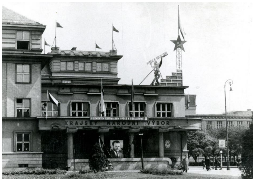
Obrázek 1: Sídlo KNV Pardubice (Pardubice. Oslavy KSČ. Náměstí republiky (Stalingradské). Krajský národní výbor, 1953, autor neznámý). Zdroj: Východočeské muzeum v Pardubicích, sbírka Fotografie.