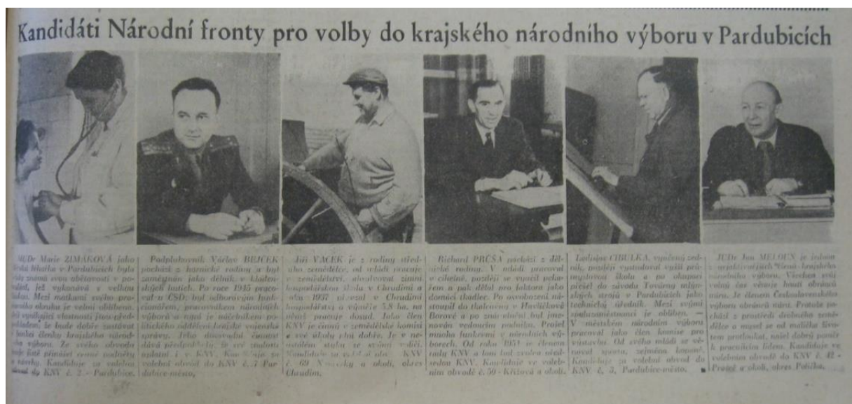
Obrázek 6: Zobrazení kandidátů pro volby do KNV v roce 1957 v periodiku Východočeská zář. Zdroj: Východočeská zář, roč. 1, č. 31, dne 12. dubna 1957, Kandidáti Národní fronty pro volby do krajského národního výboru v Pardubicích, s. 1.

Mimo tuto rubriku, se v předvolebním týdnu v tisku vyskytovalo mnoho článků věnujících se volbám – v podstatě to působilo tak, že se všichni obyvatelé věnují pouze tomuto tématu. Důležitost voleb nám ale také na stránkách Východočeské záře vysvětluje např. studentka pedagogické školy, různí dělníci, devatenáctiletá svazačka, důchodci, předseda JZD, spisovatelé, pracující matky, čtenáři ve svých dopisech – zástupci všech vrstev obyvatelstva. A jaké tyto voliči uváděli důvody své volby kandidátů NF? Velmi často se objevoval argument, že voliči kandidáty dobře znali a věřili jim: „na kandidátku národní fronty se mohou dostat skuteční lidé, kteří něco dovedou udělat, rozumí své práci a chtějí dobře splnit své poslání. Vždyť si je lidé sami vybírají a při tom nehodnotí, jaký mají majetek, ale jaký je to člověk.“ 631 Dále bylo jako důvod volby kandidátů NF uvedeno to, že za první republiky se žilo mnohem hůře: „jak těžko se žilo pracujícím a nezaměstnaným za první republiky, jak se opravdu velmi těžko shánělo to nejnужnější živobytí [...] dnes před volbami je potřeba to připomínat našim mladým lidem.“ 632 Tento argument se objevoval také v rozhovorech s matkami dětí, které uváděly, že půdou volit „pro štěstí svých dětí.“ 633 Jedním ze silně rezonujících argumentů byl