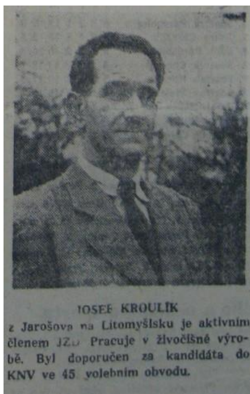
Obrázek 4: Zobrazení kandidátů pro volby do KNV Pardubice v periodiku Východočeská zář r. 1954.

(předseda, tajemník a náměstkové). Těmto osobám byl věnován větší prostor, ve kterém se čtenáři (potažmo voliči) mohli dozvědět detailnější informace – jakýsi osobní medailonek, zahrnující rodinnou situaci, dobu studií, činnost za druhé světové války, působení za třetí republiky, poúnorové působení a dosavadní zkušenosti ve státním a stranickém aparátu. Vynechány nebyly ani osobní a charakterové rysy.