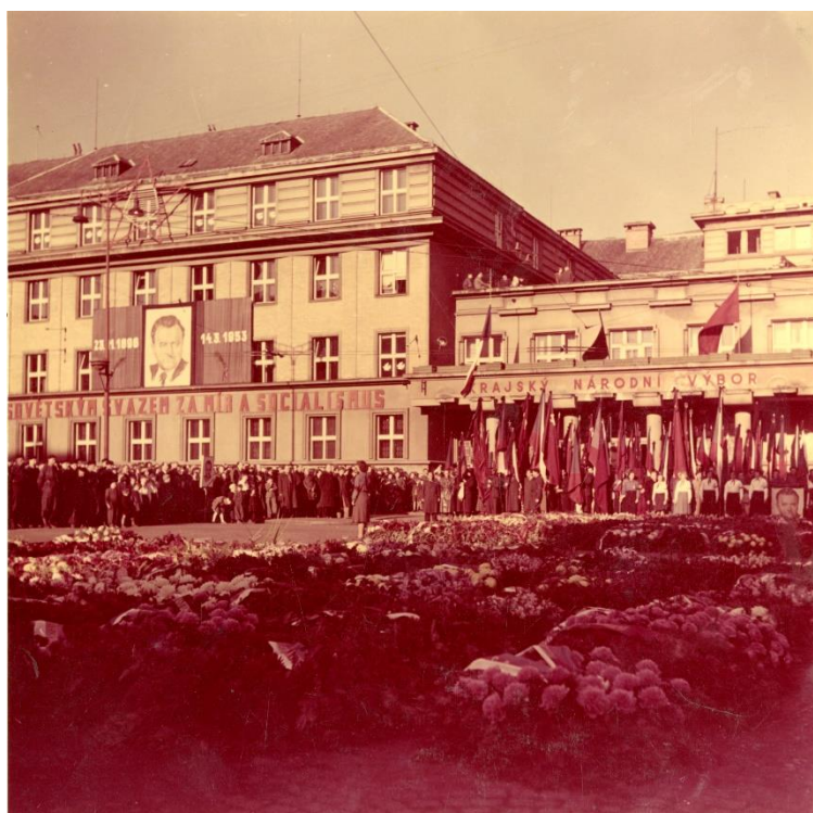
Obrázek 2: Sídlo KNV Pardubice, jiný pohled (Pardubice – tržna za prezidenta Klementa Gottwalda, prapory a věnce na náměstí Republiky, 1953, autor Řeřucha J.) Zdroj: Východočeské muzeum v Pardubicích, sbírka Fotografie.