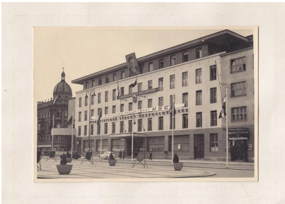
Obrázek 3: Hotel Stalingrad, napravo jedno ze sídel KV KSČ (Hotel Grand, Krajská konference 7.–8. května 1949, autor neznámý). Zdroj: Východočeské muzeum v Pardubicích

Funkce na sekretariátu KV KSČ byly velmi lukrativní pracovní pozice, což dokládá výše platu jednotlivých funkcionářů krajského sekretariátu. Přičemž plat politického tajemníka vyšplhal v roce 1948 až na 7 500,- Kč.