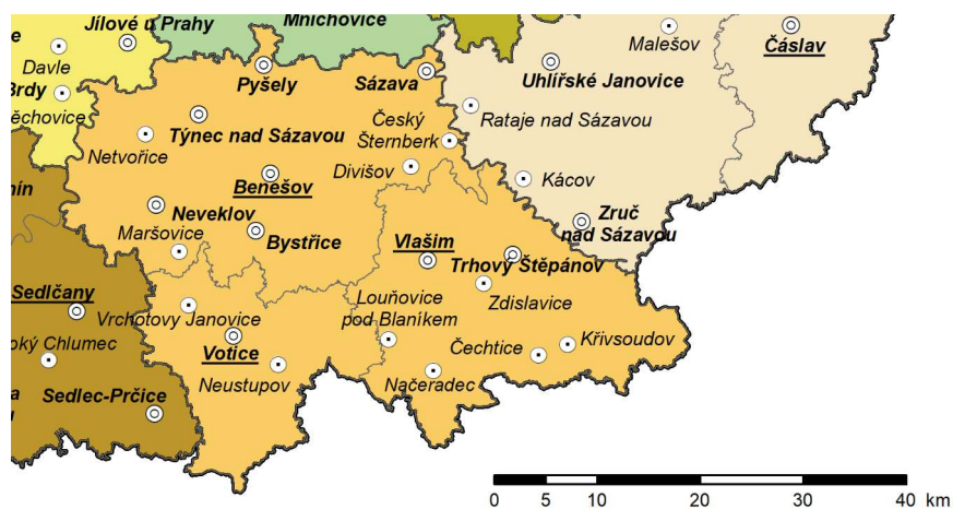
Obrázek 2. Města a městyse v okrese Benešov (2020)