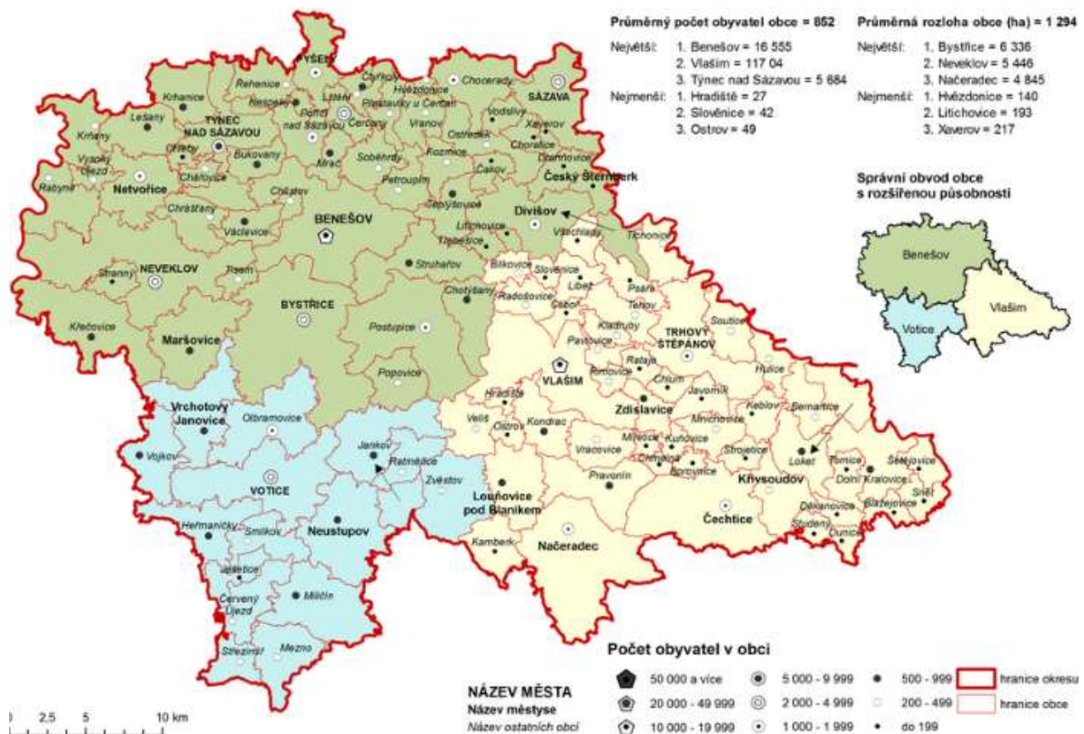
Obrázek 1. Obce a SOORP okresu Benešov (k 1. 1. 2016)

Zdroj: Český statistický úřad Středočeského kraje