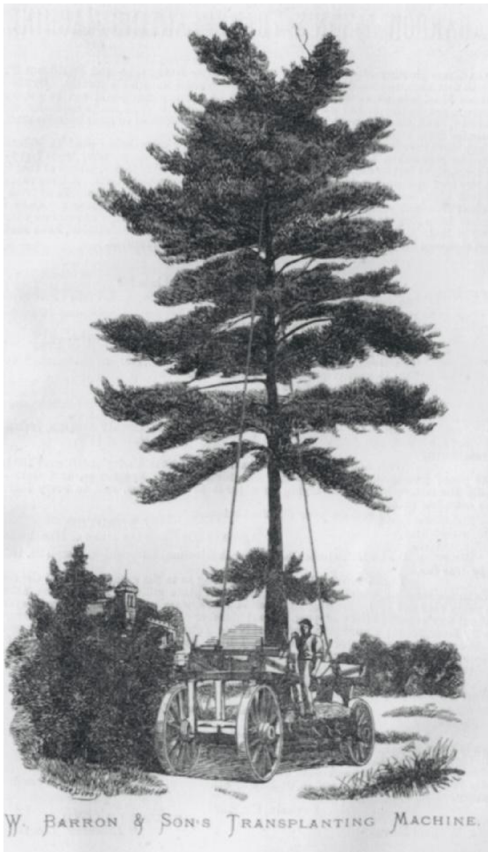
Obrázek č. 1 Stroj na transportování dřevin Williama Barrona