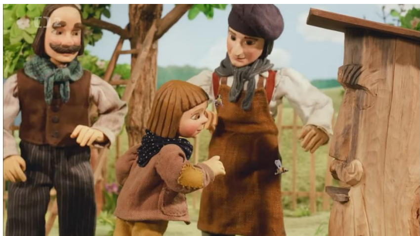
Příloha č.11- obrázky k pohádce Jak kluci hledali poklad