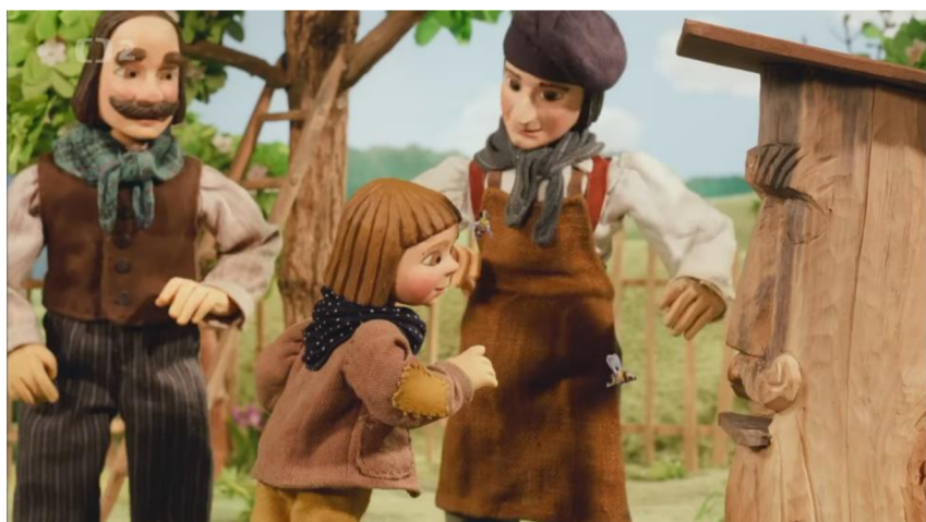
Příloha č.11- obrázky k pohádce Jak kluci hledali poklad