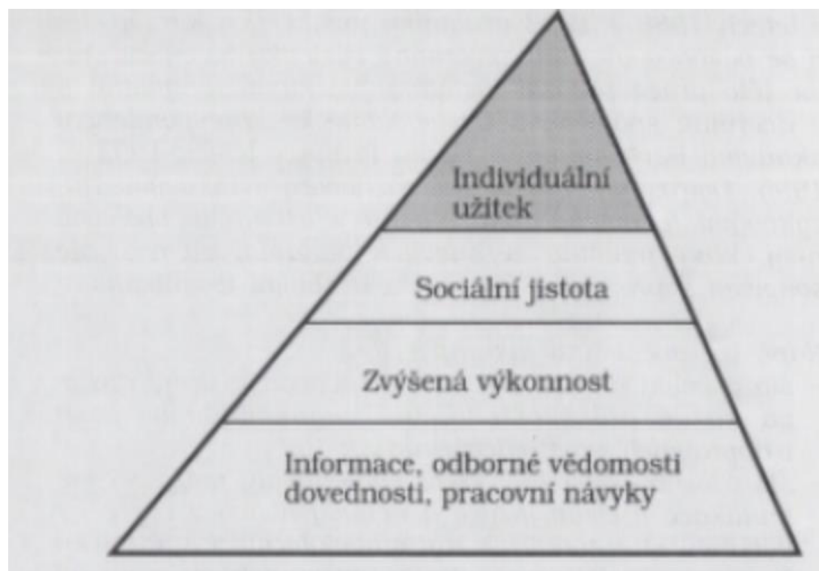
Obrázek č. 1: Pyramida motivace učení (Mužík, 1998, s. 10)

Z pyramidy učebních motivů vychází najevo, že vzdělávání dospělých je založeno hlavně na získávání nových informací; formování odborných vědomostí a dovedností nebo pracovních návyků. Vzdělávací procesy jsou