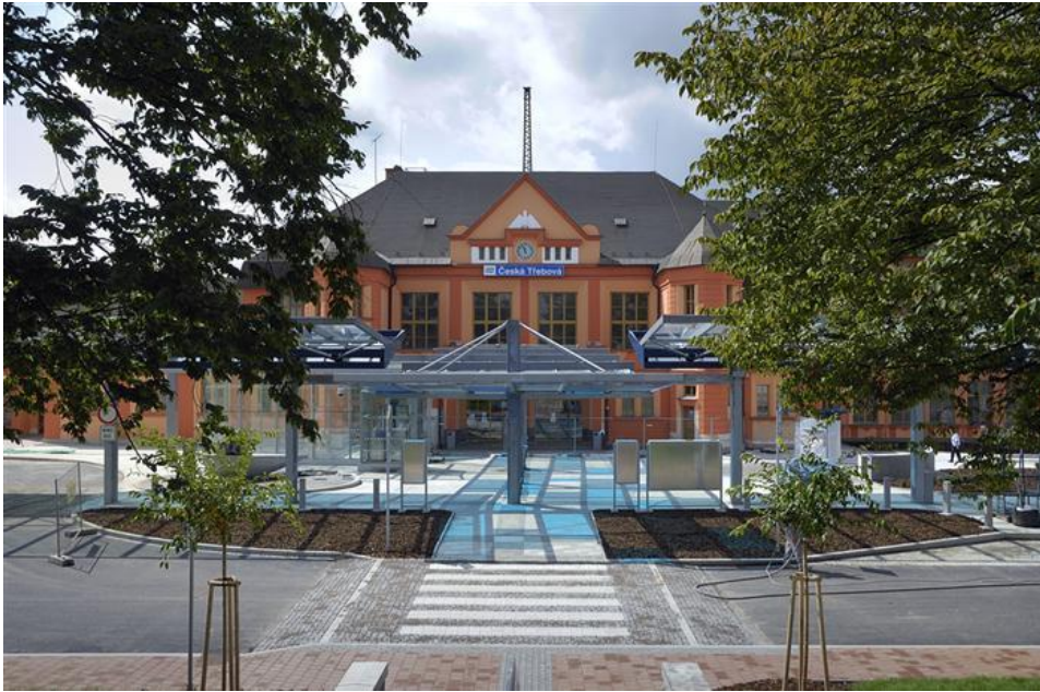
Multifunkční dopravní terminál Česká Třebová