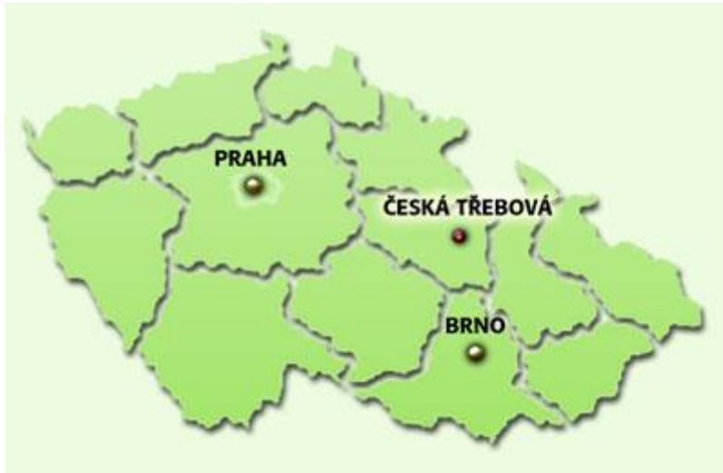
Mapa České republiky

Česká Třebová je město na pomezí Čech a Moravy, ve východní části Pardubického kraje, v údolí řeky Třebovky mezi Kozlovským a Hřebečovským hřbetem. Město tvoří katastrální území Česká Třebová, Parník, Lhotka, Skuhrov, Svinná a Kozlov. Části Skuhrov, Svinná a Kozlov nejsou s městem spojeny souvislou zástavbou. Mají také nevýznamný počet obyvatel. Jednou z největších předností České Třebové je její překrásné okolí. Rozlohou je čtvrtým největším městem v okrese Ústí nad Orlicí a první místo zaujímá počtem obyvatel, kterých je k 01. 01. 2014 podle dat ČSÚ 15 783.