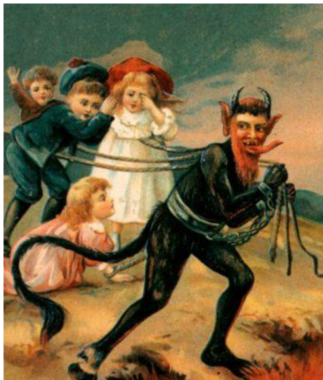
Abbildung 1 – Krampus

Quelle: Vgl. MÜLLER, Saman. German Mythological Creatures from German Folklore . GermanyDaily. Berlin. Germanydaily, 2021, 24 May 2021, Online im Internet: URL: https://germanydaily.de/culture/german-mythological-creatures/ [Abrufdatum: 2. 4. 2023].