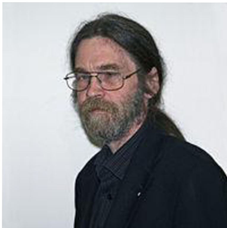
Abbildung 3 – Wolfgang Hohlbein