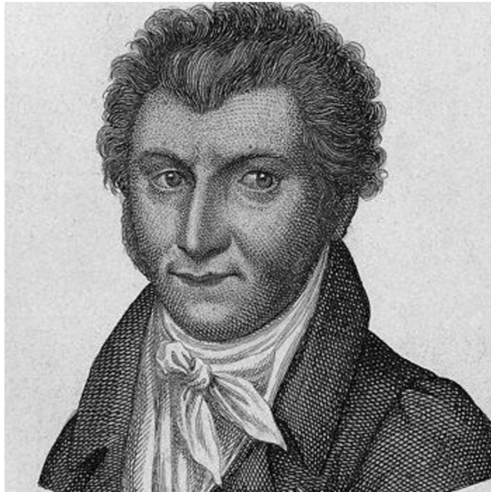
Abbildung 2 – Ernst Theodor Wilhelm Hoffmann

Quelle: Vgl. Ernst Theodor Wilhelm Hoffmann. Goethe Institut. Praha, 1990, Online im Internet: URL: