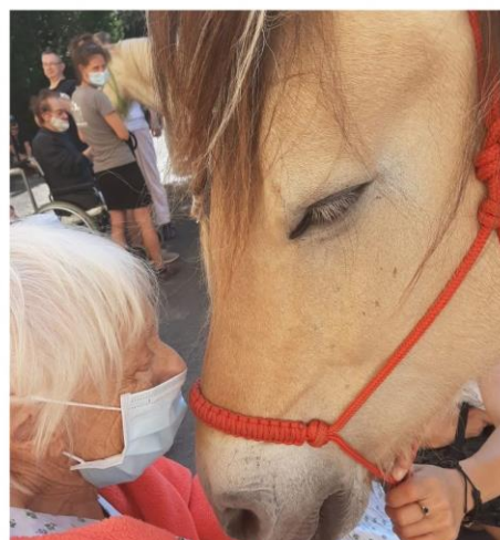
Obrázek 2, 3, 4, 5: klisna Hoogy s pacienty