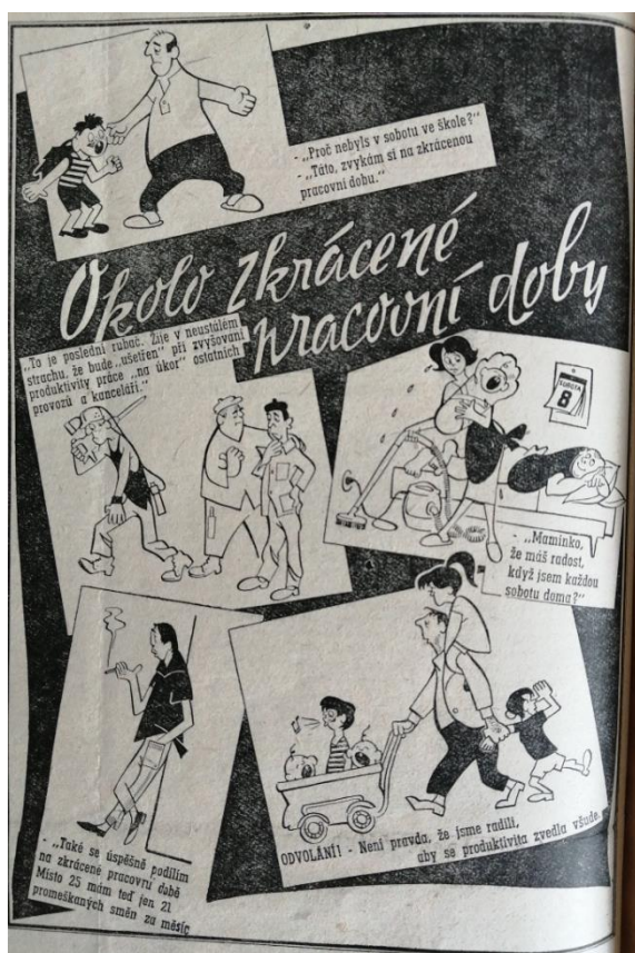
Obrázek č. 3 125

Svémi kresbami se vyjadřoval k aktuálně probíranému tématu na dolech a mezi samotnými horníky. Rozsáhlou kresbou „Okolo zkrácené pracovní doby“ (obrázek č. 3) reagoval na často zveřejňované články ze stran vedení o přípravách na zkrácení pracovní doby.