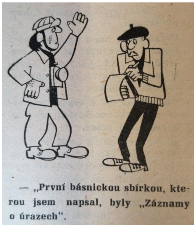
Obrázek č. 4 126

Často se vyjadřoval k mnohokrát probíranému tématu bezpečnosti práce a onu problematiku lehce zesměšňoval. (obrázek č. 4)