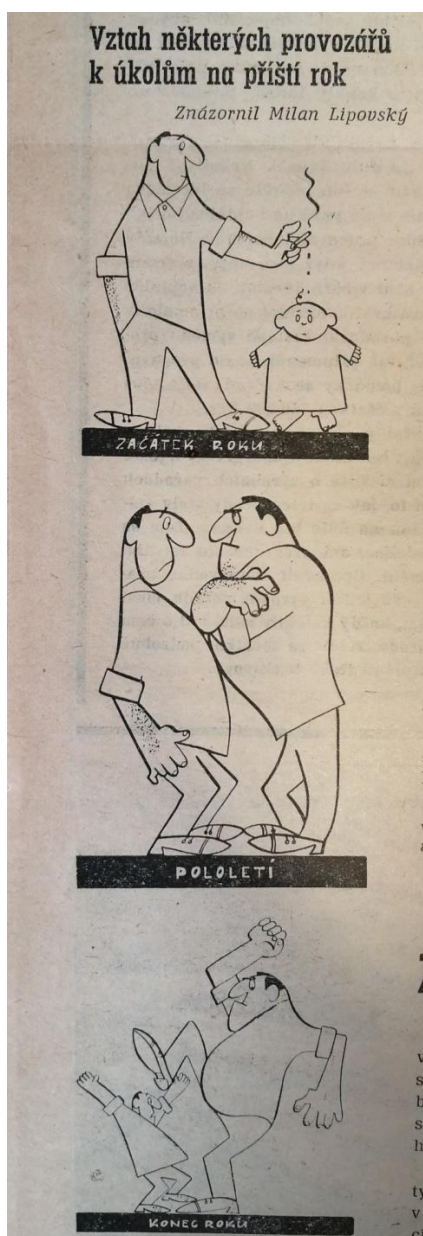
Obrázek č. 5 127

Kresby Lipovského se vždy v nějakém směru týkají práce na VUD nebo jsou zasazeny do důlního prostředí a jejich aktéři jsou přímo horníci. Skrze takové ilustrace kritizuje nešvary panující mezi zaměstnanci, zejména ledabylost. Karikatury přesto nesou komický podtext a jejich úkolem je zejména bavit. Příkladem je obrázek č. 5.