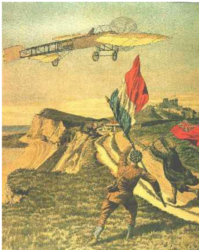
Obrázek 1: První mezinárodní let letadlem těžšího vzduchu přes kanál La-Manche [3]

Diplomatické incidenty vyvolané přeletem francouzské hranice německými letadly přiměly vlády obou zemí, aby v roce 1913 uzavřely smlouvu, v níž se uznávalo právo státu rozhodovat o režimu vzdušného prostoru nad jeho územím. Smlouva přímo stanovila, že vojenská letadla jednoho státu mohou uskutečňovat lety nad cizím územím pouze na základě povolení druhé strany. Lety nevojenských letadel nad cizím územím se povolovaly pouze za podmínky, že orgán druhého státu vydal osvědčení o právu na let v tomto státě.